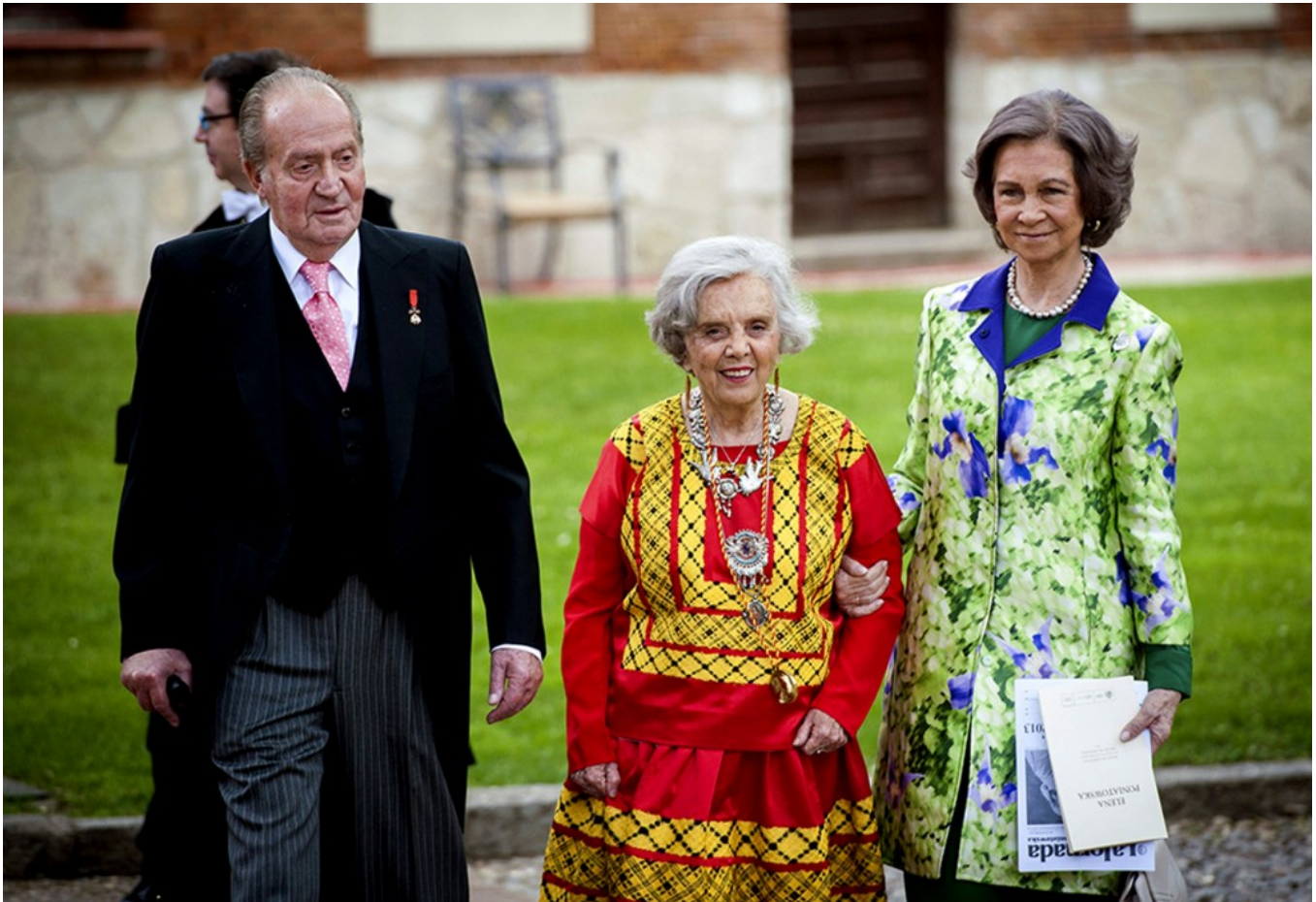
Elena Poniatowska z hiszpańską parą królewską po otrzymaniu nagrody Premio Cervantes.

Wybrała za kandydata na męża dużo starszego od siebie światowej sławy astrofizyka, odkrywcę 12 gwiazd, będącego o krok od Nagrody Nobla, Guillermo Haro. Ale znajomość z nim nie zaczęła się łatwo. Elena poprosiła go o wywiad. Zapytał czy coś wie o astronomii, powiedziała, że nic. Gdy ciągle go nagabywała, by mieć to z głowy, zaproponował, że dostarczy jej odcinki swoich publikacji, niech z nich stworzy rodzaj wywiadu. Tak szybko nie pozwoliła się zbyć. La Poni była nie tylko odważna i szczerą do bólu, ale była też niezwykłym uparciuchem. Odrzuciła tę propozycję, nachodziła wciąż astronoma i dopięła swego. Pierwszy wywiad był wprost katastrofalny. Ona chciała