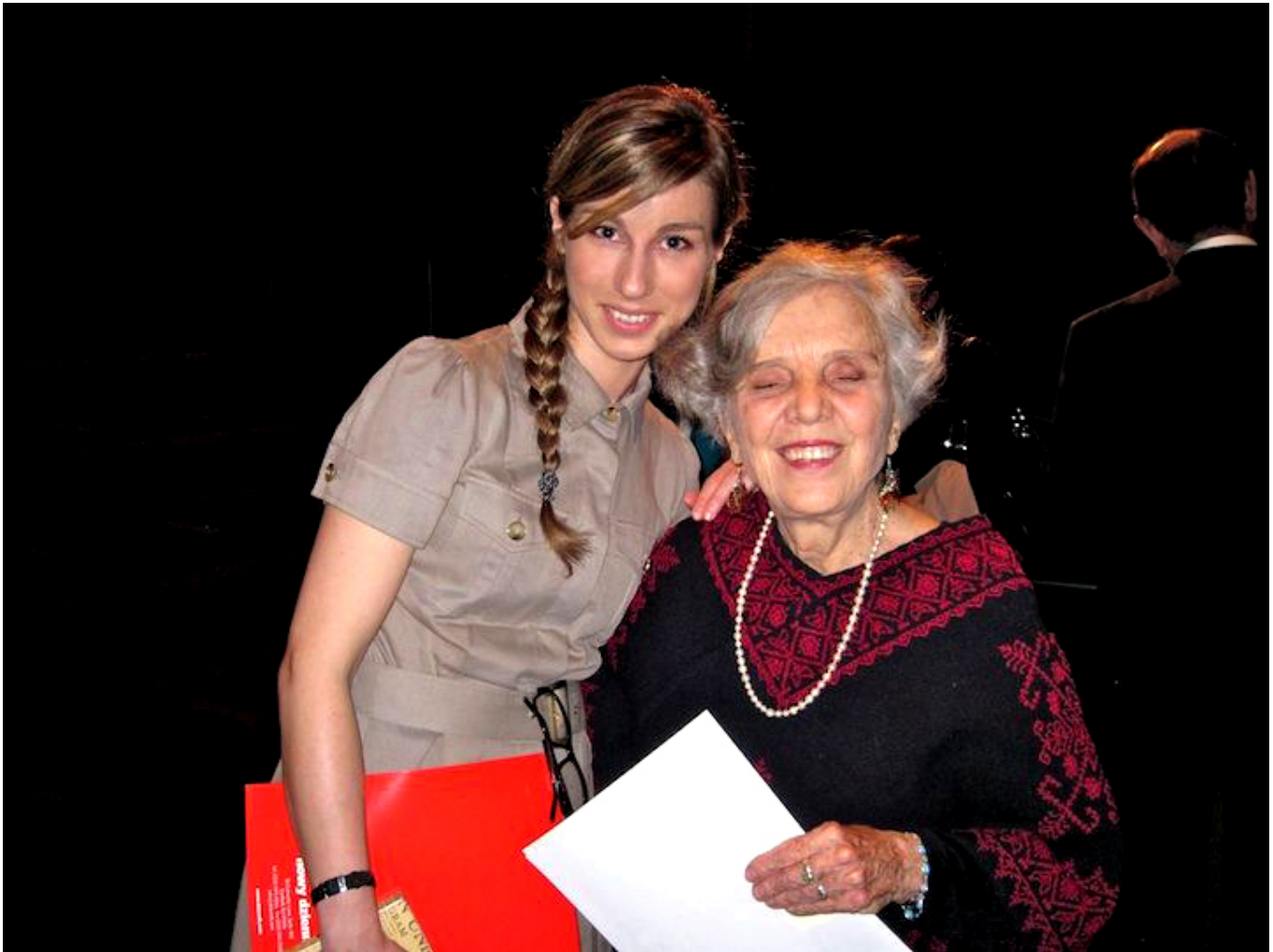
Elena Poniatowska (z prawej) w Polsce.