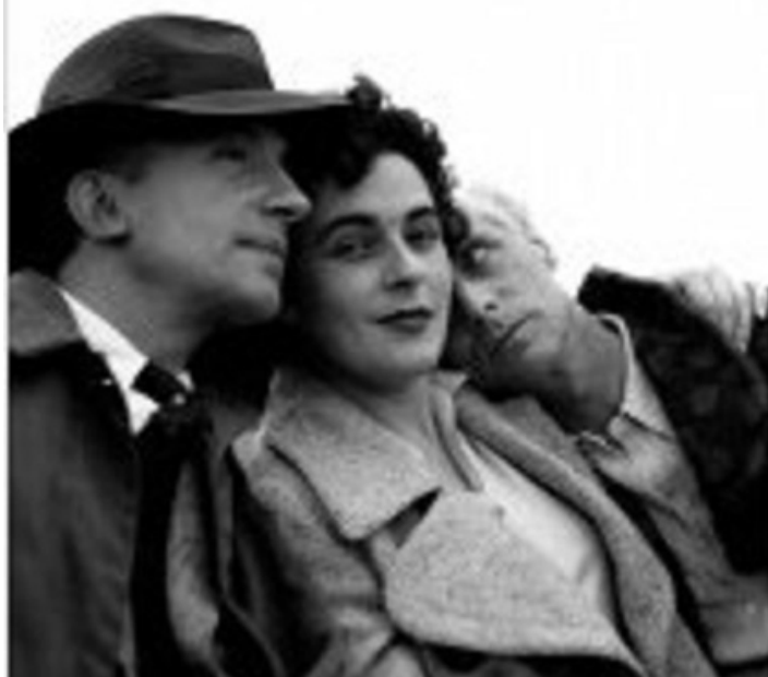
Okladka biografii Leonory Carrington, 2011 r.