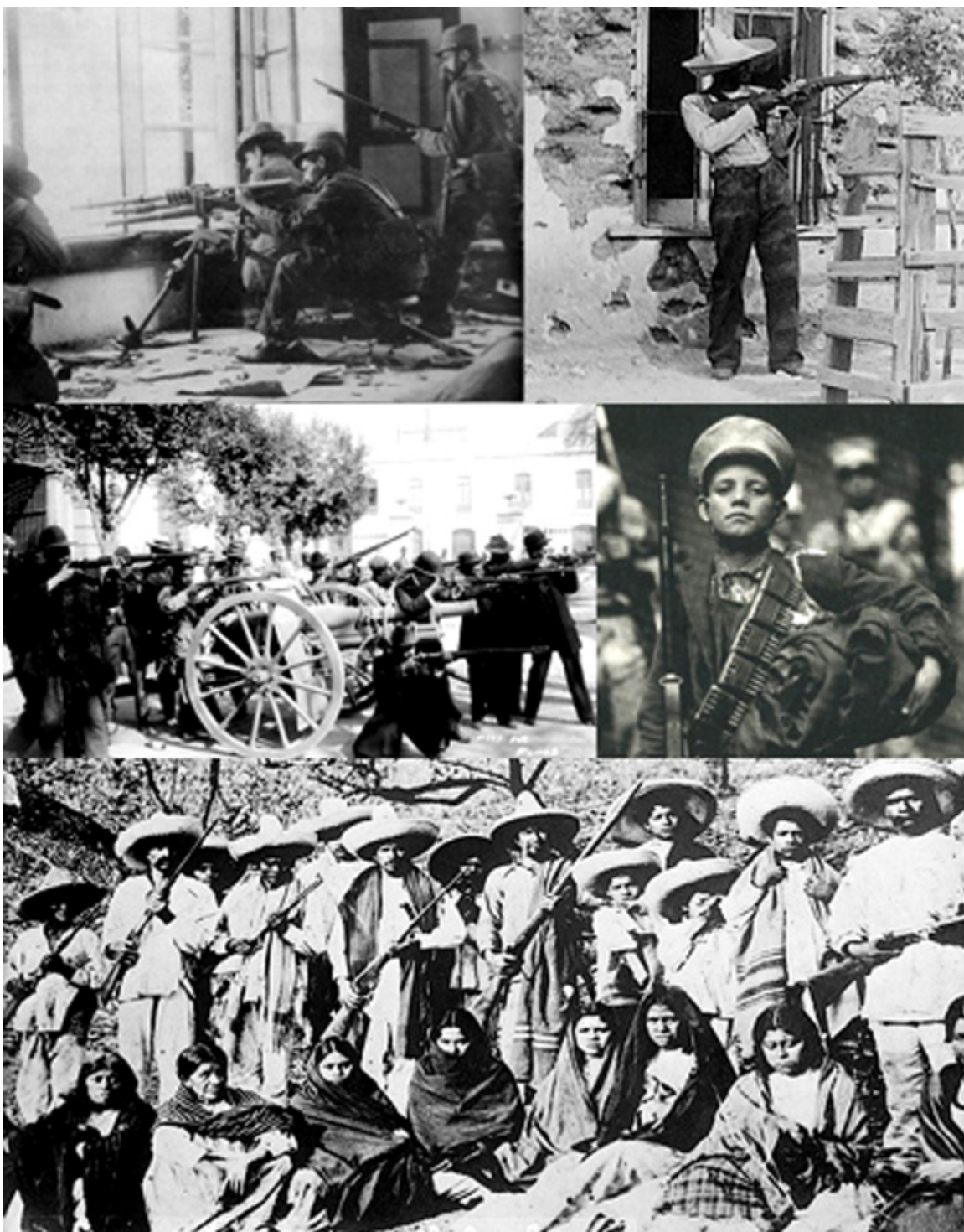
Obraz rewolucji meksykańskiej 1910-29.