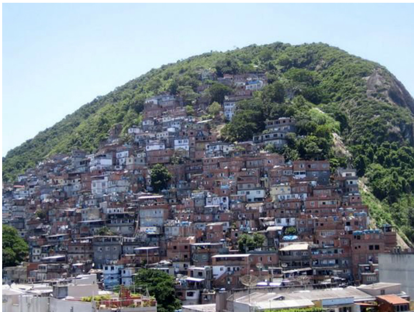
Meksykańska fawela - czyli domostwa najbiedniejszych.