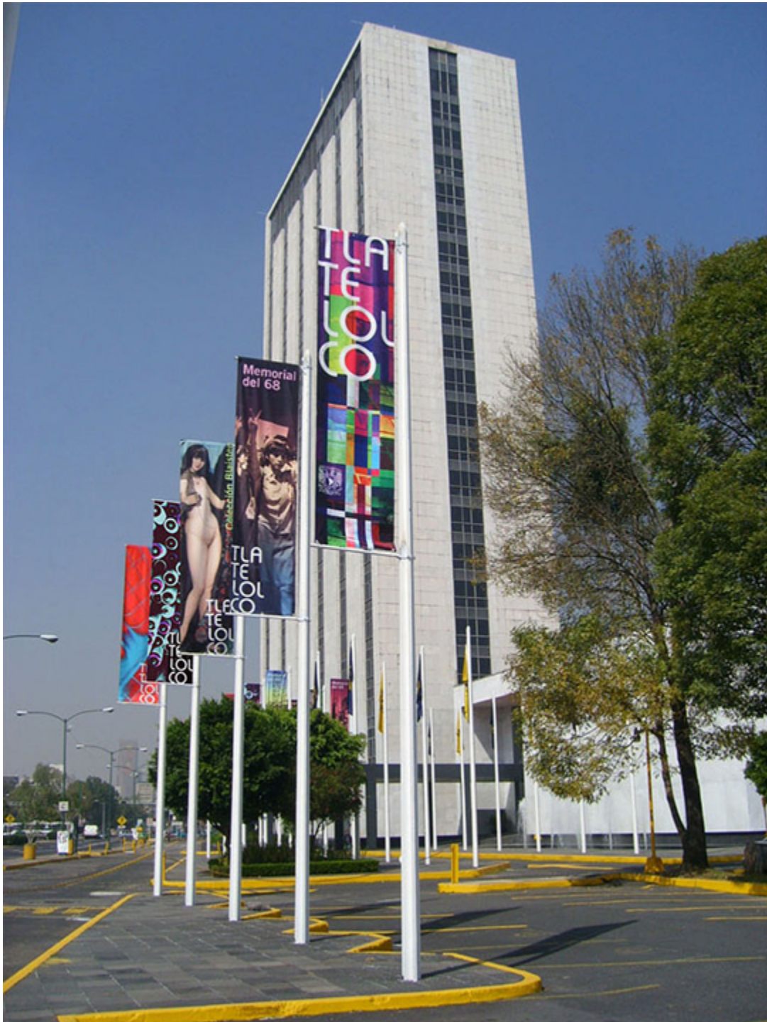
Miejsce masakry studentów, plac Tlatelolco.

Radykalizuje się po morderstwie setek ludzi, w większości studentów, w roku 1968. Korzystając z faktu, że za kilka dni miały się zacząć w Meksyku Letnie Igrzyska Olimpijskie, studenci wyszli na ulicę, ogłosili strajk, by mieć szansę przekazać