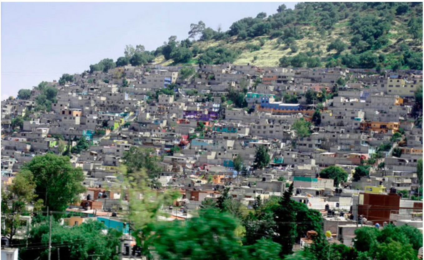
Meksykańska fawela - czyli domostwa najbiedniejszych.

Sam może stałbym się lewicowcem, gdybym tam mieszkał i doświadczał tego, co tam się dzieje. Byłem w Acapulco, jednym z najbardziej bogatych, znanych i okrzyczanych miast turystycznych Meksyku. Wystarczyło zboczyć na boczną uliczkę z jedyne w mieście eleganckiego bulwaru zabudowanego hotelami dla turystów, czy wziąć lornetkę do ręki i przyjrzeć się otaczającym miasto wzgórzom. To fawele: tu wielodzietne rodziny gnieźdzą się często w jaskiniach bez wody bieżącej, bez elektryczności. To wszystko woła o pomstę do nieba i ta pomsta prędzej czy później może spaść i zmieść elitę. Ale jakimi będą nowi rządzący?