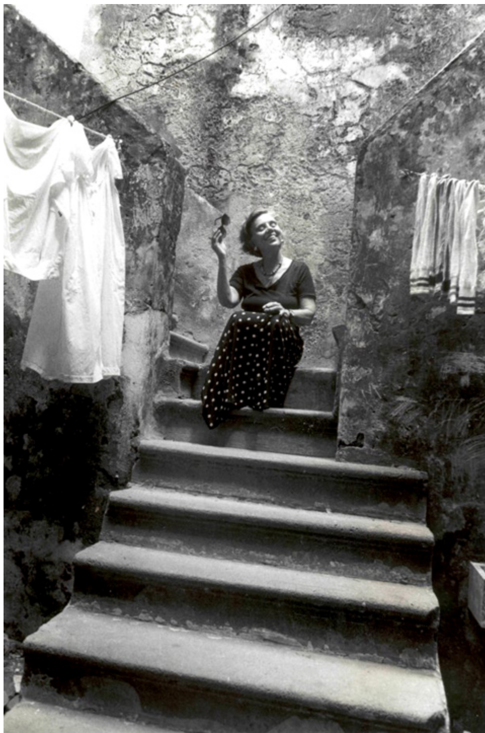
Elena Poniatowska

niebezpiecznym, wtedy cała trójka przeniosła się do Meksyku. Helena dotarła tu jako 10-letnia dziewczynka.