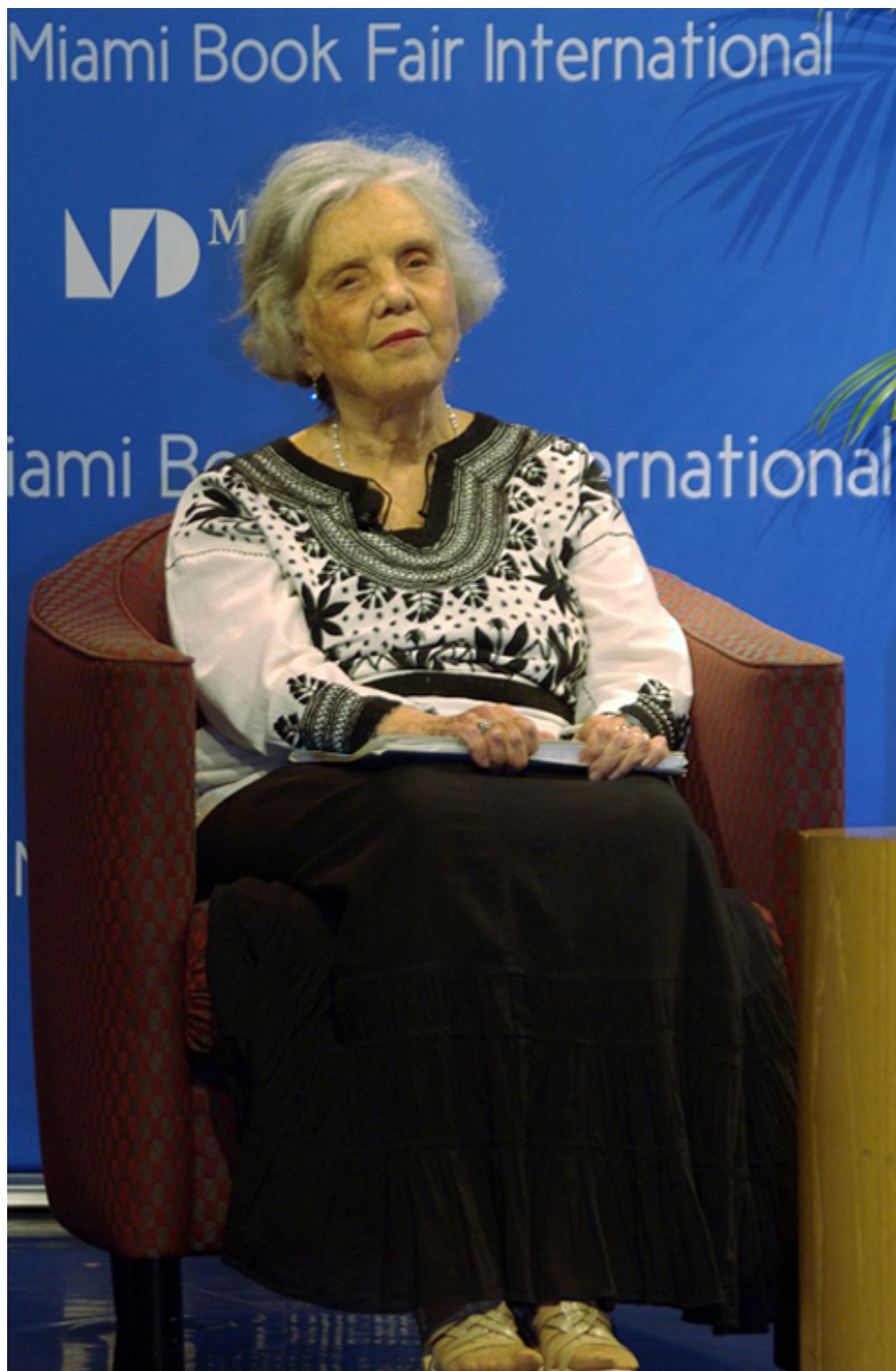
Elena Poniatowska na Międzynarodowych Targach Książki, Miami 2014 r.

Artykuły i książki Eleny Poniatowskiej na temat wydarzeń w Meksyku nie miały charakteru czysto dziennikarskiego – do opisu faktów dorzucała swoje uwagi, przekonania, przemyślenia, czyta