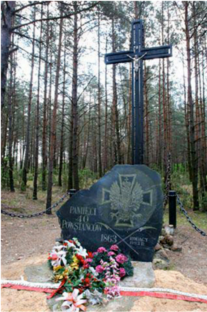
Mogiła 1863 r.