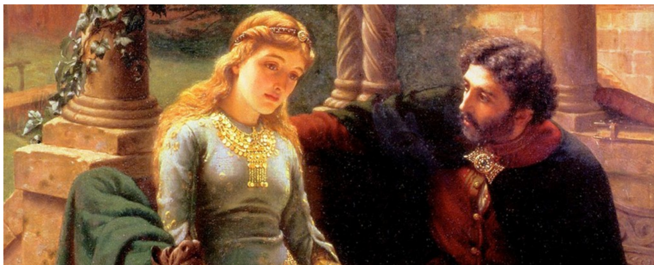
Abelard i Heloiza, fot. Edmund Blair Leighton.

Zakochanie nie jest chorobą, tylko niekochanie. Jeśli miłość wchodzi oczyma, to ślepi są ci, którzy nie kochają.