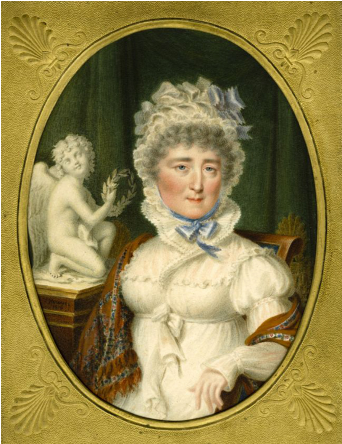
Księżna Marszałkowa Izabela Lubomirska z posągiem Henryka Lubomirskiego.

Zobaczyła go pierwsza dama w Królestwie, najbogatsza kobieta Polski, zauroczyła się dzieciakiem (była wtedy wdową, urodziła tylko kilka dziewczynek). Była to Elżbieta Czartoryska, po