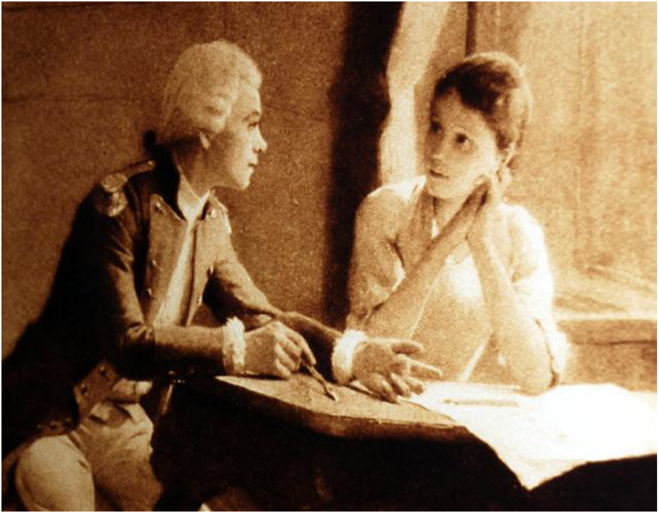
Zygmunt Ajdukiewicz, Tadeusz Kościuszko uczy Ludwikę Sosnowską.