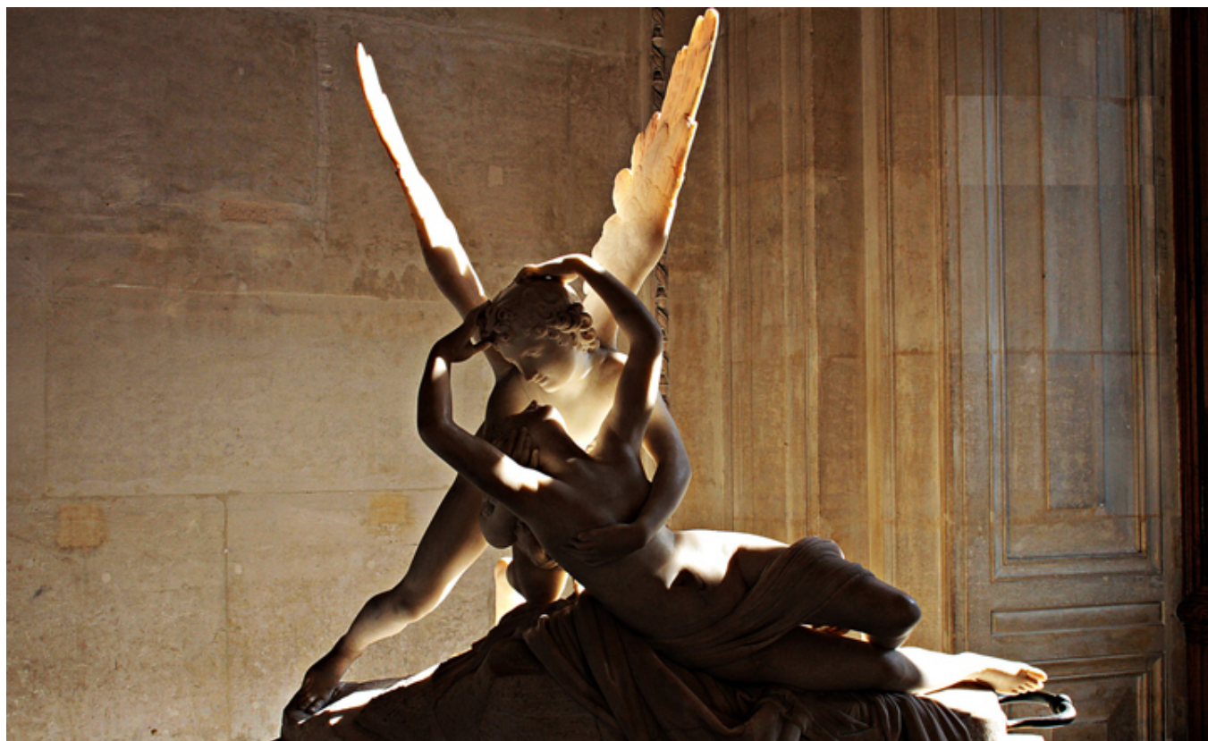
Antonio Canova, Eros i Psyche, Louvre.