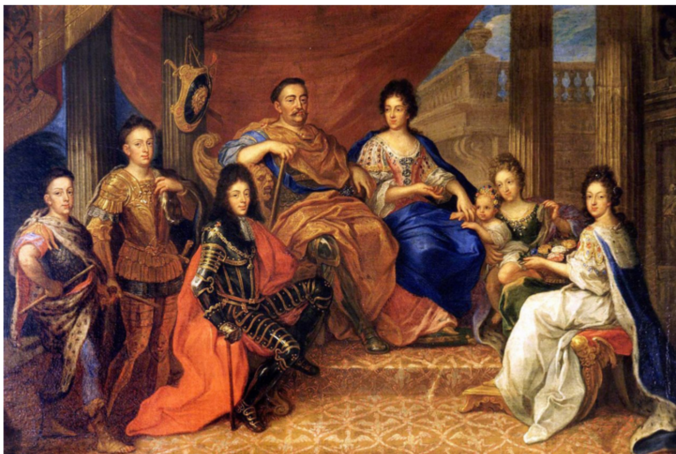
Jan III Sobieski z żoną Marysieńką, fot. Wikipedia.

Co prawda kochankowie zaczynają wspominać tu i tam o „pierzynce”, „spólnych zabawach”, ale dopiero w XVII wieku, w czasach największego dobrobytu (przynajmniej w klasach uprzywilejowanych) i potęgi politycznej Polski, epistolografia miłosna staje się bardziej cielesna, bardzo pompatyczna, a ponieważ nasz język jeszcze nie posiadał wielu intymnych wyrażań, wciskano więc do listów słowa przeważnie francuskie.