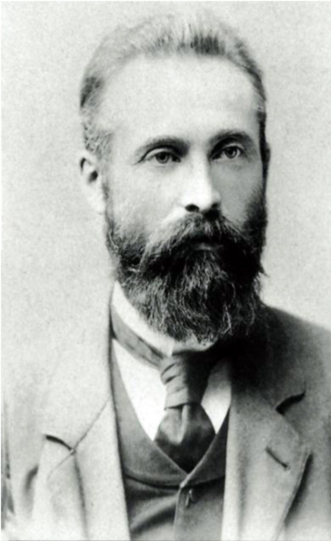
Bronisław Piłsudski (1866-1918)