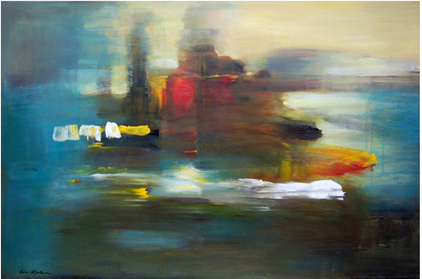
Eva Kolacz, Fantasy Island.