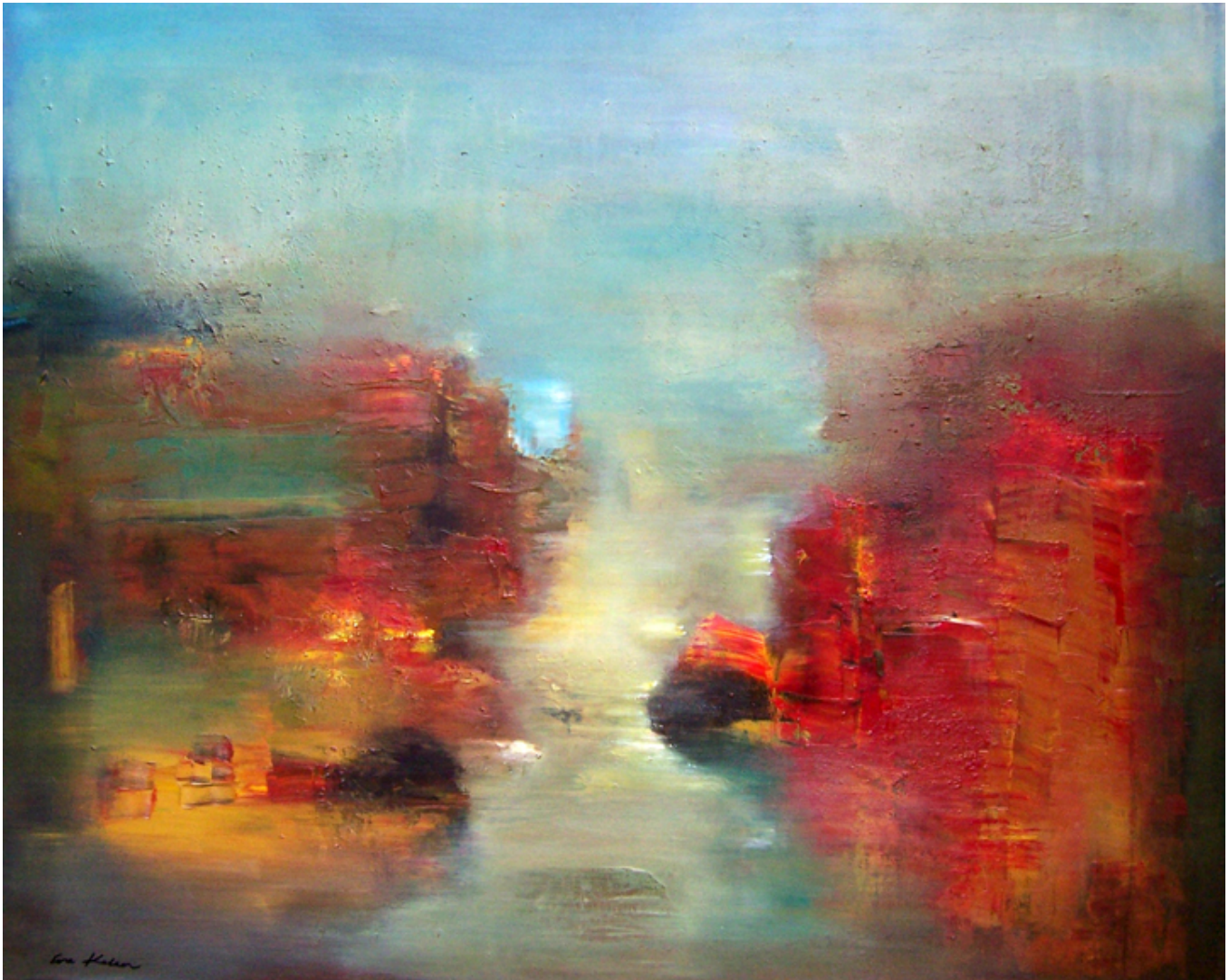
Eva Kolacz, Flow of Light.