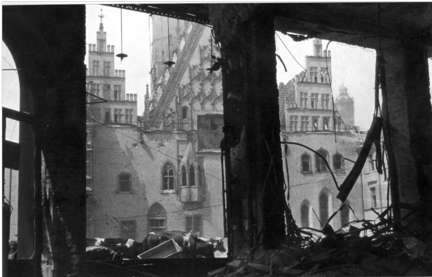
Ratusz we Wrocławiu, ruiny.

Tekst ukazał się w „Liście oceanicznym” – dodatku kulturalnym „Gazety” w Toronto w 2003 r.