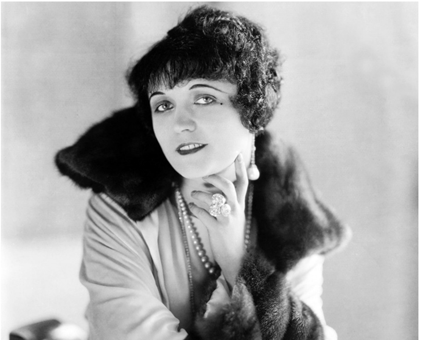
Pola Negri