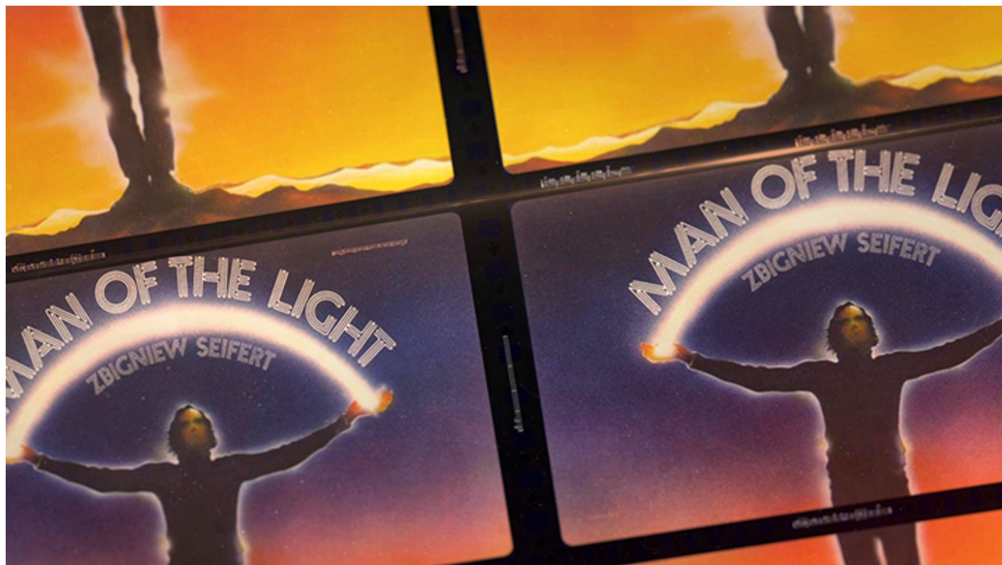
Okładka płyty „Man of the Light”

słuchamy go częściej niż innych. Pracował codziennie, pamiętam, jak codziennie grał, ćwiczył, grał solo - był naprawdę oddanym artystą.