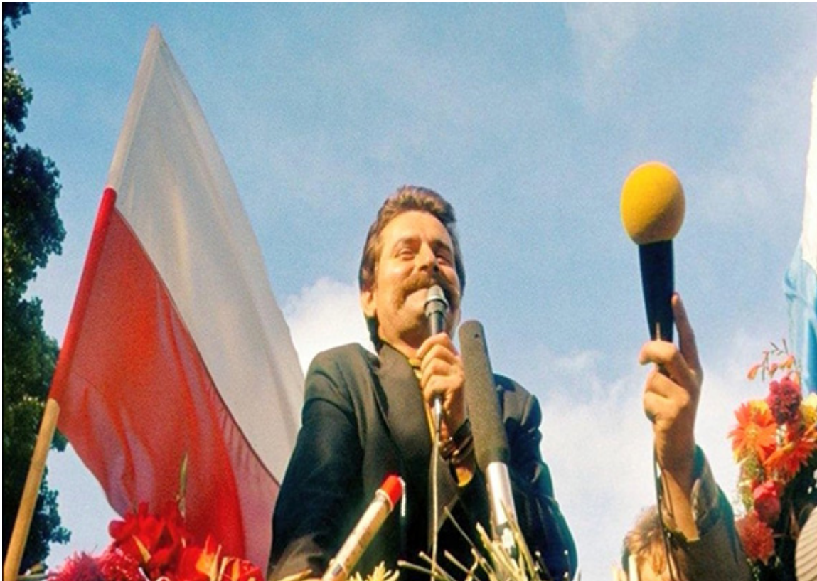
Kadr z filmu „My, Naród”