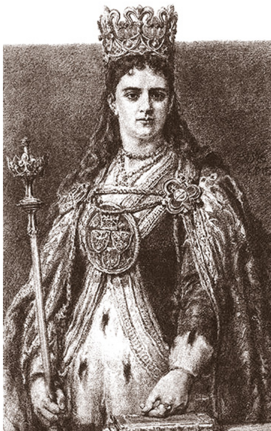
Jan Matejko, Królowa Jadwiga

Najprzedniejsze jest jednak przysłowie: „Na Jadwigi, z kapustą na wyścigi”. Dlaczego „na wyścigi”, z kim mamy się ścigać? Ano z tu i tam atakującym nas śniegiem, czy nawet z dojmującymi śnieżycami. Właśnie na dzień 15 października, czyli na imieniny Teresy i Jadwigi, niegdyś dość często pojawiały się opady śniegu. Pospiesznie z pola zbierano kapustę, która zwykle wędrowała do ziemnych piwnic, niekiedy do kopców. Część główek kapusty szatkowano, udeptywano w drewnianych bekach, kiszono; często z marchwią, kiedy indziej z jabłkami, wielokroć z burakami, aby przydać kapuście czerwonego koloru. Deptanie kapusty – a nie ubijanie jej drewnianymi tłuczkami – poprzedzał swoisty rytuał. Przez kilka godzin młodzieńcy wiejscy moczyli w cebrzyku nogi, szorowali je, następnie wkładali trzyćwierciowe lniane