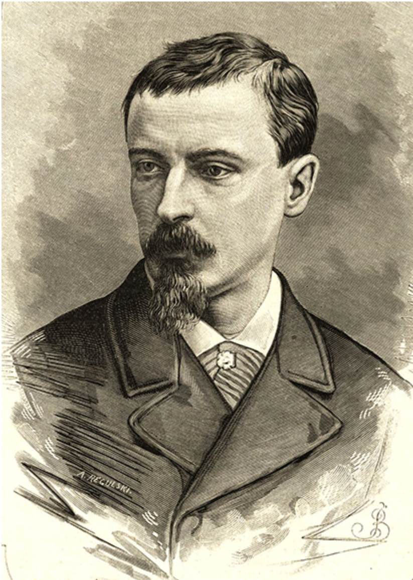
Henryk Sienkiewicz, drzeworyt Aleksandra Regulskiego, „Tygodnik Ilustrowany”, 1884, nr 92, Henryk Sienkiewicz [5]

Pomysłem wyjazdu na drugą półkulę, do Ameryki, zaraziła Sienkiewicza gwiazda scen warszawskich Helena Modrzejewska. I jak pisze we swoich wspomnieniach, Litwos był pierwszym do tego żeby przemawiać za emigracją . W Stanach Sienkiewicz znalazł się na przełomie lutego i marca 1876 roku. Aby spłacić swoje długi zaciągnięte w „Gazecie Polskiej”, która go