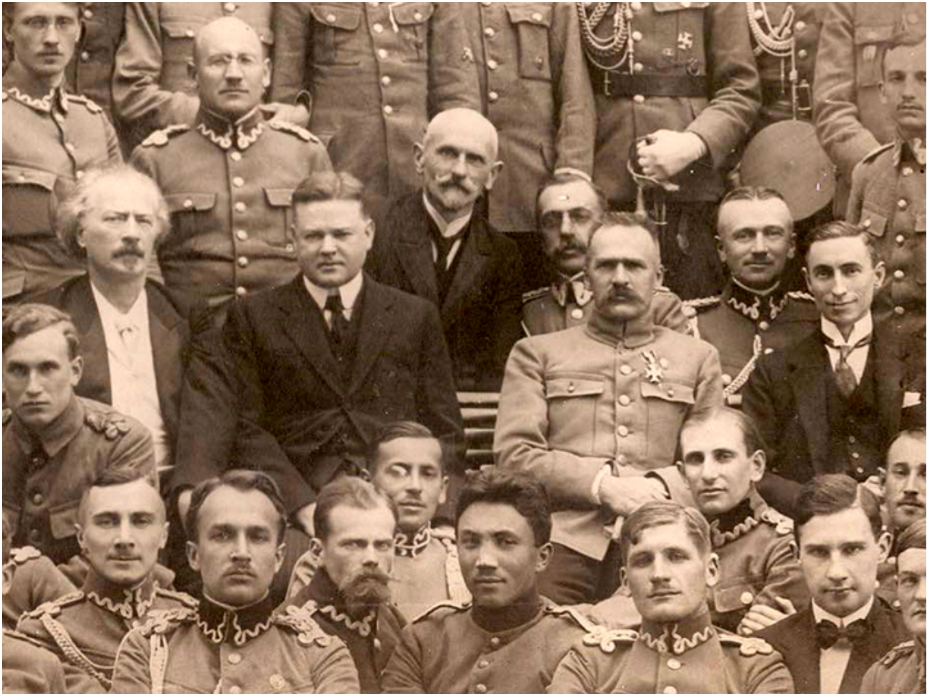
W środkowym rzędzie od lewej: Ignacy Paderewski, Herbert Hoover, Józef Piłsudski i ambasador USA Hugh Gibson, Warszawa, Belweder, 1919/HOOVER.ORG.

Dział polski w Bibliotece i Archiwum Instytutu Hoovera stanowi około 5 procent (40 000 tytułów bibliotecznych i ok. 400 zbiorów archiwalnych) całych zbiorów i stale się powiększa. W artykule na temat polskich zbiorów biblioteki i Archiwum Instytutu Hoovera rozróżnia pan w historii polskich zbiorów trzy etapy. Wszystko zaś zaczęło się od przyjaźni Herberta Hoovera z Ignacym Paderewskim. Co zawierają zbiory Ignacego i Heleny Paderewskich?