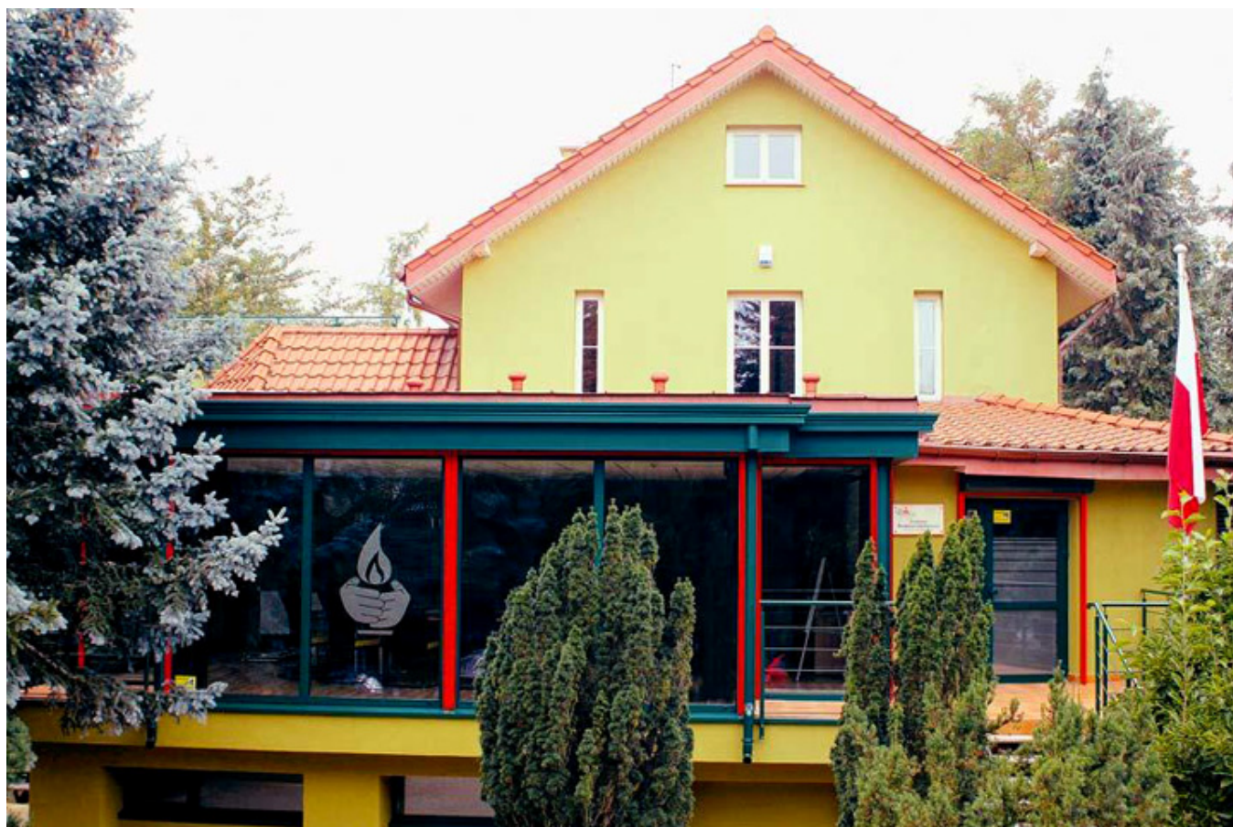
Budynek nowego Centrum Naukowo-Szkoleniowego.