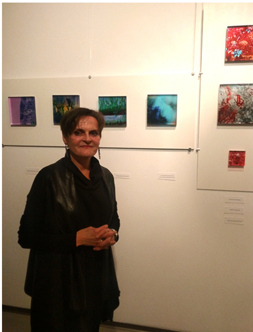
Artystka na tle swoich prac.

2019; Spirit of the Land w 2011 roku i Space w 2012 roku w MVS Gallery/Brockville, Kanada. W 2016 roku artystka była na rezydencji w L'Atelier sur Seine w Hericy we Francji.