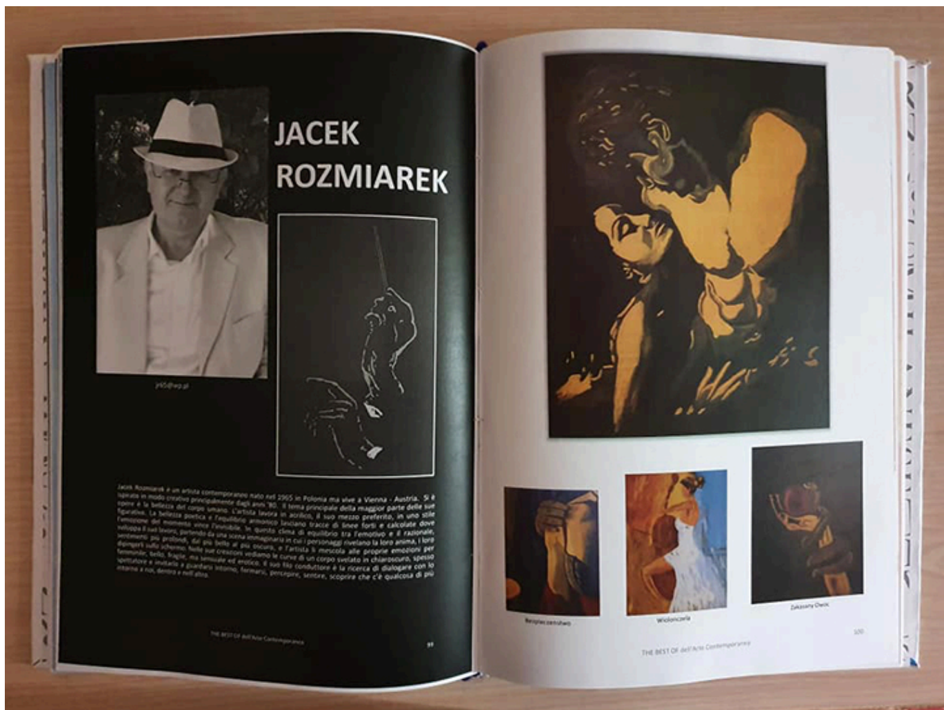
Publikacja na temat twórczości Jacka rozmiarka