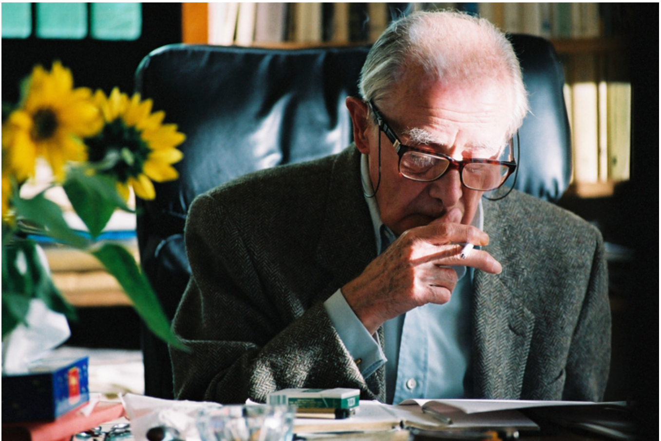
Jerzy Giedroyć, fot. Ignacy Szczepański.