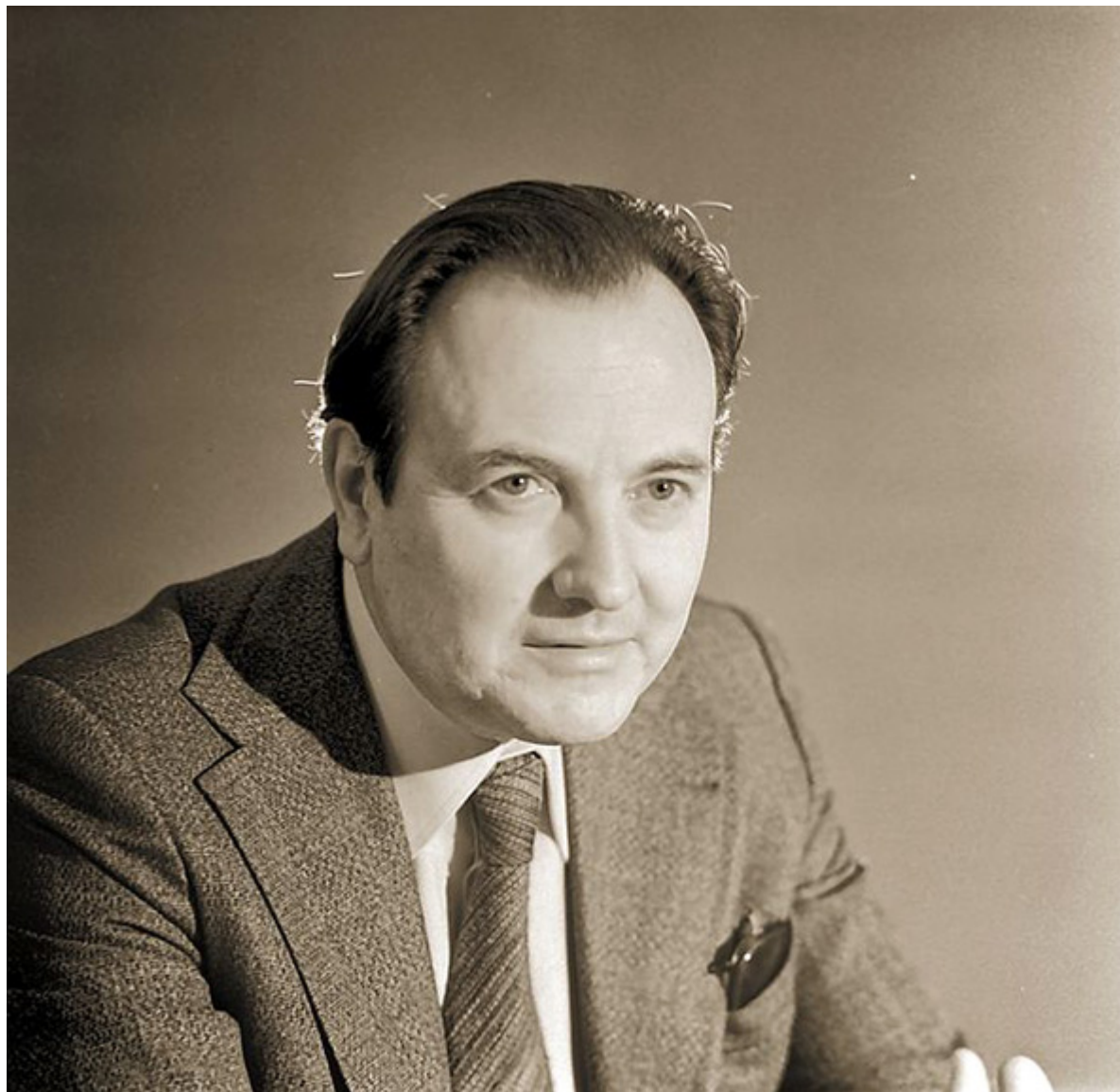
Ignacy Gogolewski, portret z okresu pracy w Lublinie