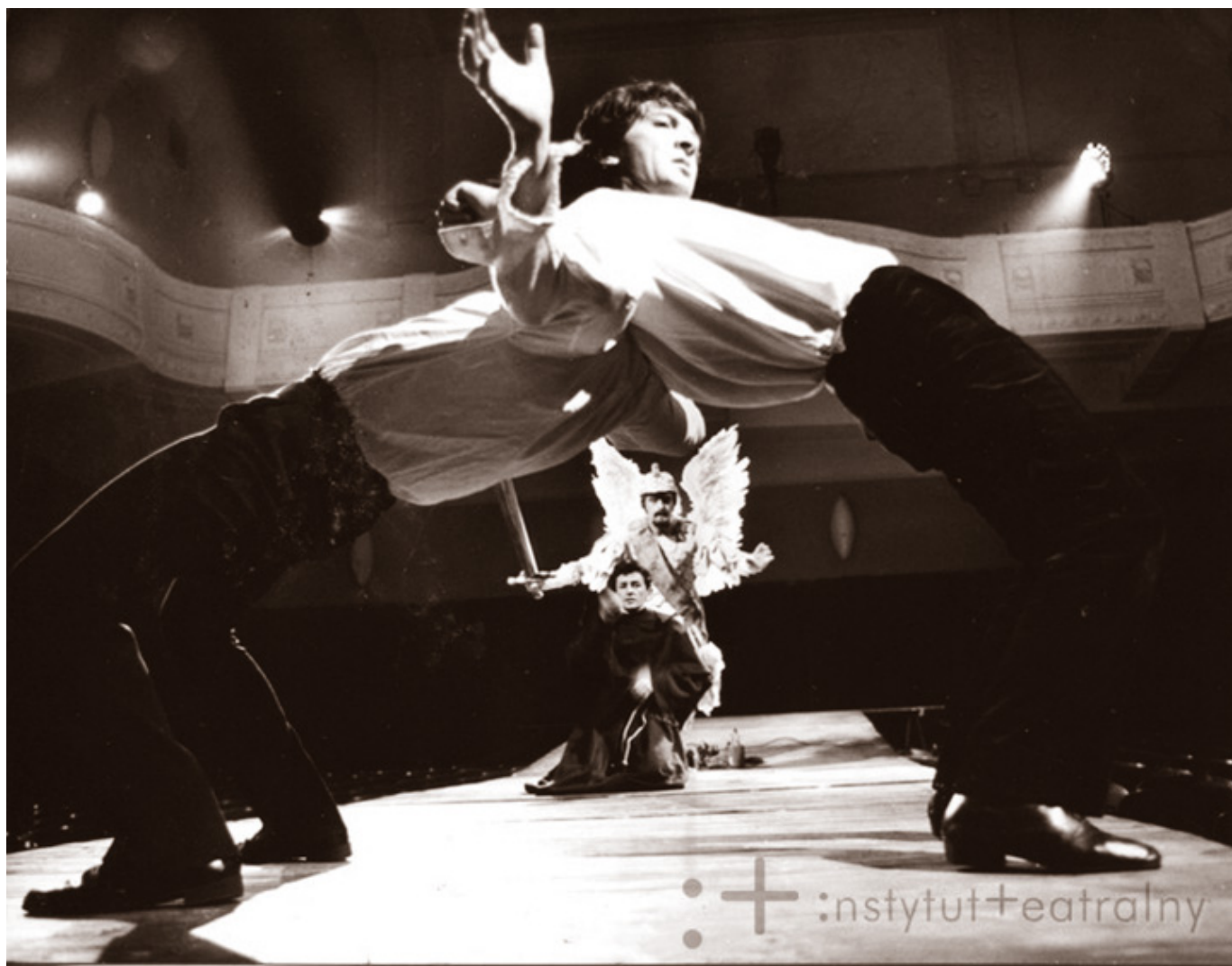
Jerzy Trela w realizacji: „Dziadów”, 18 lutego 1973 r., Stary Teatr im. Heleny Modrzejewskiej, Kraków