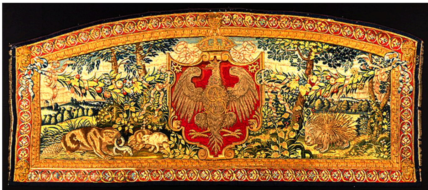
Michiel Coxie, Arras naddrzwiowy z herbem Polski na tle krajobrazu z bobrem i jeżozwierzem, ok. 1560 r.