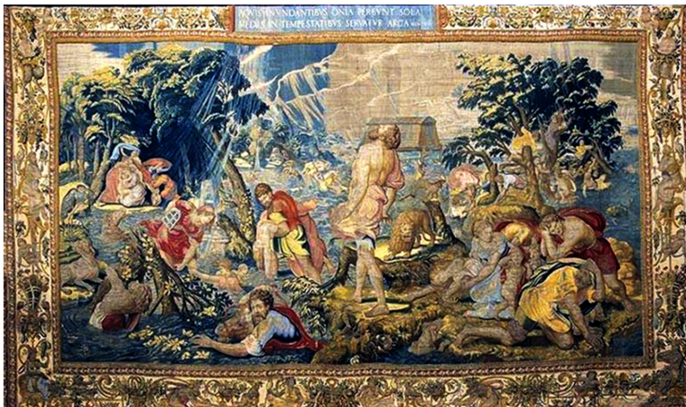
Potop. Seria Dzieje Noego, pracownia Jana de Kempeneera, projekt Michiel Coxie, ok. 1550 r., (w:) J. Szablowski, Arrasy flamandzkie w Zamku Królewskim na Wawelu, wyd. Arkady, Warszawa 1975

████████████████████ przed pościgiem niemieckim była ambasada polska w Bukareszcie. Z Rumunii skrzynie przetransportowano do Francji, gdzie w miejscowości Aubusson, francuscy konserwatorzy osuszyli arrasy zamoczone w trakcie podróży. W noc przed kapitulacją Francji, z portu w Bordeaux, w ostatniej chwili Skarby Wawelskie odplłynęły do Londynu. Zgodnie z decyzją rządu polskiego na uchodźstwie, cenny ładunek wysłany został do Kanady i 12 lipca 1940 roku