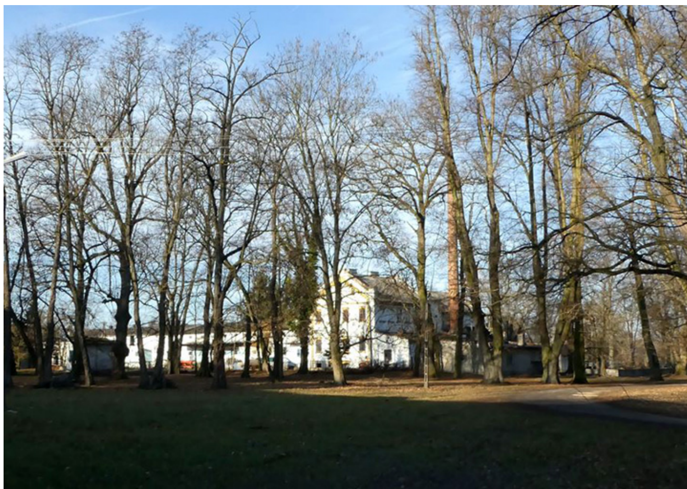
Bełdów