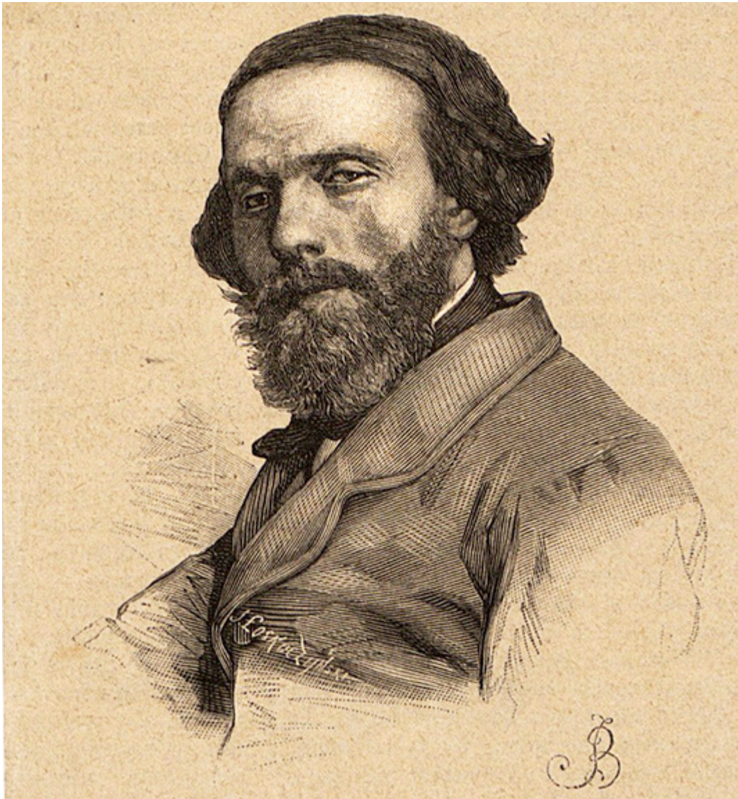
Józef Łoskoszyński, „Cyprian Kamil Norwid”, rysunek, fot. wikimedia commons

W roku 2021 upływa 200 lat od urodzenia Cypriana Norwida. Jubileusz 200-lecia urodzin tego wielkiego twórcy to ważna sprawa narodowa - sprawa literatury polskiej i polskiego teatru, a ogólnie sprawa narodowej kultury i narodowej świadomości. „Syn - minie pismo, lecz ty spomnisz wnuku” - napisał Norwid.[1] Wczoraj pomijany - dzisiaj wraca.