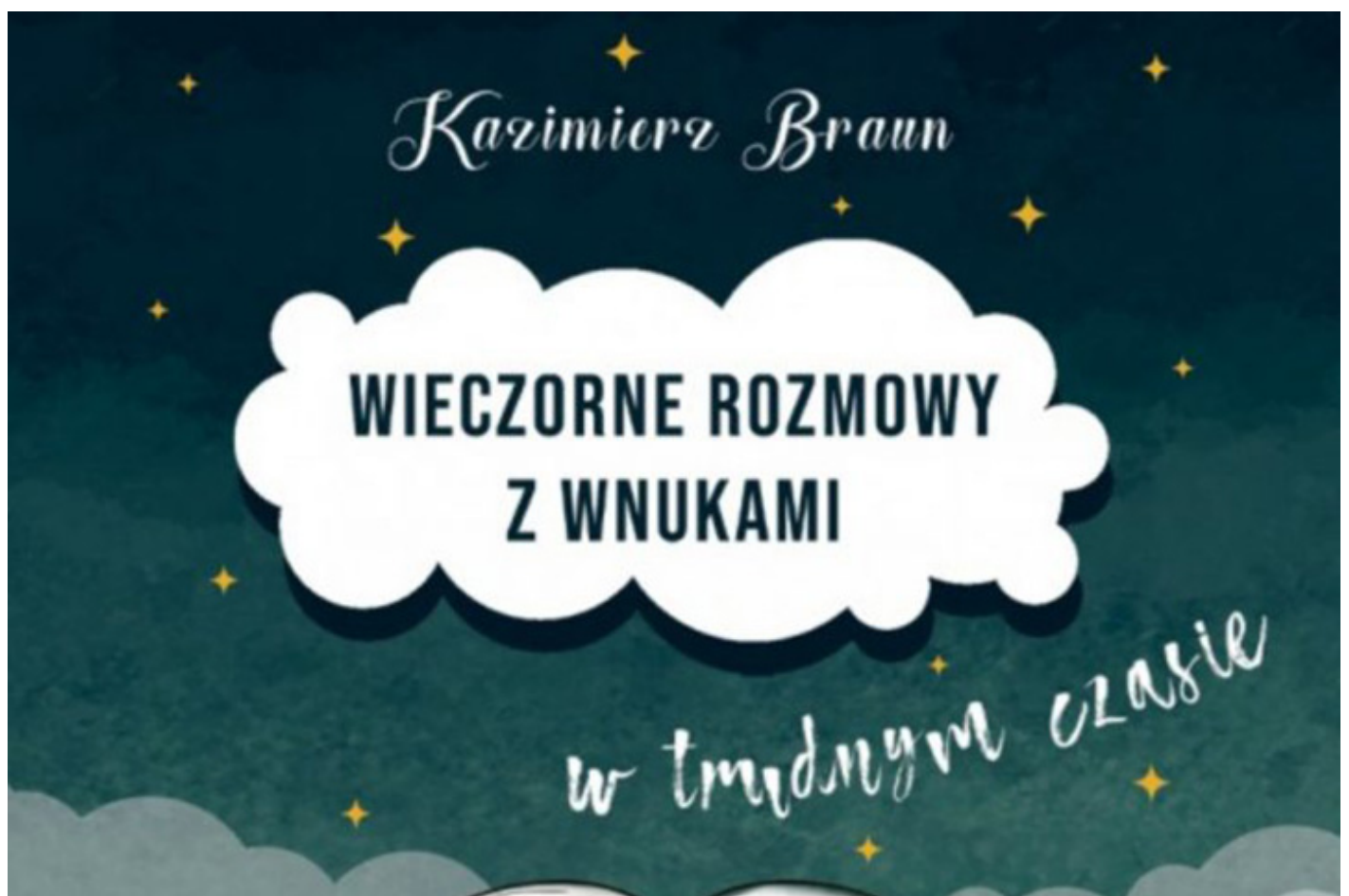
Okładka książki Kazimierza Brauna