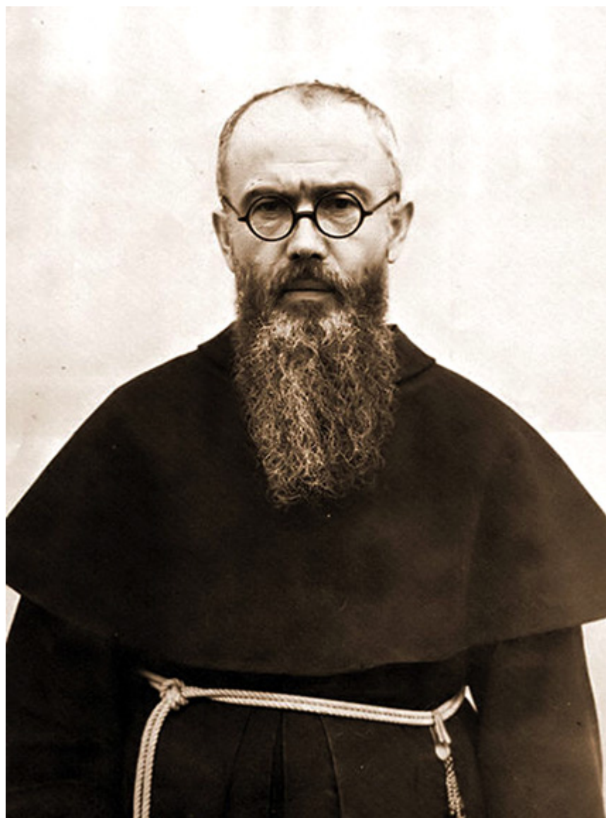
Ojciec Maksymilian Kolbe, 1936 r.

Tygodniu - w kościołach na terenie Polski, Kanadzie, Stanach Zjednoczonych. Pragnąłem nadal uczyć się od świętego, być jakoś blisko niego. Z tego pragnienia powstały otwierające ten tom - „Pieśni świętego Maksymiliana”. I tak jak ksiądz mówi - stał się on moim „towarzyszem podróży” w ostatnich latach. Jego „Regulamin życia” jest zarówno drogowskazem, jak też przypomnieniem, jak wiele mi brakuje do sprostanania jego wymaganiom.