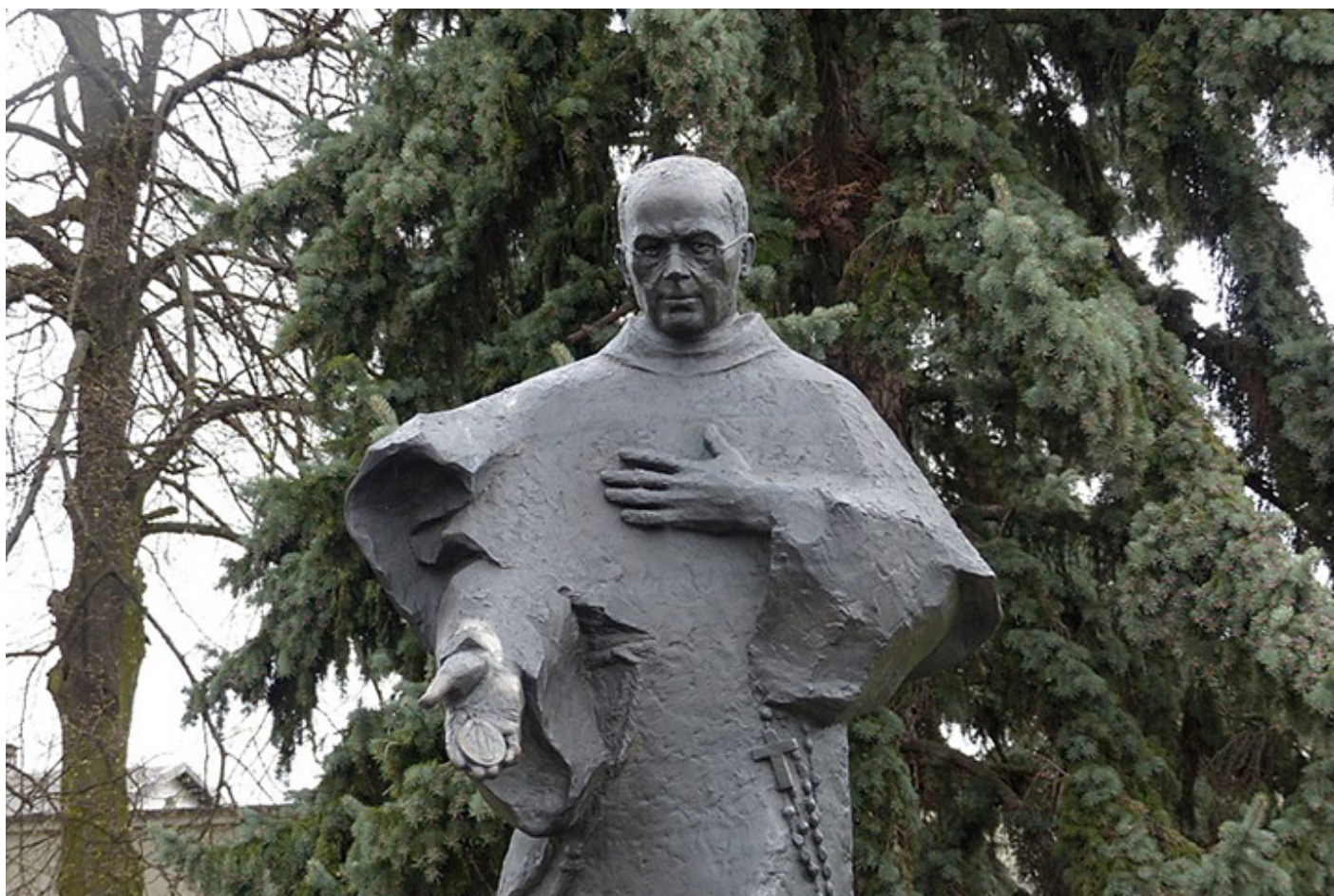
Pomnik św. Maksymiliana Kolbe w Niepokalanowie, fot. wikimedia commons

Trzymaj mnie, Matko, proszę, w swych ramionach.