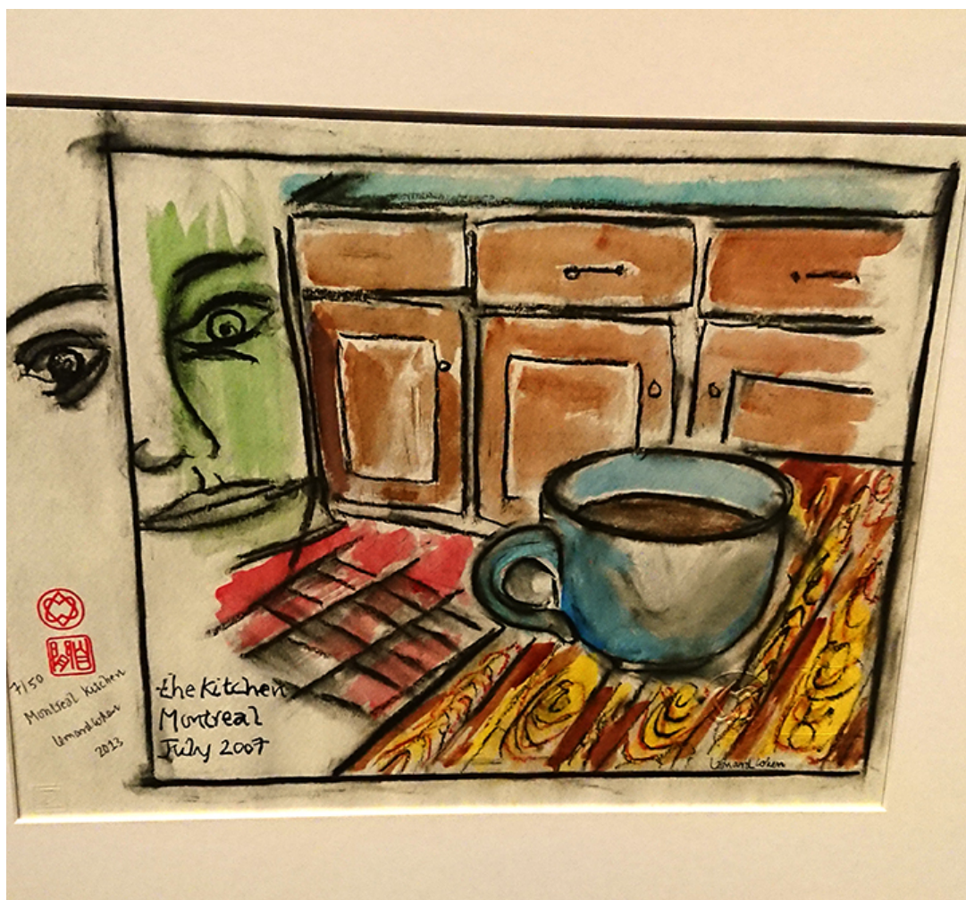
Leonard Cohen, The Kitchen, Montreal 2007, wystawa w Toronto