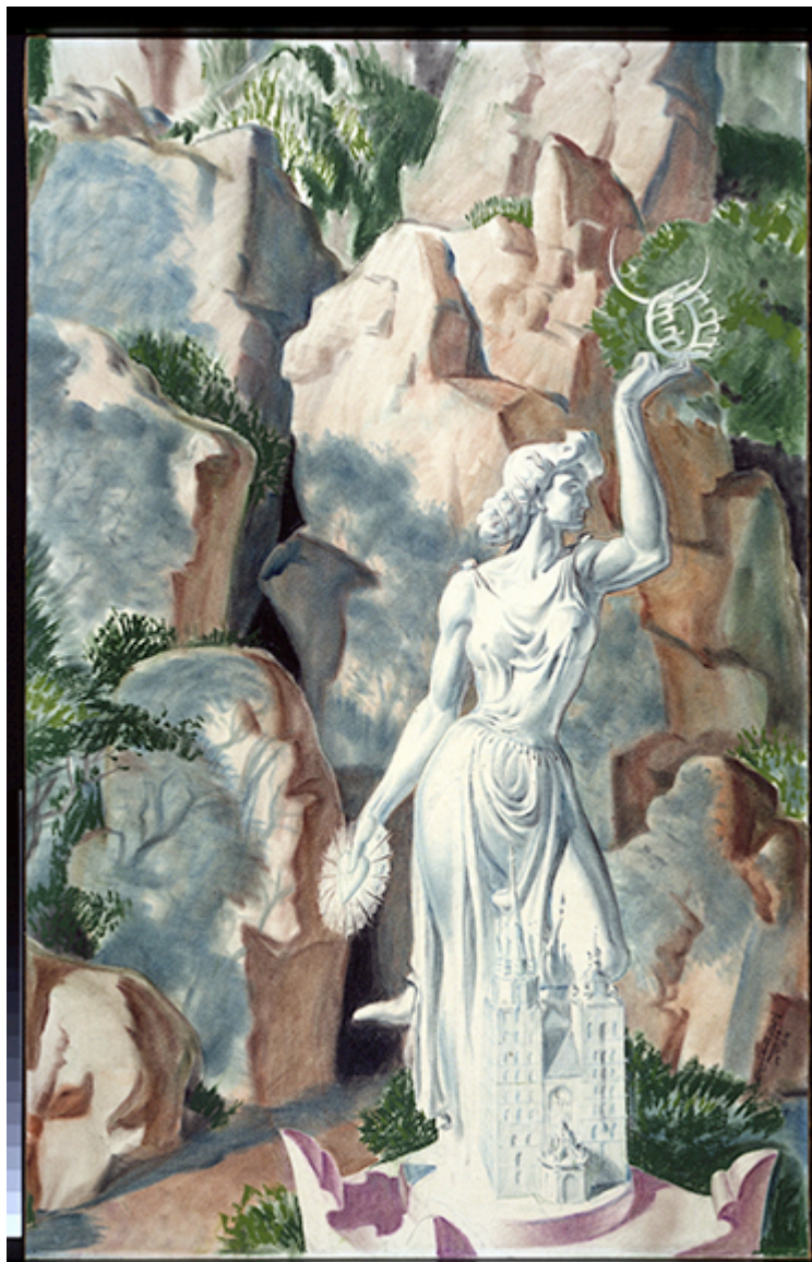
Stanisław Szukalski, project pomnika Heleny Modrzejewskiej

książek oraz reżyserem filmów i sztuk teatralnych.