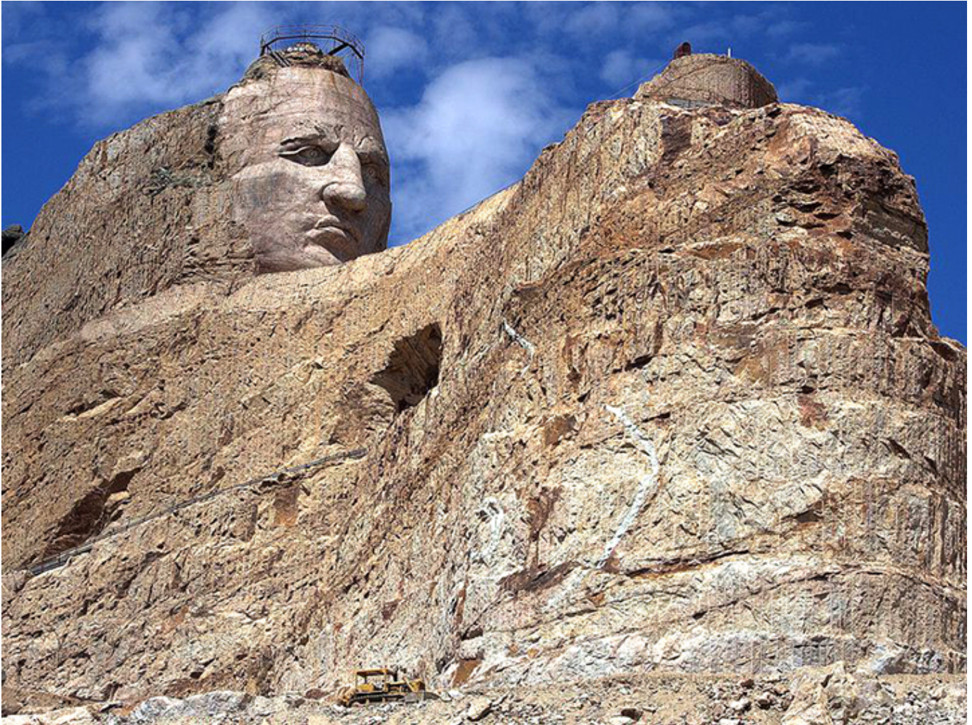
Crazy Horse, Południowa Dakota