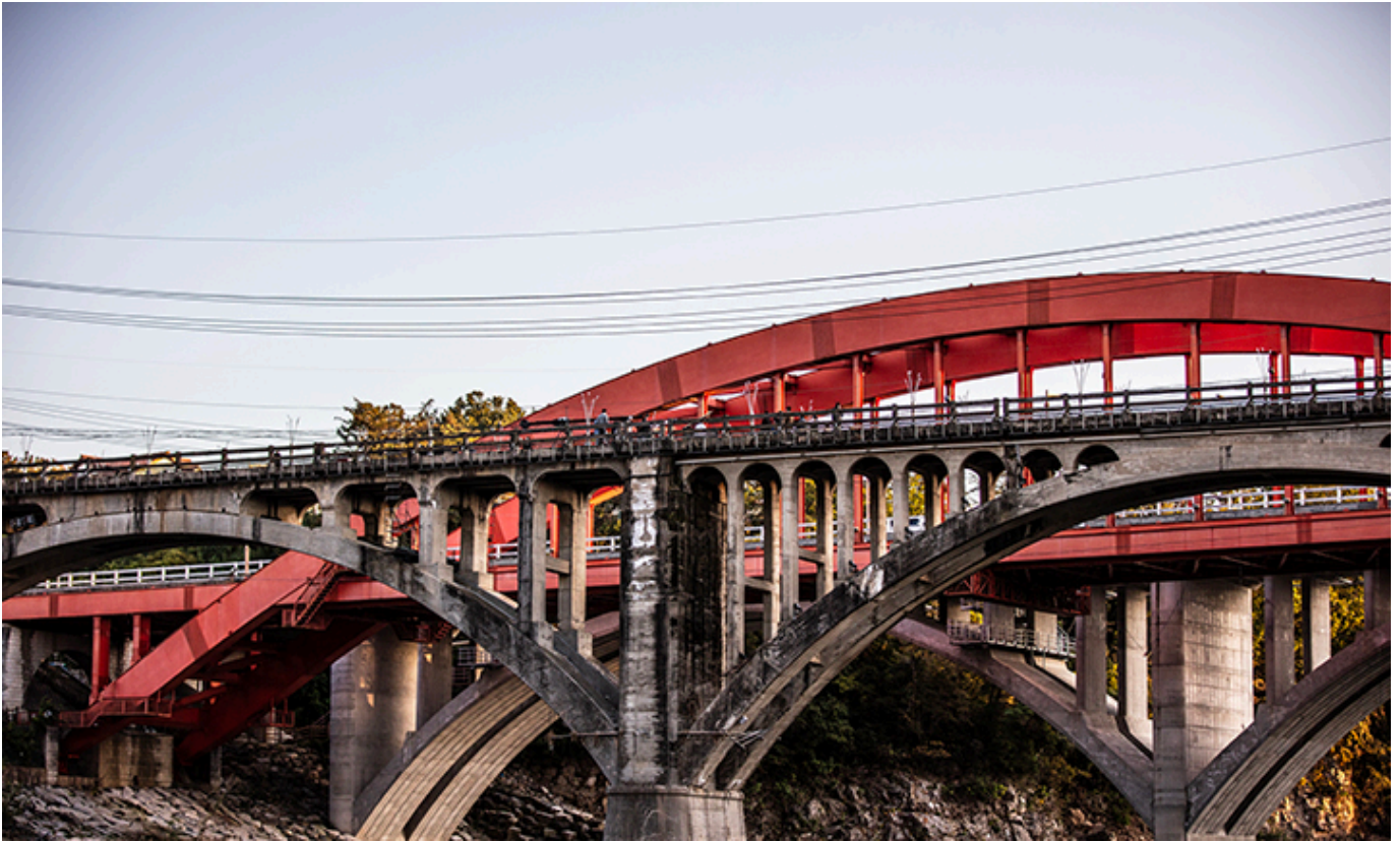
Most dzielący dwie Koree, kadr z filmu „Chopin. Nie boję się ciemności”