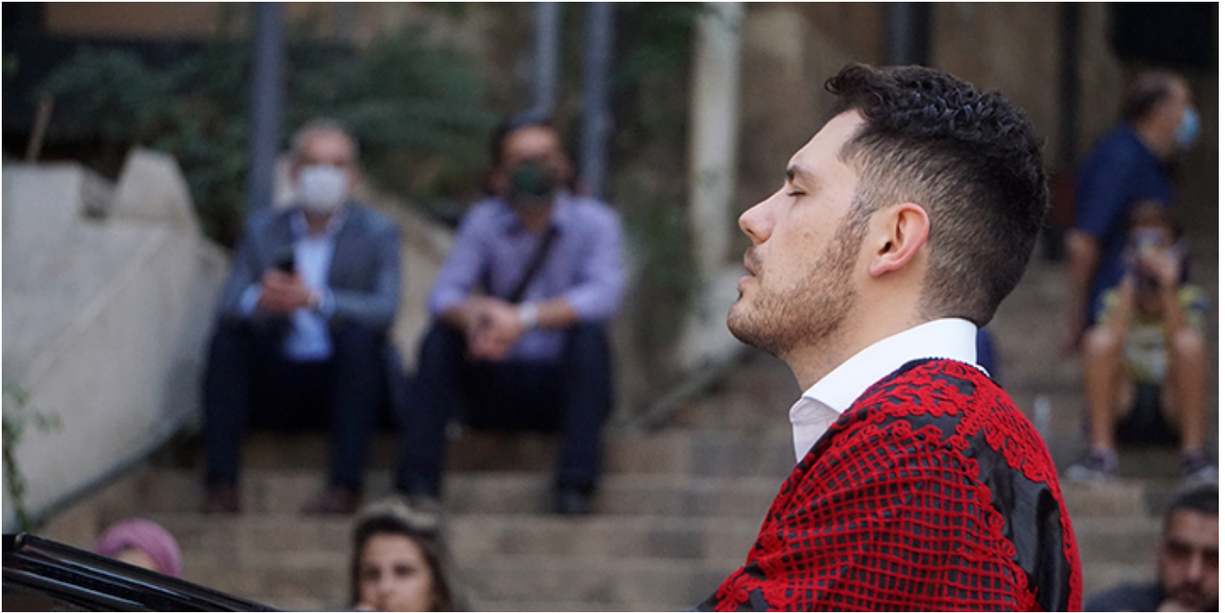
████████████████████ podczas koncertu w Bejrucie, kadr z filmu „Chopin. Nie boję się ciemności”