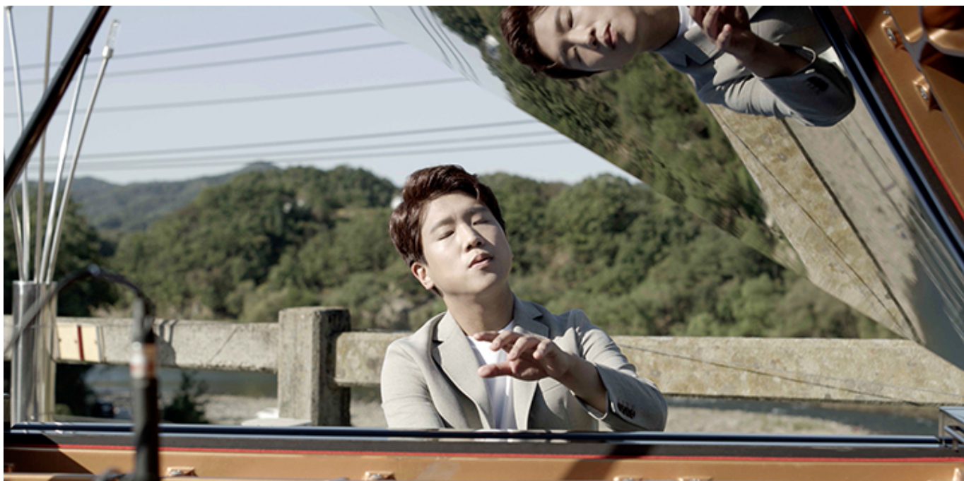
[REDACTED] podczas koncertu w Korei, kadr z filmu „Chopin. Nie boję się ciemności”