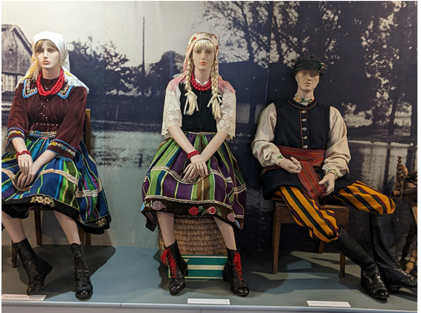
Muzeum im. Władysława Reymonta w Lipcach Reymontowskich, fot. J. Sokołowska-Gwizdka