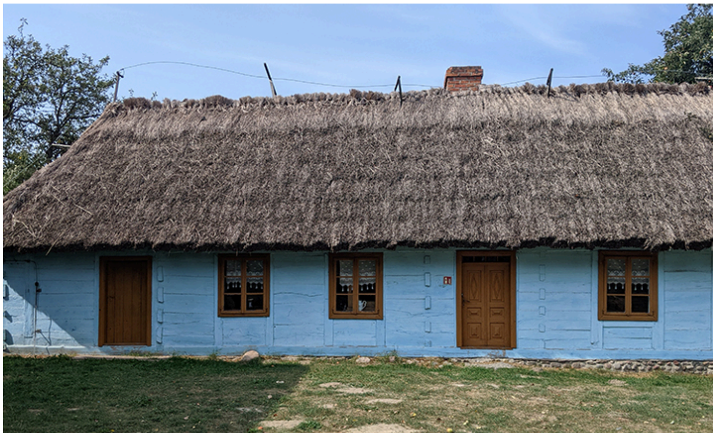
Lipce Reymontowskie, zabytkowa chłopska chata na terenie Muzeum im. Władysława Reymonta, fot. Joanna Sokołowska-Gwizdka