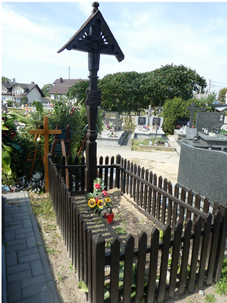
Symboliczny grób Macieja Boryny na cmentarzu w Lipcach Reymontowskich