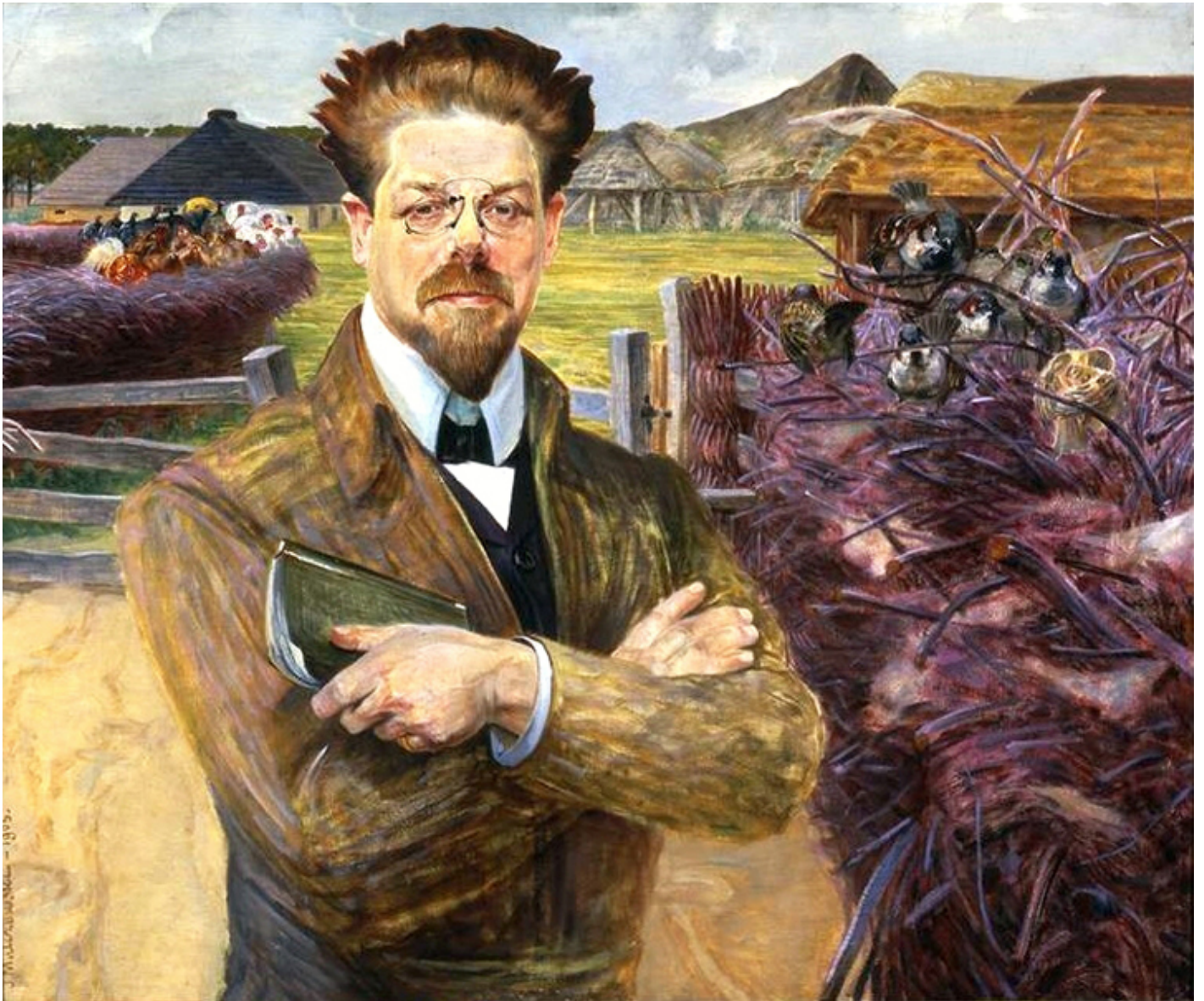
Jacek Malczewski, Portret Władysława Reymonta (1905)