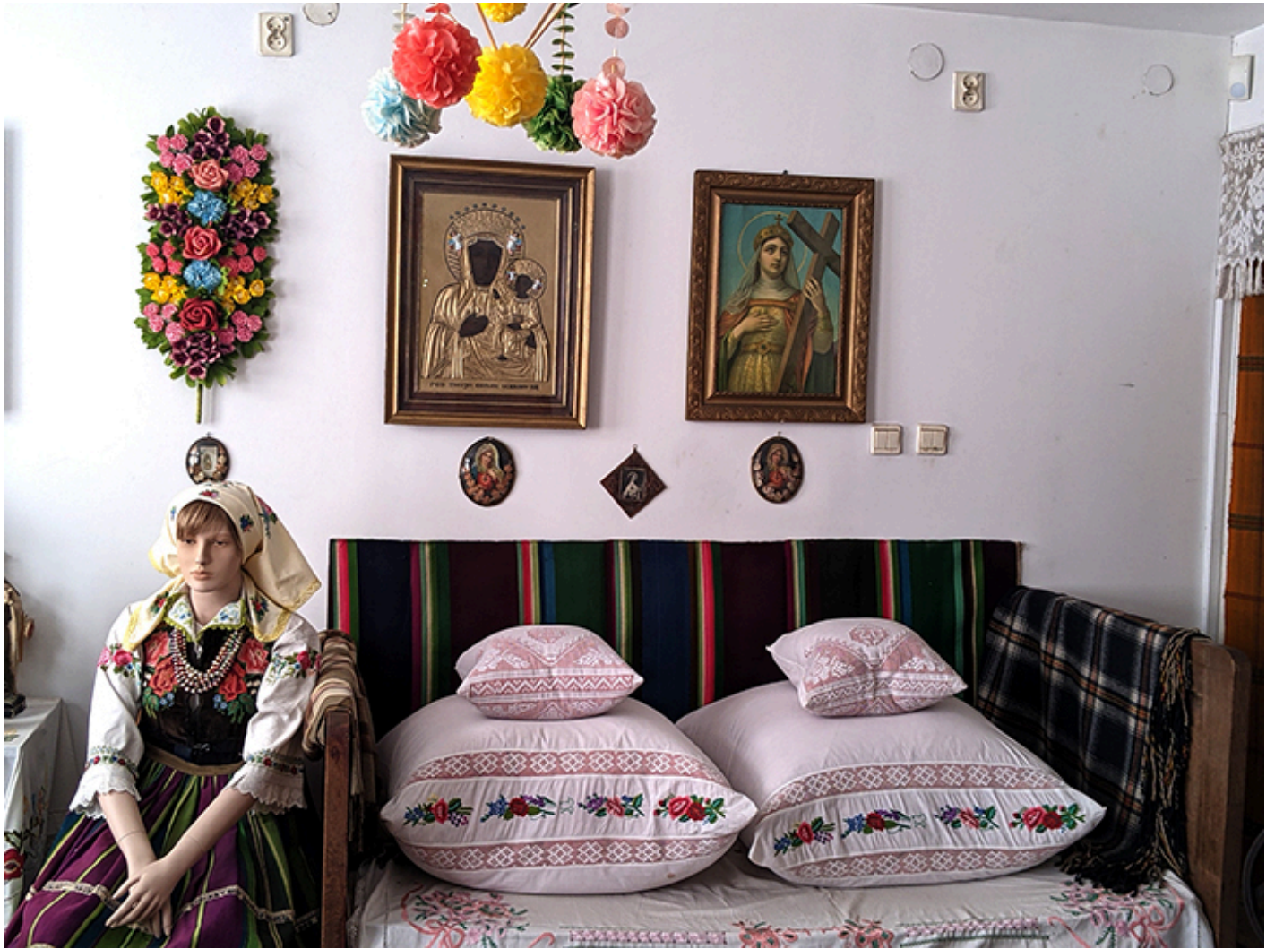
Muzeum im. Władysława Reymonta w Lipcach Reymontowskich, fot. J. Sokołowska-Gwizdka