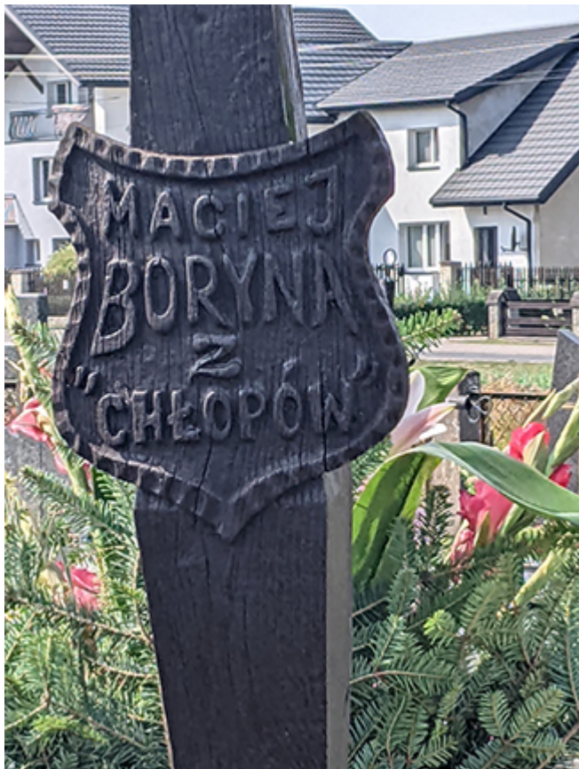
Symboliczny grób Macieja Boryny na cmentarzu w Lipcach Reymontowskich