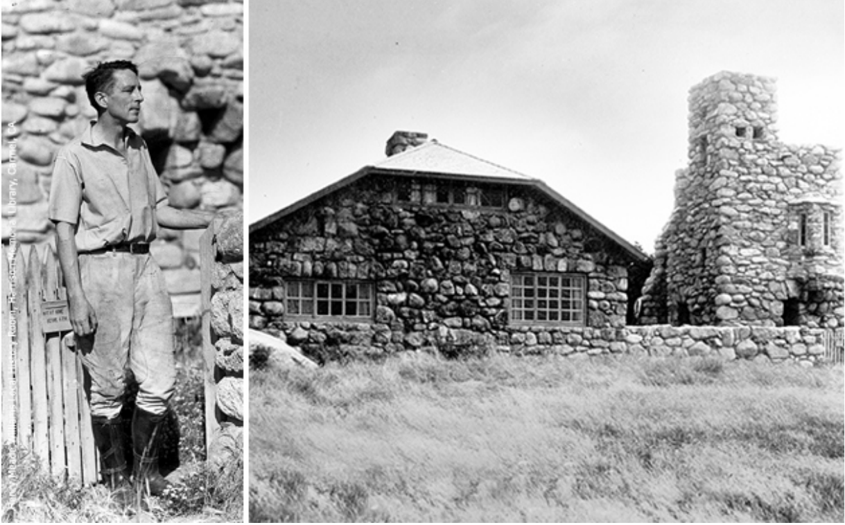
Robinson Jeffers i jego dom w Carmel na wybrzeżu Kalifornii.

Echa tych sanskryckich wierszy można znaleźć u Jeffersa, kiedy mówi o hałasie, który czyni słońce ”, a także o „ wojnie, łamiącej wszelkie obietnice, zabijającej tych, których uwalnia ”. I o sztormie, który „nadchodzi, kiedy lwy polują wśród nocy pociętej piorunami .