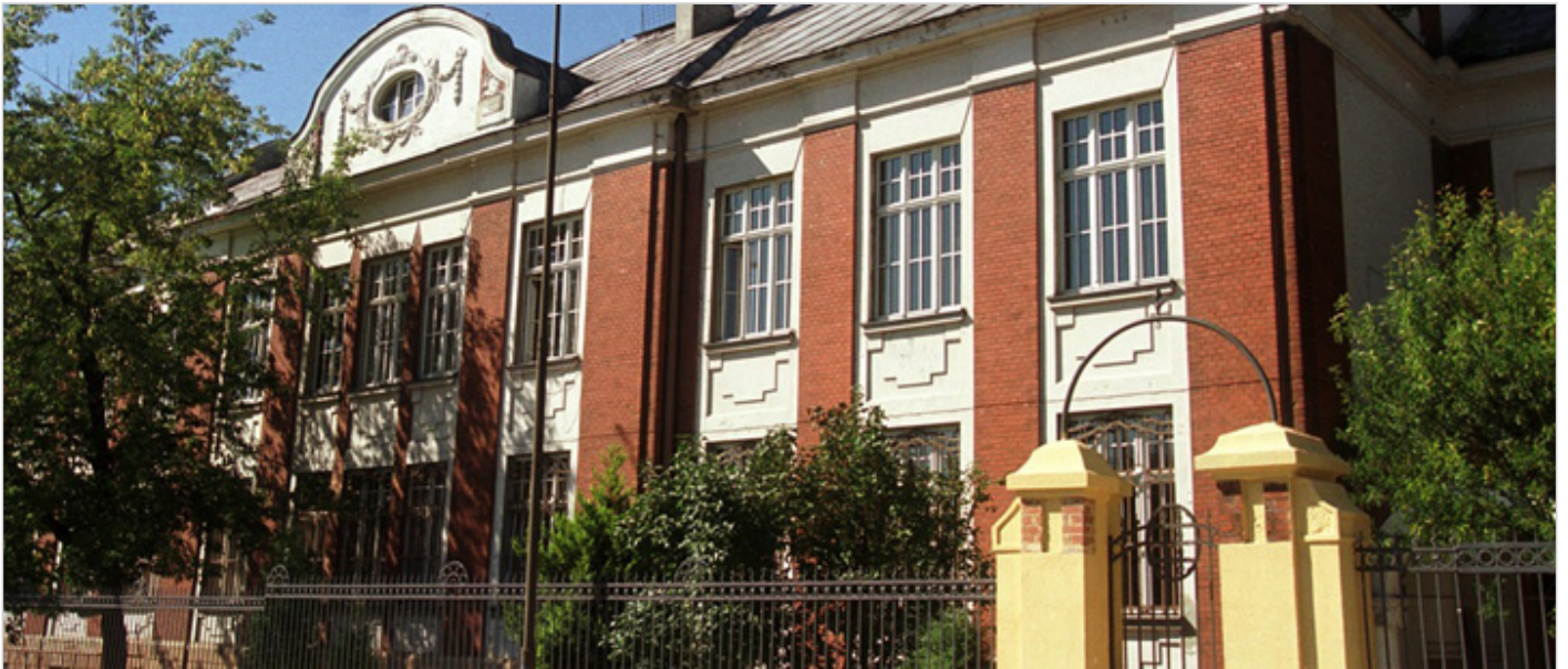
Łódzka Szkoła Filmowa

stworzonych przez moich rówieśników z całego świata było fascynujące.