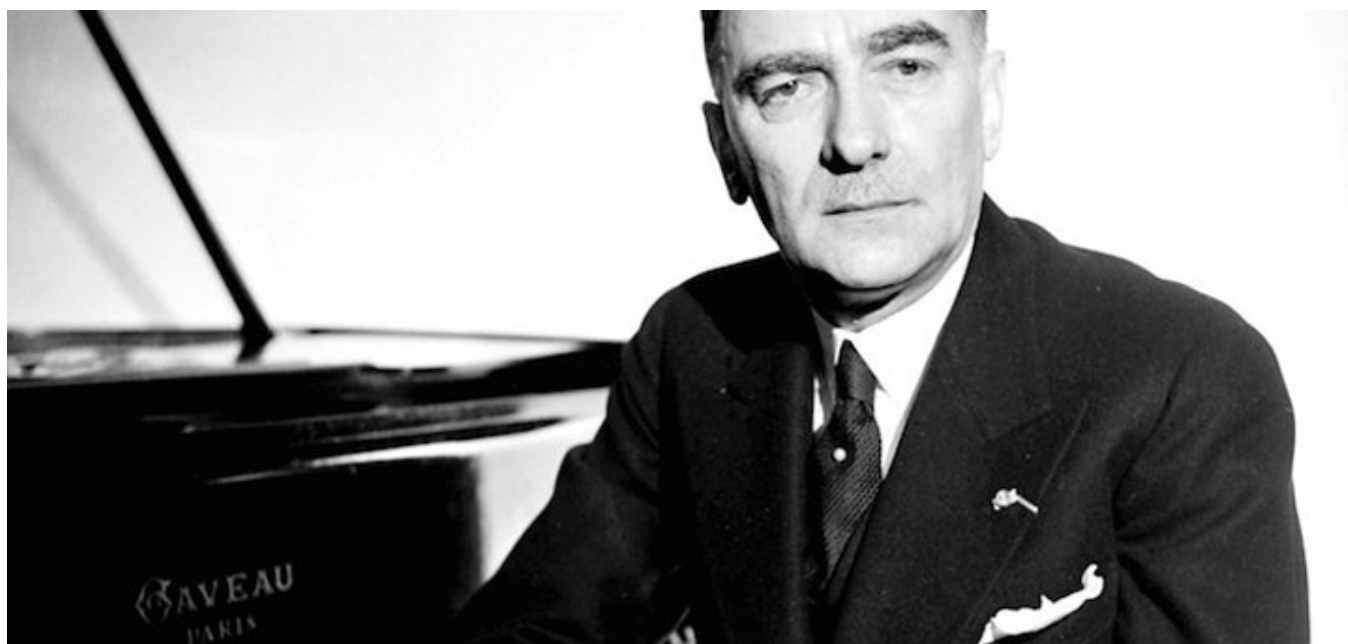
Karol Szymanowski

Ciekawe, że romantyczna idiosynkrazja do żony przeżyła romantyzm. Pierwszym nowoczesnym polskim poetą, który żonę uczynił swoją muzą był Gałczyński. Już za to jedno postawiłbym mu pomnik. Byłby to drugi pomnik postawiony na ziemi polskiej z tego powodu. Pierwszy miałby Kochanowski. Jakże on pięknie pisał o swej żonie Dorocie.