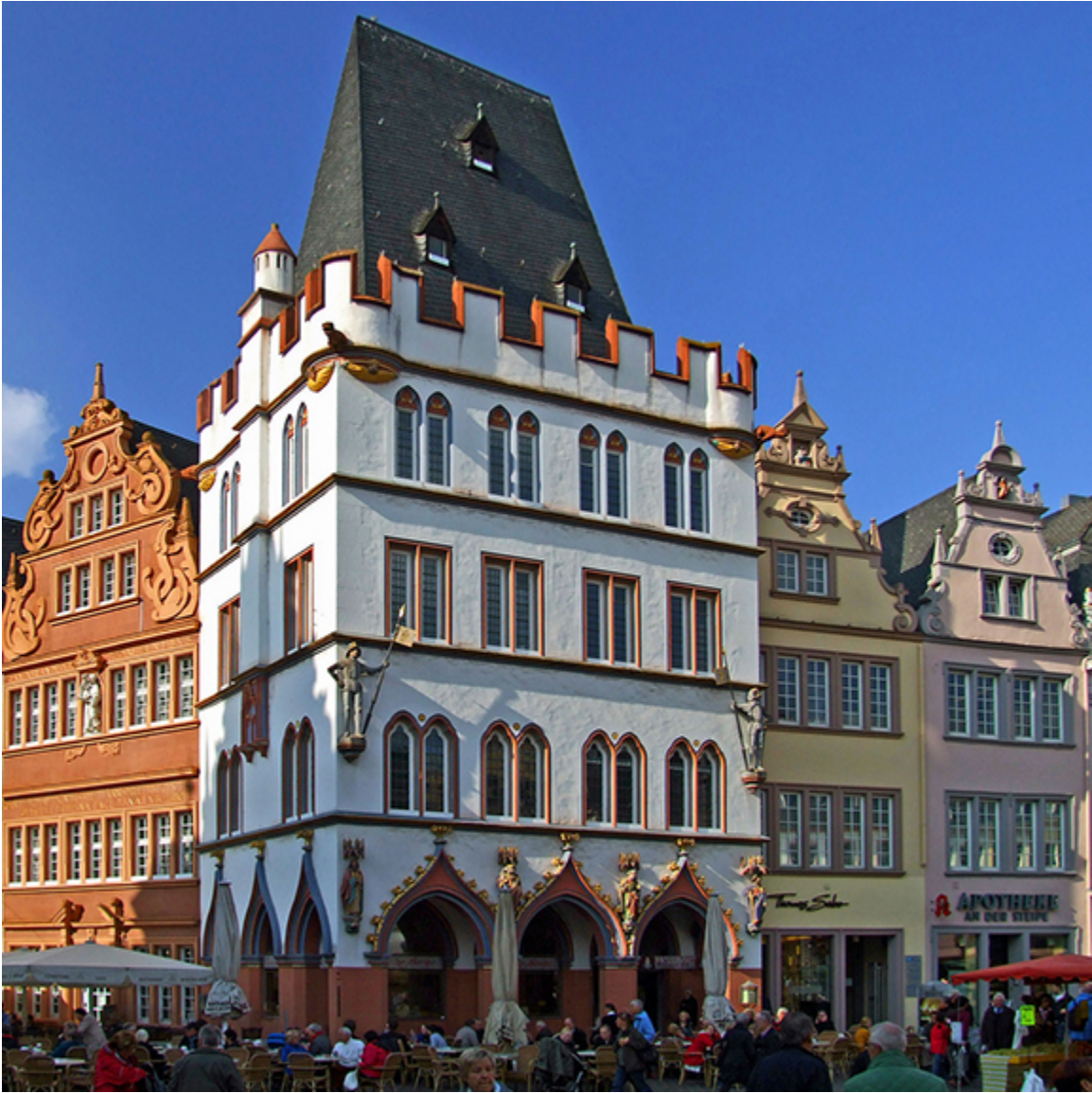
Trewir. Rynek Główny. Kamienica pod Arkadami i Czerwona Kamienica.

Podczas drugiego wyjazdu na wykład do Gießen , czy też wracając stamtąd, już nie pamiętam, a było to w dniach 10-12 lipca 1994 r., zatrzymałem się we Frankfurcie nad Menem . Upał był wówczas nieznośny. Obejrzałem zabytkowy ratusz z XV w. i szachulcowe kamieniczki na rynku, gotycki kościół Świętego Mikołaja z końca XIII w., gotycką Farę Świętego Bartłomieja z XIV w. i Dom Goethego, ale tylko z zewnątrz.