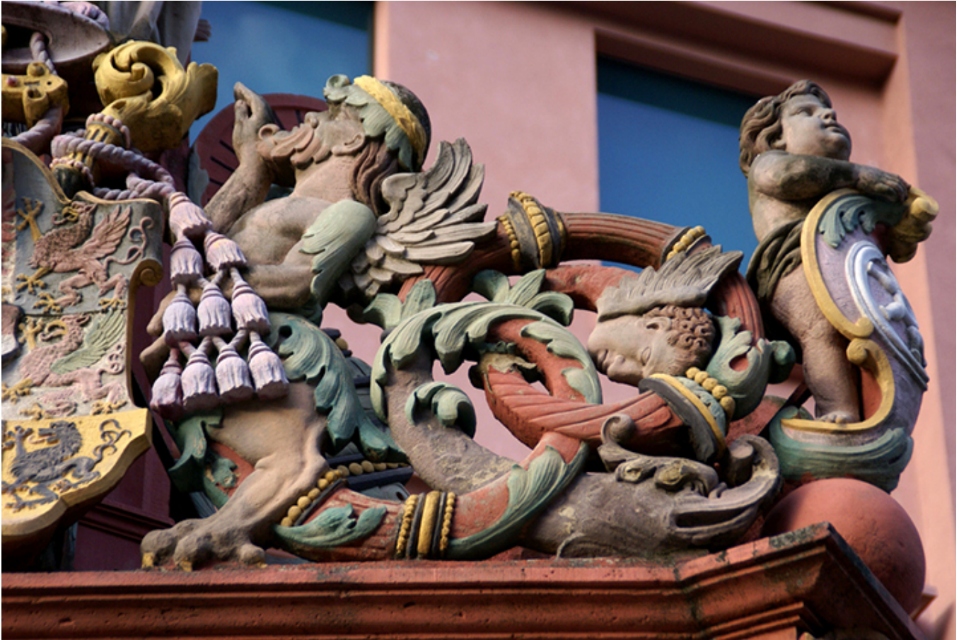
Moguncja. Renesansowa fontanna, zwana Piękną, na Placu Targowym.