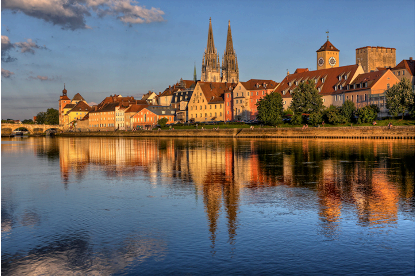
Katedra i Wieża Zegarowa Starego Ratusza w Ratyzbonie