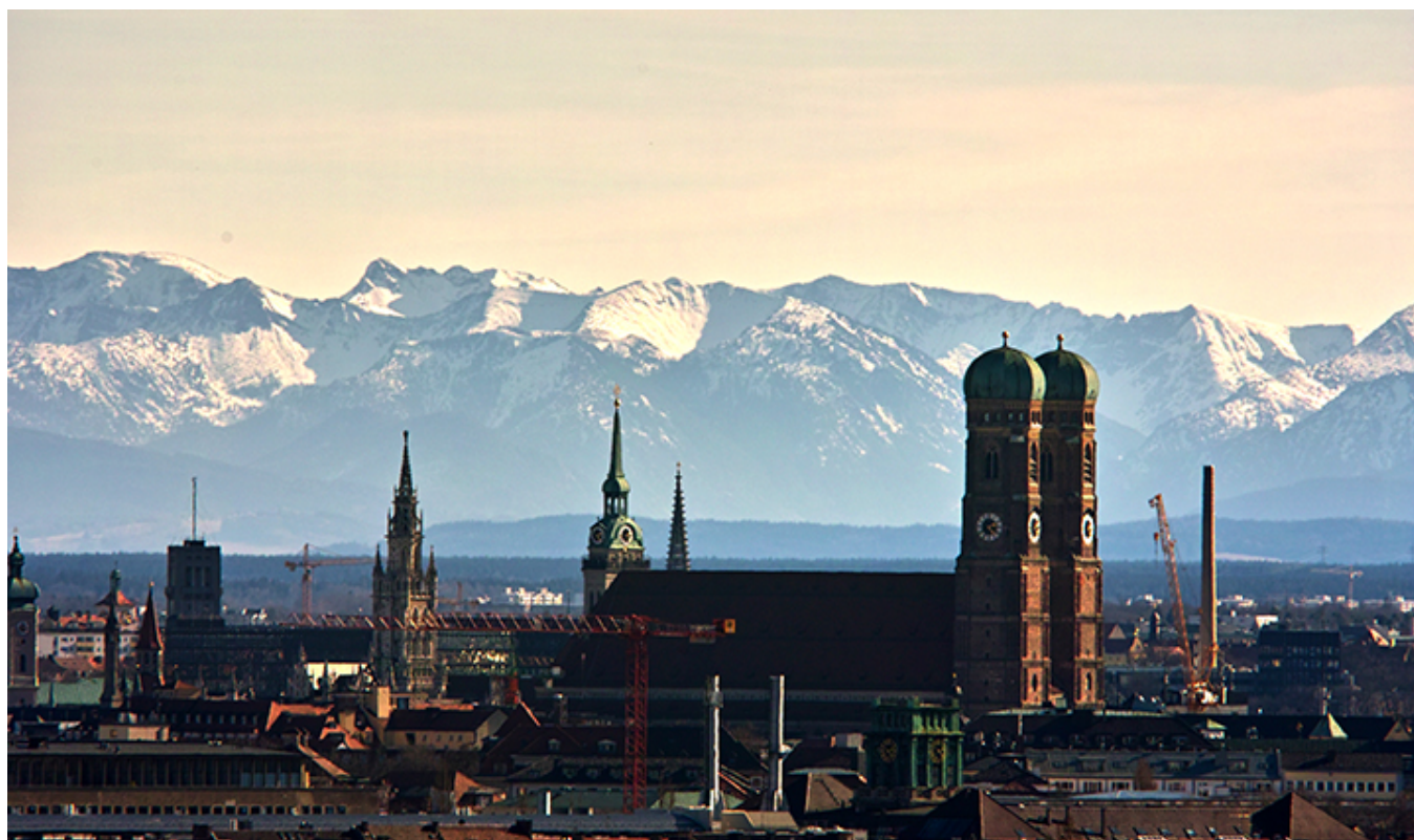
Kościół Mariacki w Monachium na tle łańcucha ośnieżonych Alp.