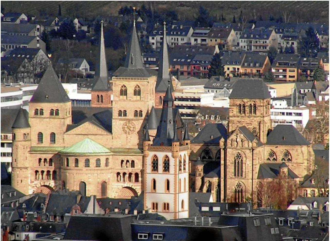
Trewir. Katedra Św. Gandolfa i Kościół Mariacki.

Zdecydowanie najpiękniejszym miastem niemieckim wydał mi się Trewir , po niemiecku Trier . Po prostu чудо! Leży nad Mozela, osłonięte wzgórzami, gdzie winnice. Przepiękny Rynek Główny z kościołem Świętego Gandolfa XIV/XV w., z krzyżem i fontanną pośrodku. Ogromna romańska katedra Świętego Piotra z X w., tuż obok gotycki kościół Najświętszej Marii Panny ( Liebfrauenkirche ) z XIII w., z pięknym portalem zachodnim.