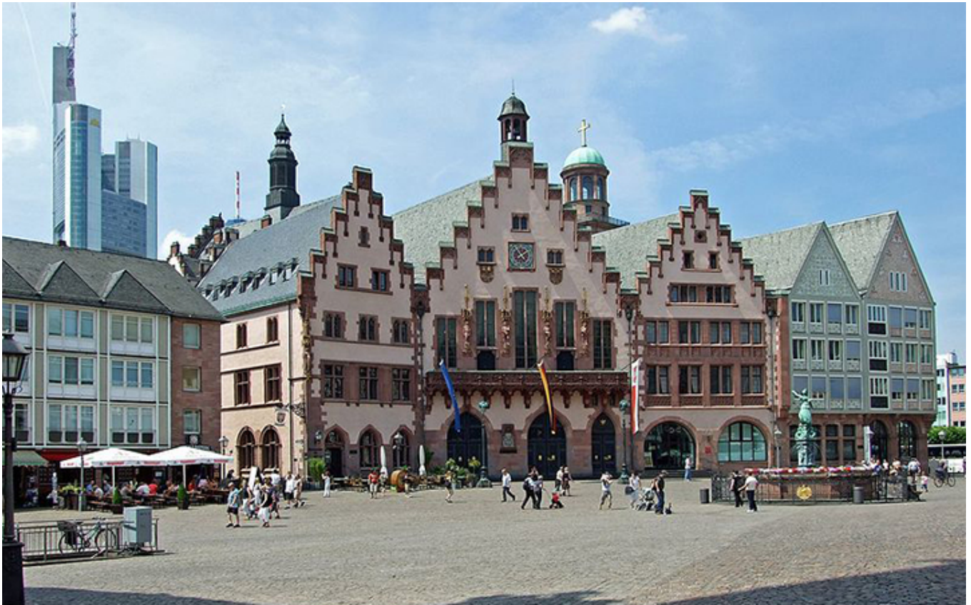
Frankfurt nad Menem. Ratusz,