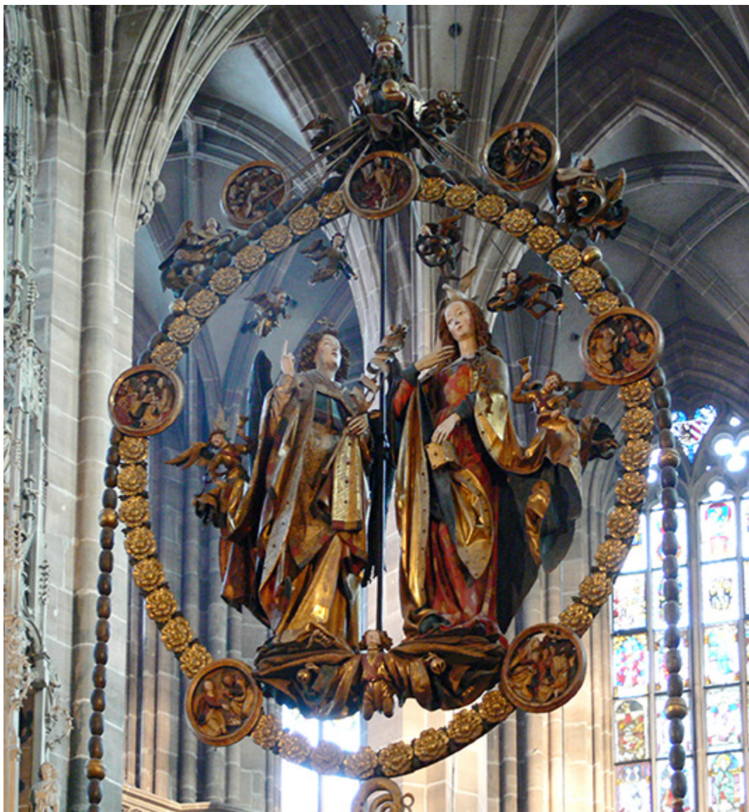
Zwiastowanie Wita Stwosza w kościele św. Wawrzyńca w Norymberdze.