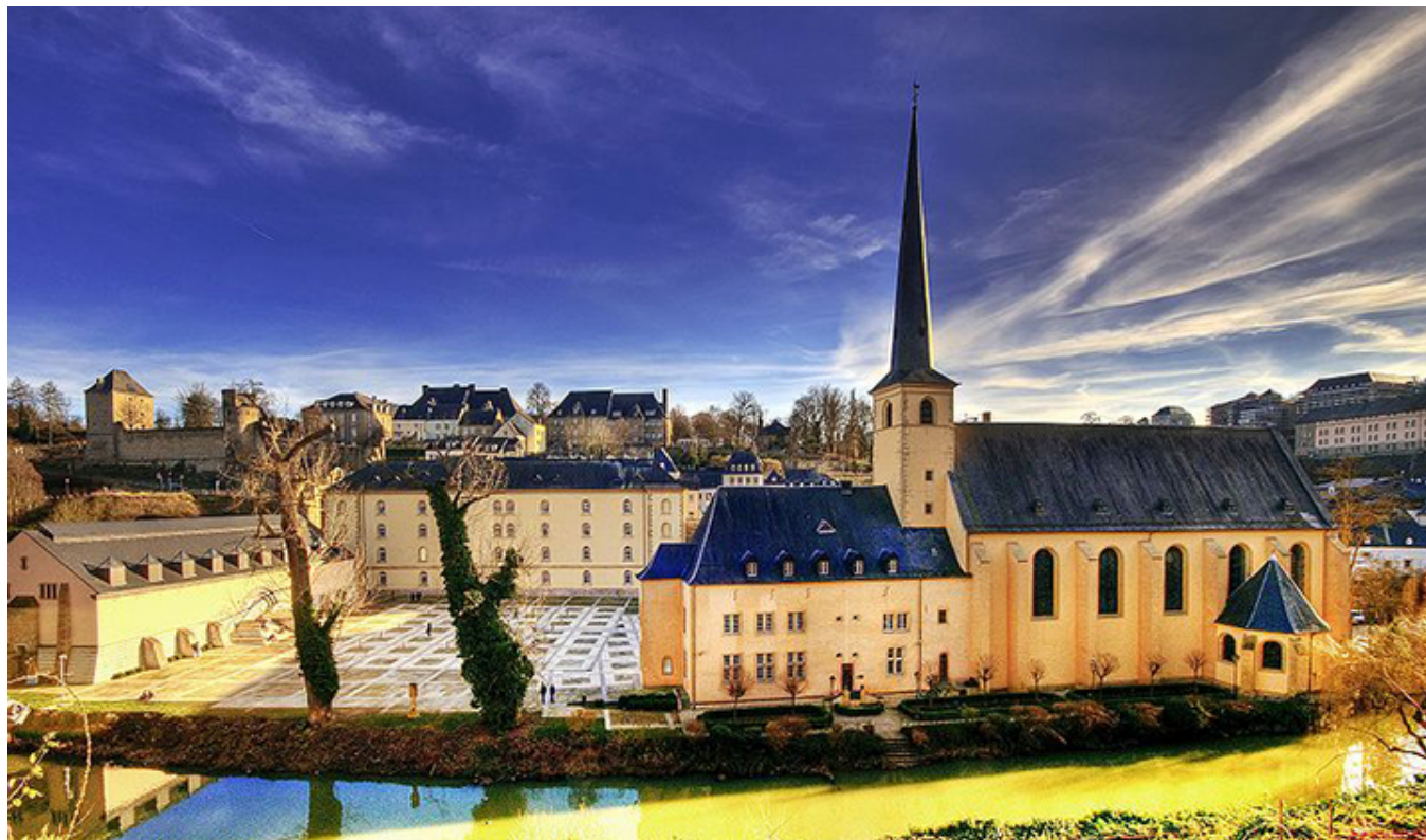
Luksemburg. Opactwo Neumünster.