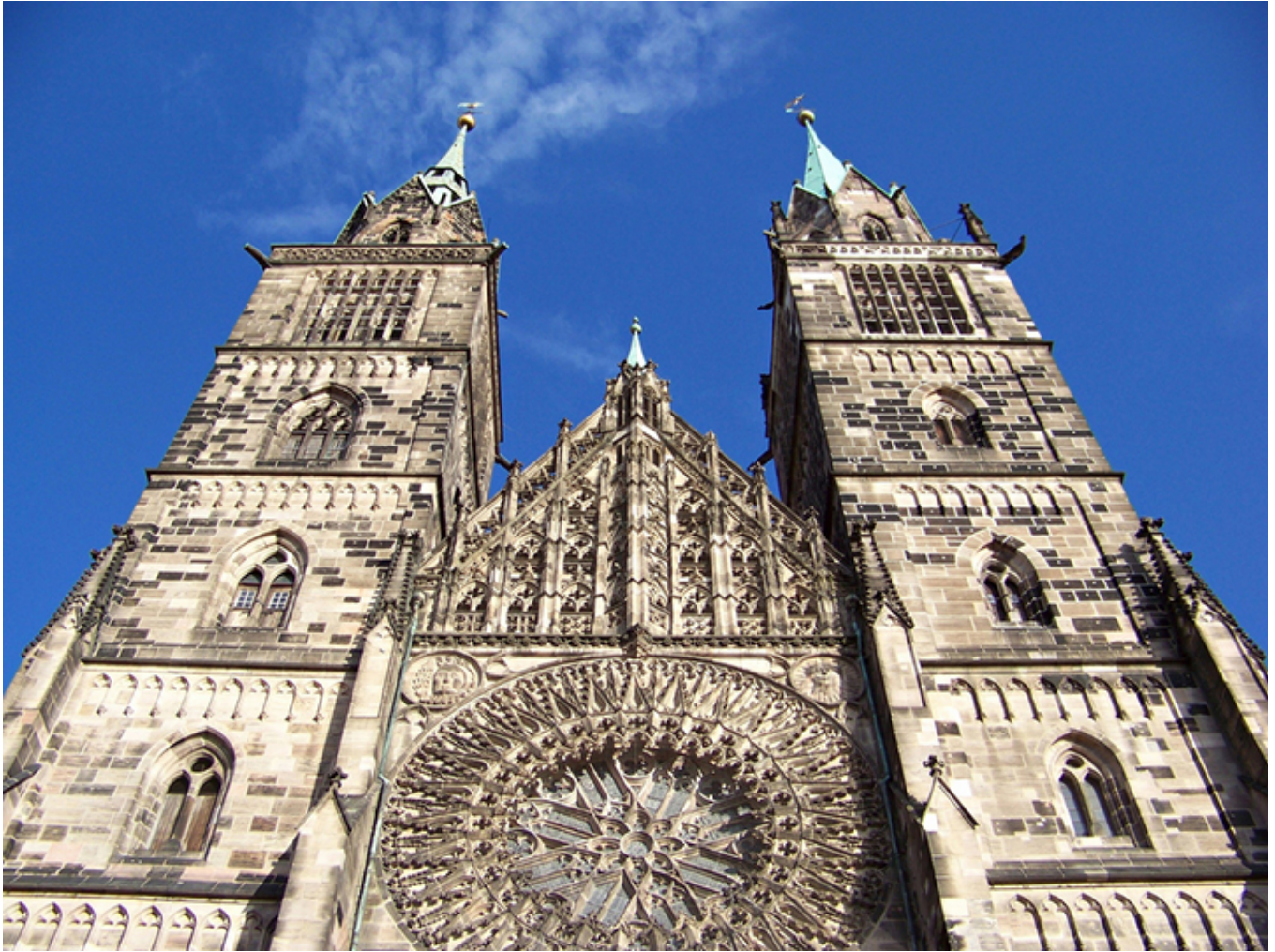
Norymberga. Kościół św. Wawrzyńca.