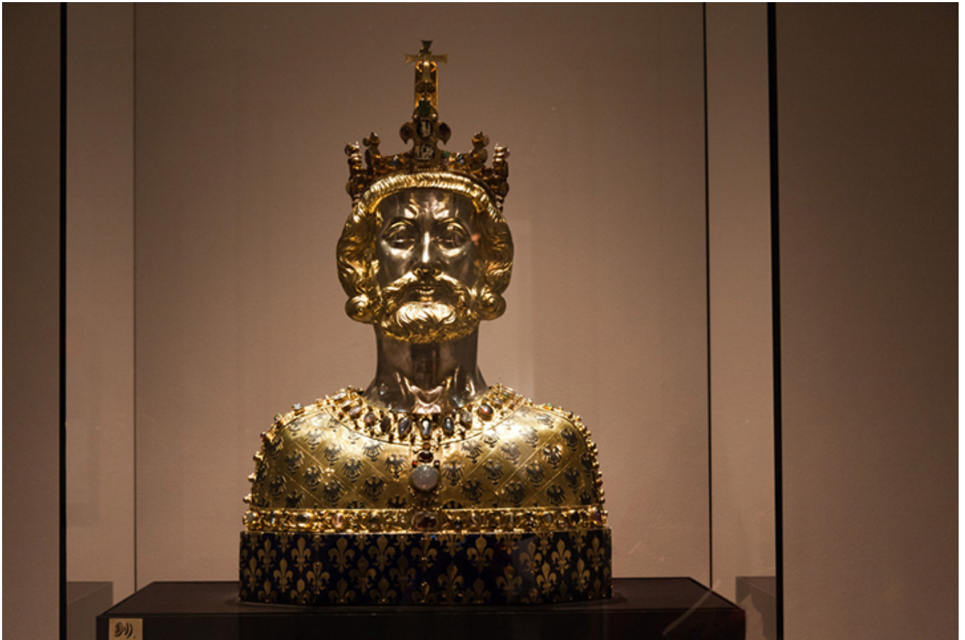
Akwizgran. Karol Wielki.