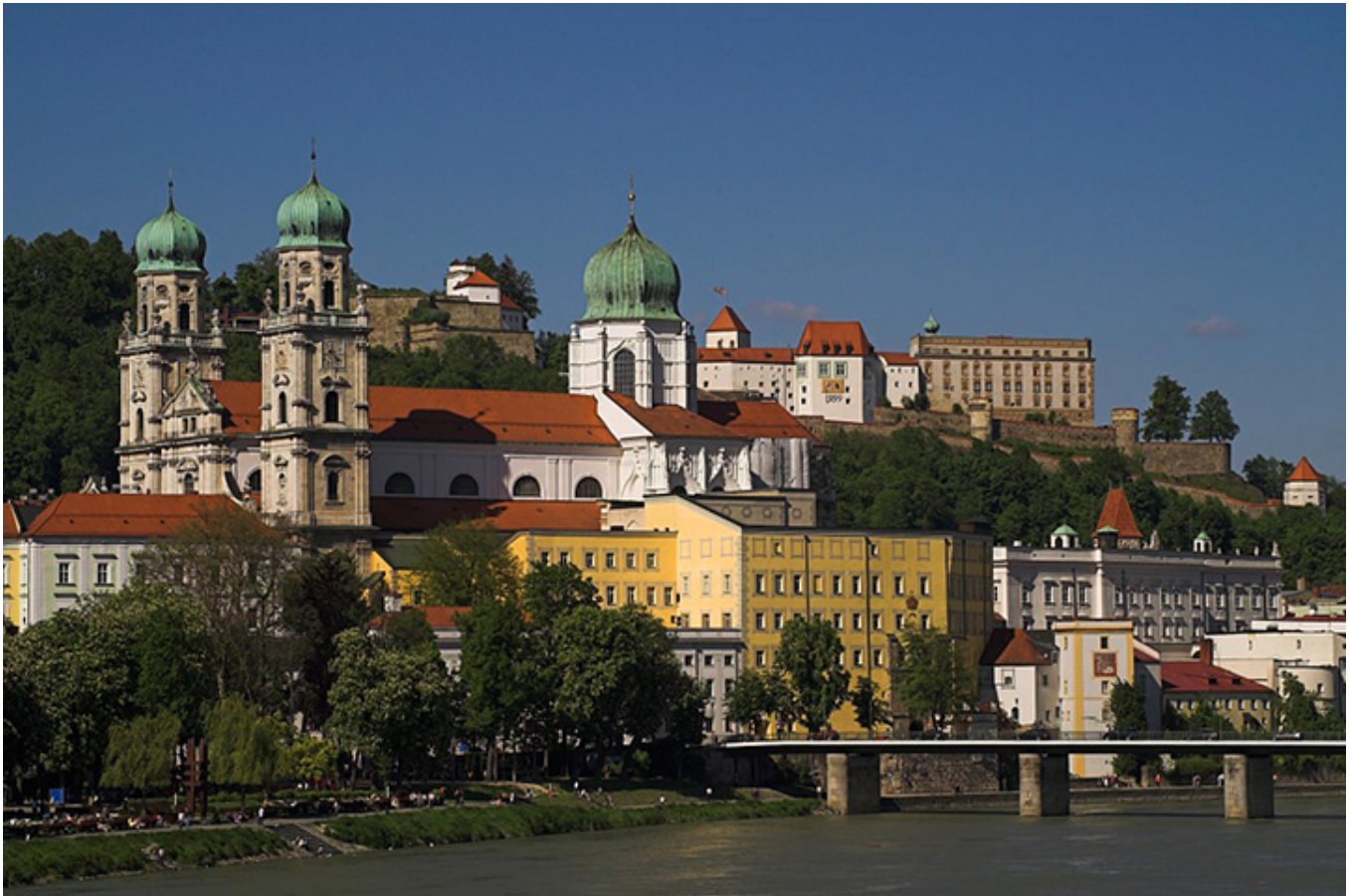
Pasawa. Katedra i Górny Zamek.

Wspinam się potem na wzgórze z kościołem Matki Boskiej Pomocnej. Wewnątrz Matka Boska z Dzieciątkiem, kopia oryginału z Innsbrucku , a oryginał jest pędzla Łukasza Cranacha Starszego i pochodzi z 1537 roku. Widok z góry nadzwyczajnej piękności. Schodzę inną trasą i wśród powodzi zieleni scenka teatralna dla dzieci: dorośli przedstawiają jakąś fascynującą baśń, a dzieci święcie wierzą w to, co się dzieje i na dodatek, śmiertelnie przejęte, same biorą żywy udział w przedstawieniu. W mieście zostały mi jeszcze dwa kościoły: św. Michała i św. Krzyża ( Heiligkreutzkirche ). W tym ostatnim, gotycki nagrobek węgierskiej błogosławionej Gizeli, przykryty wieńcami w węgierskich barwach narodowych. Przed wejściem