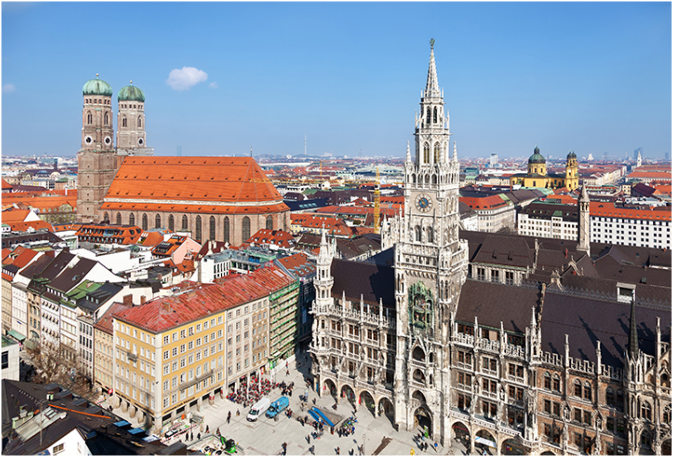
Stare Miasto w Monachium