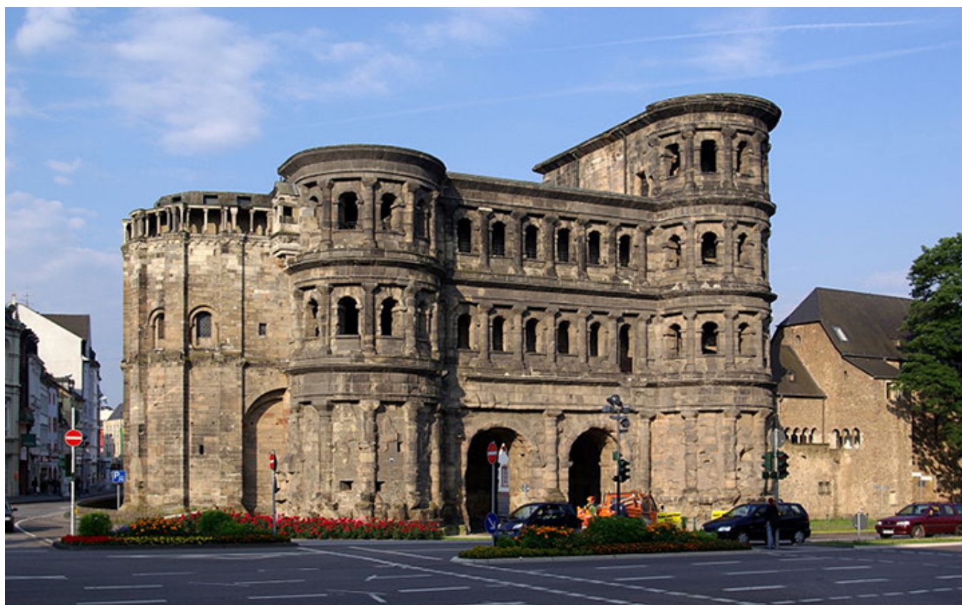
Trewir. Porta Nigra.

Cesarskie i Bazylika Konstantyna, obie budowle z IV w. Wczesnogotycka bazylika Świętego Macieja, XII w., przy opactwie benedyktyńskim, z grobem apostoła Macieja z tego samego okresu. Na Starym Mieście piękna wczesnogotycka kamieniczka „Pod Trzema Królami”, XIII w. Obok bazyliki Konstantyna okazały Pałac Elektorów trewirskich, XVII w. Przed nim park i rzeźby Ferdynanda Tietza (1742-1810). Jednym słowem, ogromne bogactwo zabytków z różnych epok.