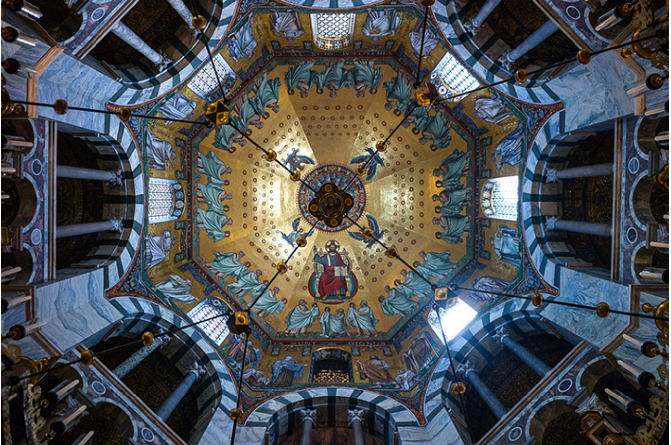
Sklepienie w akwizgrańskiej Katedrze.

Podczas pobytu w sanatorium w Świnoujściu w marcu 2004 r. trzykrotnie jeździłem do Niemiec. 6 marca pojechałem najdalej, aż do Greifswaldu , znanego uniwersyteckiego miasta z gotycką katedrą Świętego Mikołaja z XIII w. i pięknym rynkiem z kamieniczkami o schodkowych szczytach. Nie mogłem się napatrzeć na dwie najstarsze z nich, z ciemnej cegły. Ratusz o ciekawym szczycie jest z XIII w., tak samo jak rynek, na którym stoi. Pozostałe kościoły gotyckie, a więc kościół Mariacki i Świętego Jakuba, wzniesiono także w XIII w. Uniwersytet powstał w XV w. i jest jednym z najstarszych na świecie.