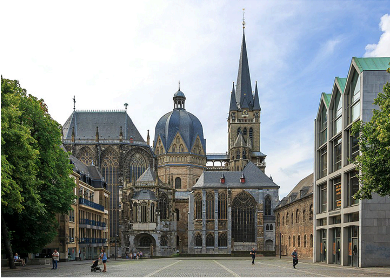
Katedra w Akwizgranie.