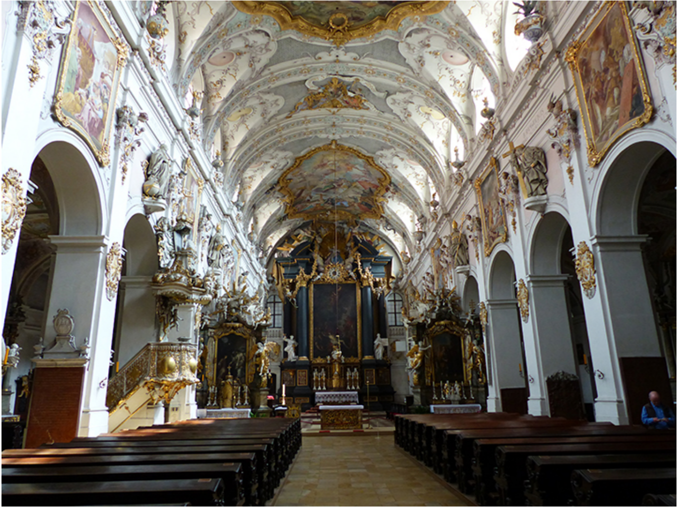
Bazylika św. Emmerama w Ratybonie.