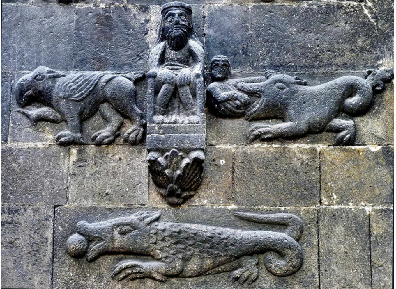
Ratyzbona. Płaskorzeźba na szkockim kościele św. Jakuba