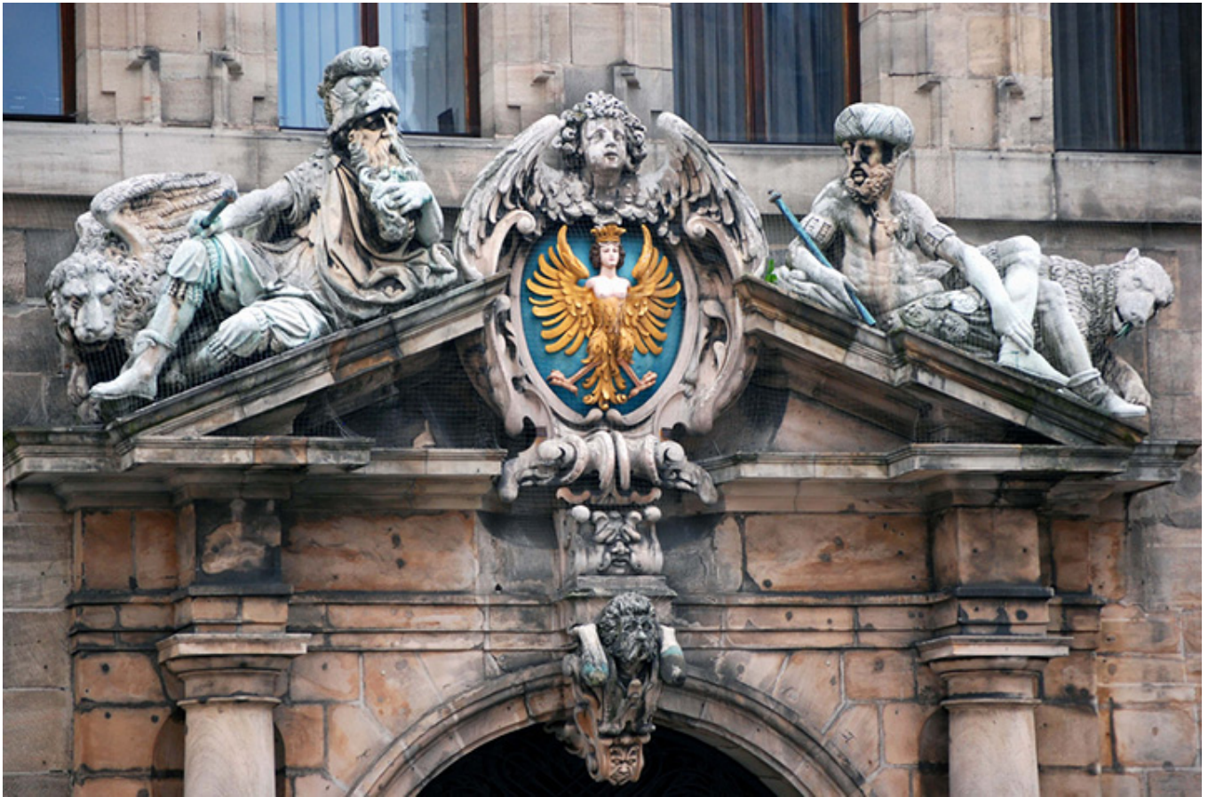
Portal Ratusza w Norymberdze.