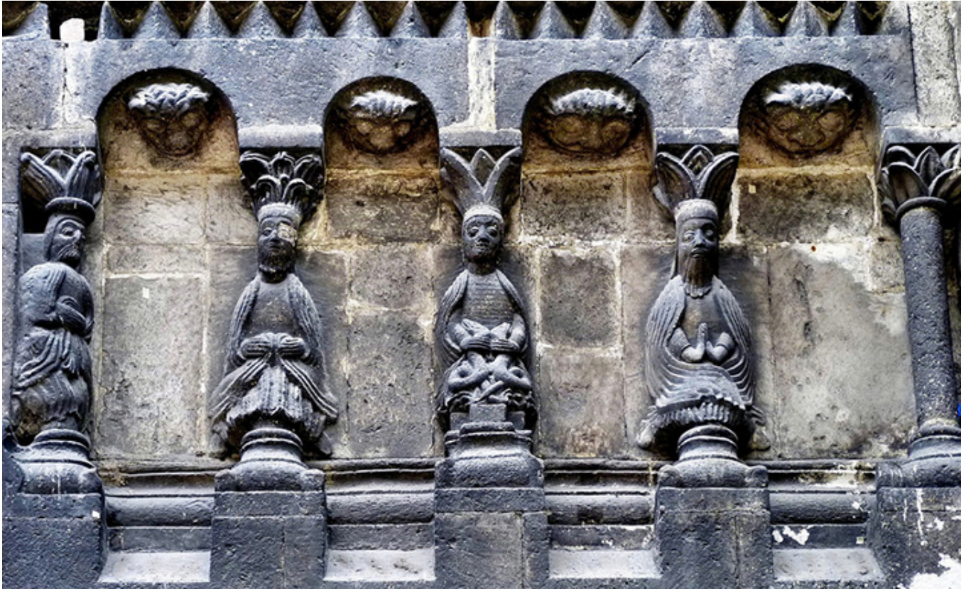
Ratyżbona. Płaskorzeźba na szkockim kościele św. Jakuba.