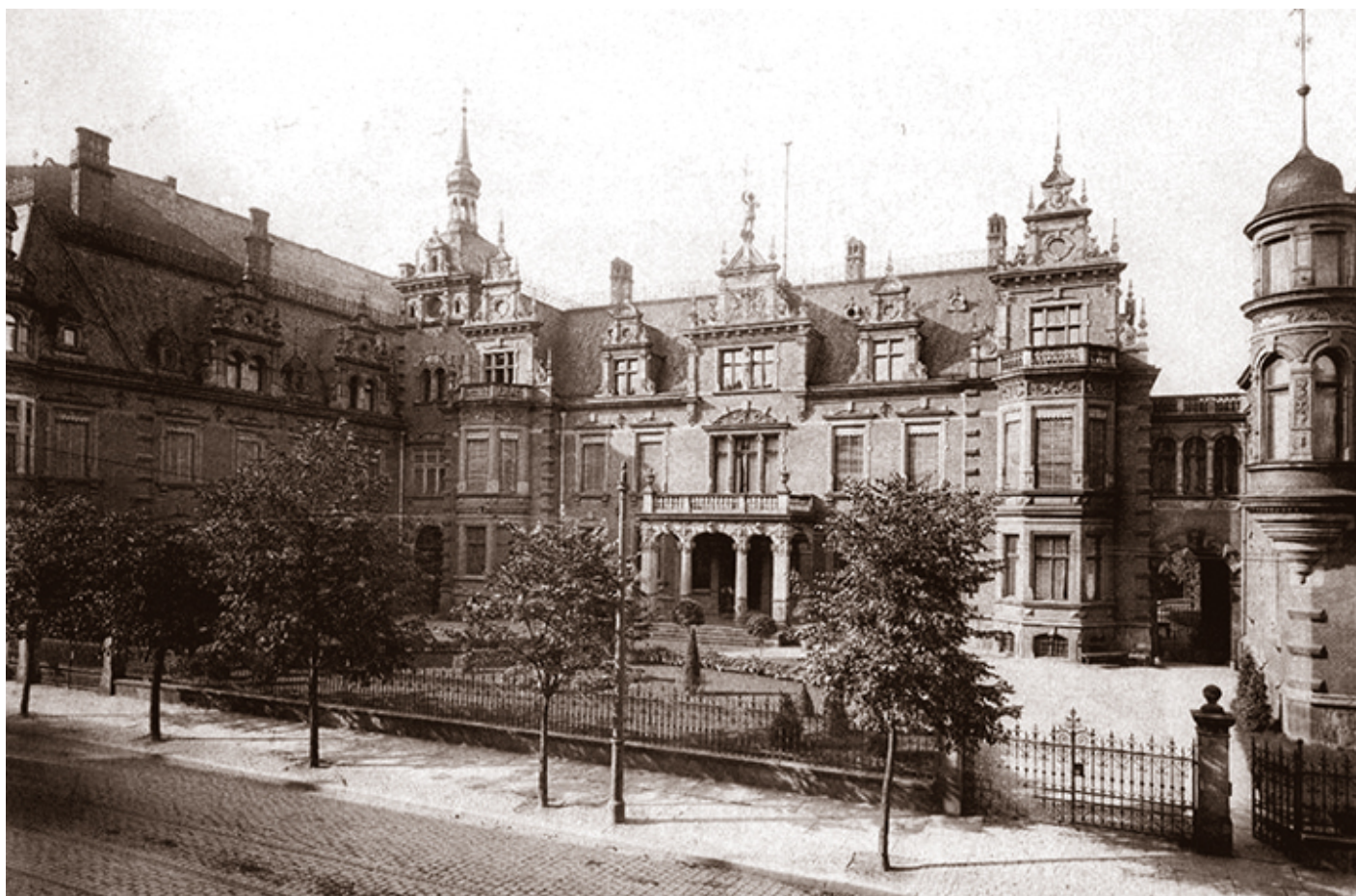
Pałac Schaffgotschów we Wrocławiu, lata 1900-1910, po II wojnie światowej legendarny klub studencki „Pałacyk”