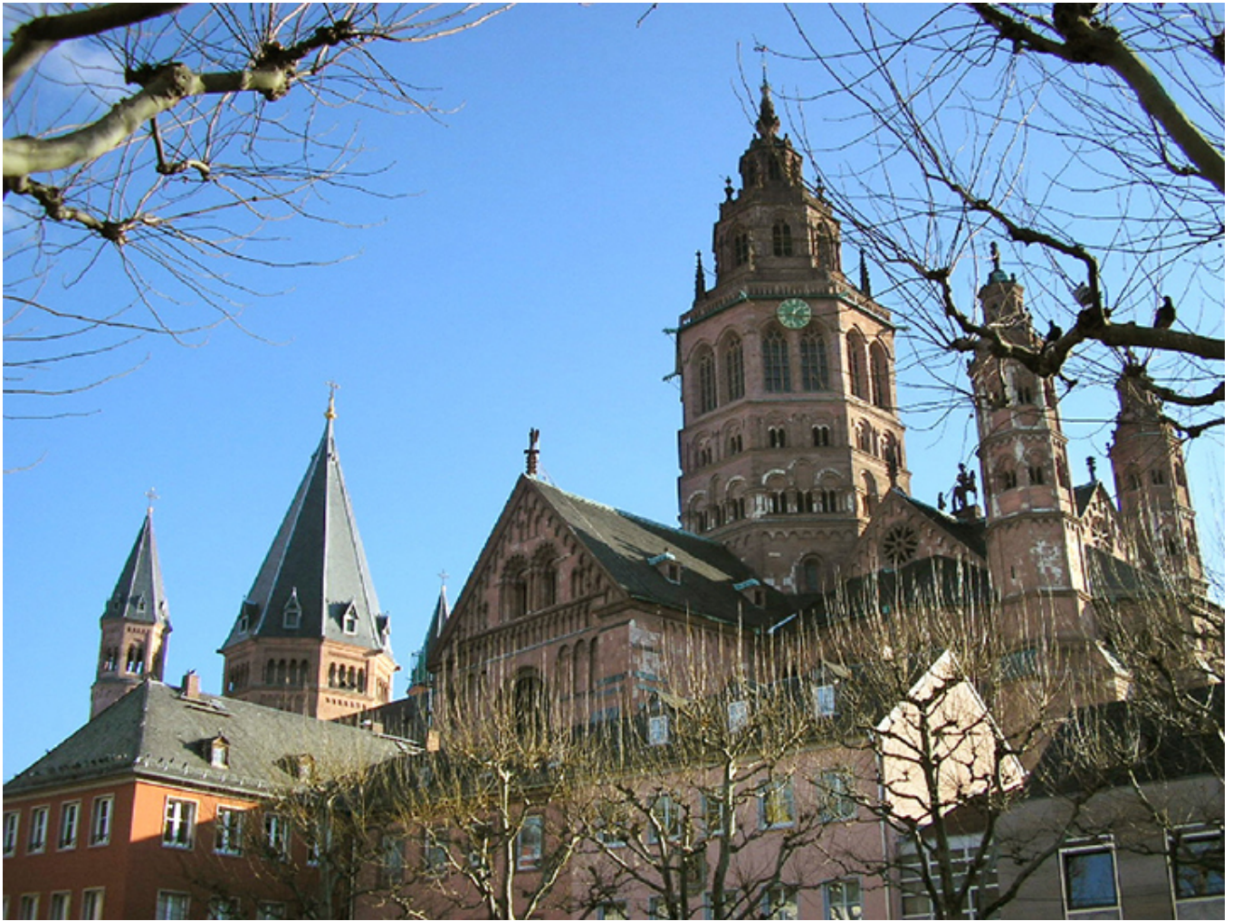
Katedra w Moguncji