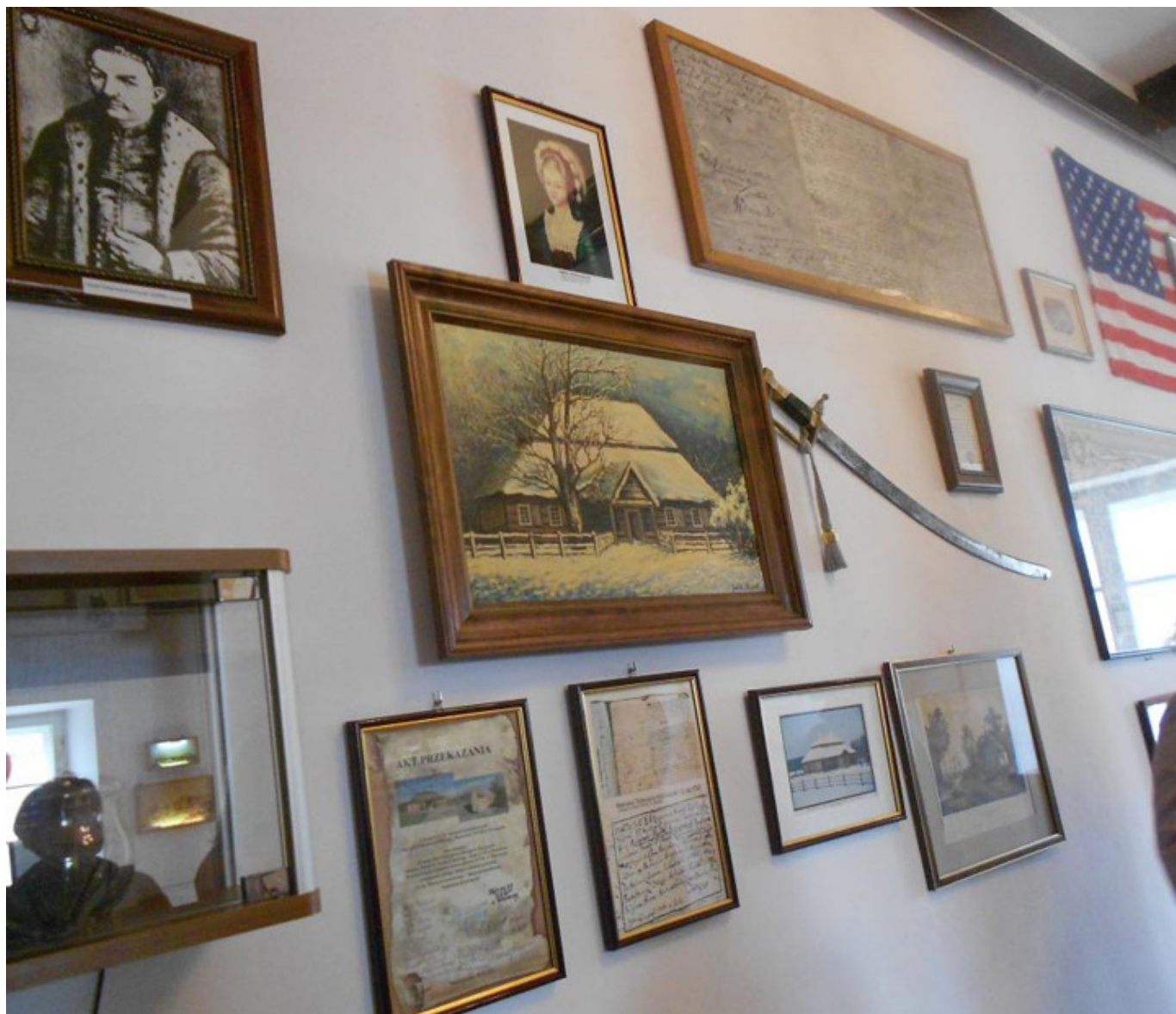
Muzeum Tadeusza Kościuszki w Maciejowicach, fot. Barbara Kukulska.

Maciejowskiego w XVI wieku. Rodowa siedziba wzniesiona w naturalnie obronnym terenie nad rzeczką Okrzejką, została przebudowana przez następnych właścicieli Zbąskich na pałac barokowy. W 1705 osiedlili się tam Potoccy, a pod koniec wieku XVIII Zamoyscy. Podczas powstania kościuszkowskiego Naczelnik spędził tam noc przed bitwą oraz opatrywany był z ran po przegranej bitwie maciejowickiej.