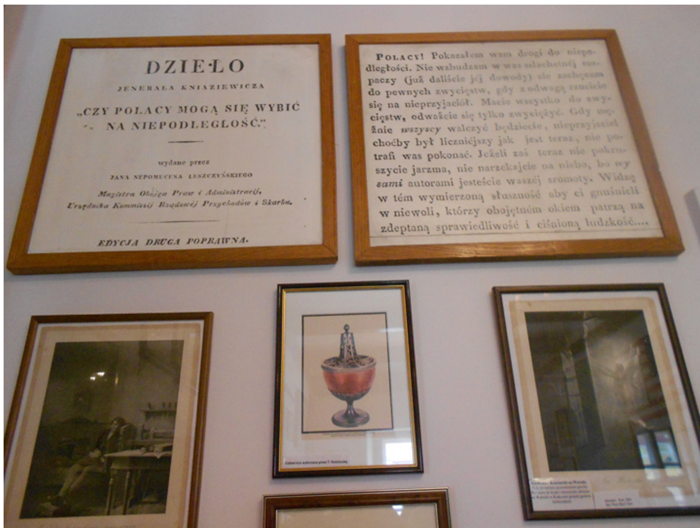
Muzeum Tadeusza Kościuszki w Maciejowicach, fot. Barbara Kukulska.