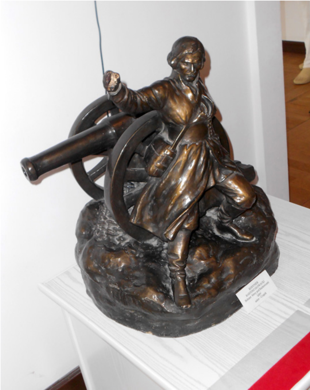
1800-1808 MONTAGNA DI SAN GIULIO Battaglia di Marengo 1800 1808 1800-1808