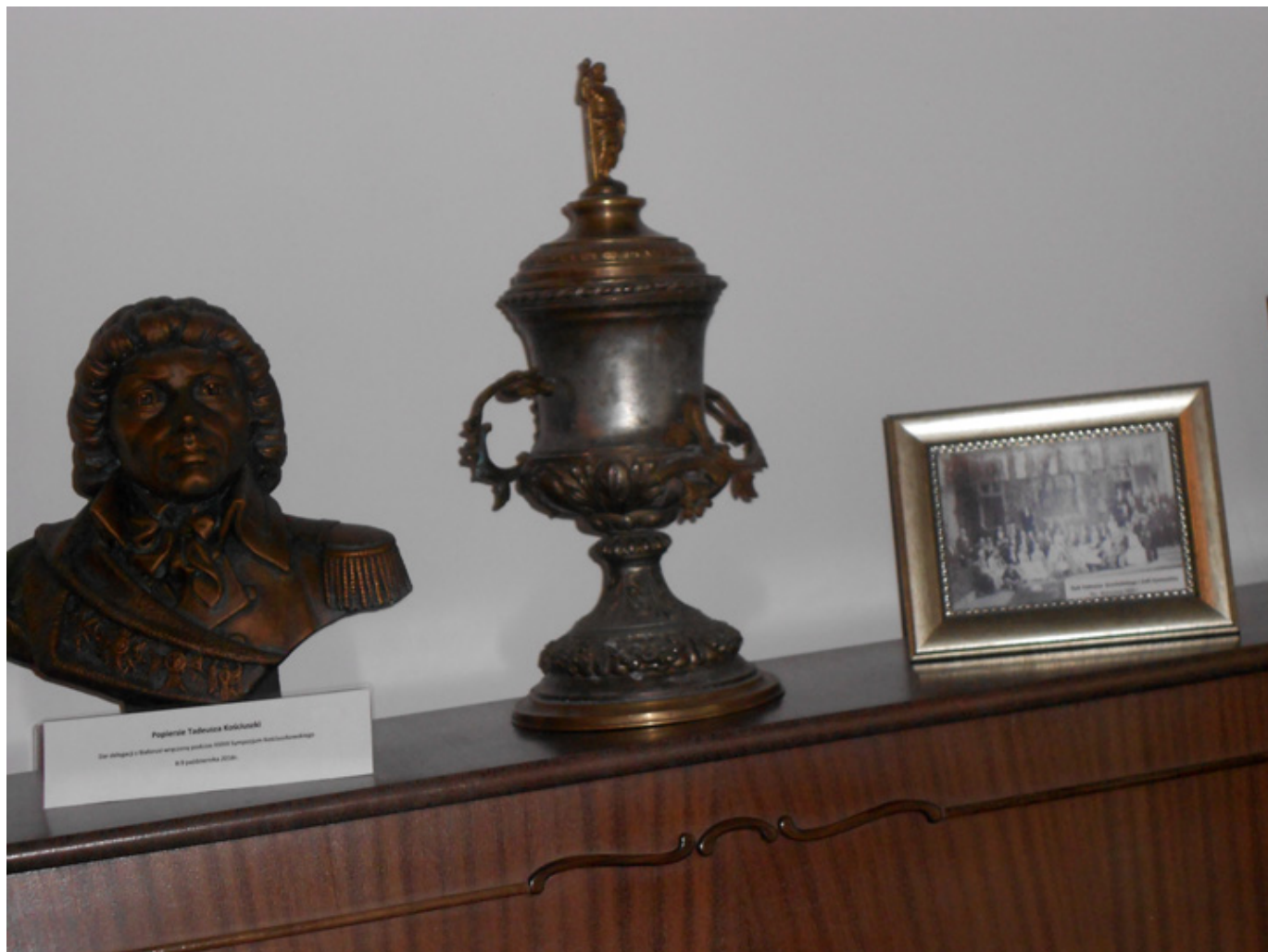
Papież Jan XXIII Wzrost: 1,68 m, waga: 65 kg, data urodzenia: 25 stycznia 1912 r., data śmierci: 3 czerwca 1963 r.