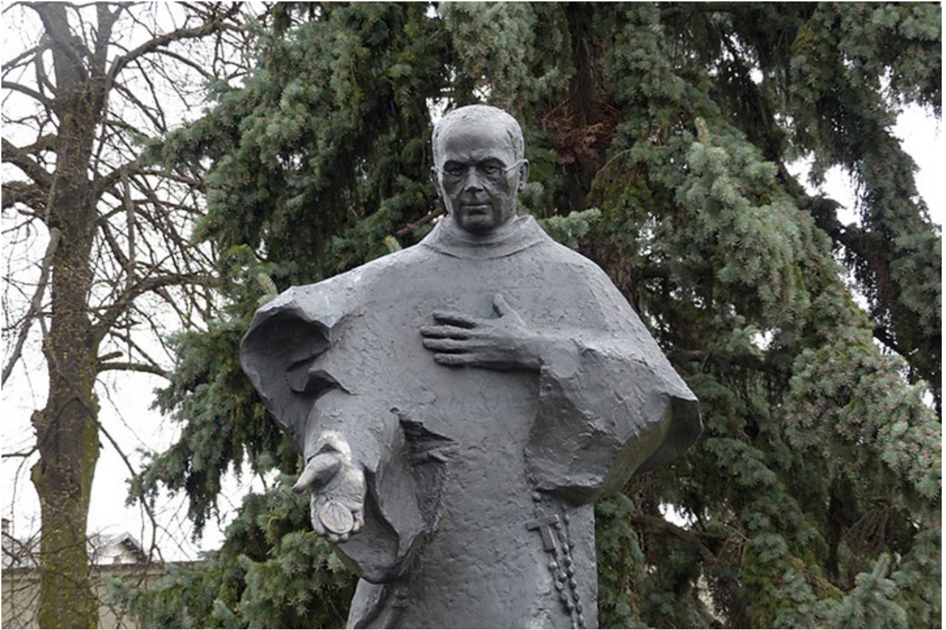
Pomnik św. Maksymiliana Kolbe w Niepokalanowie