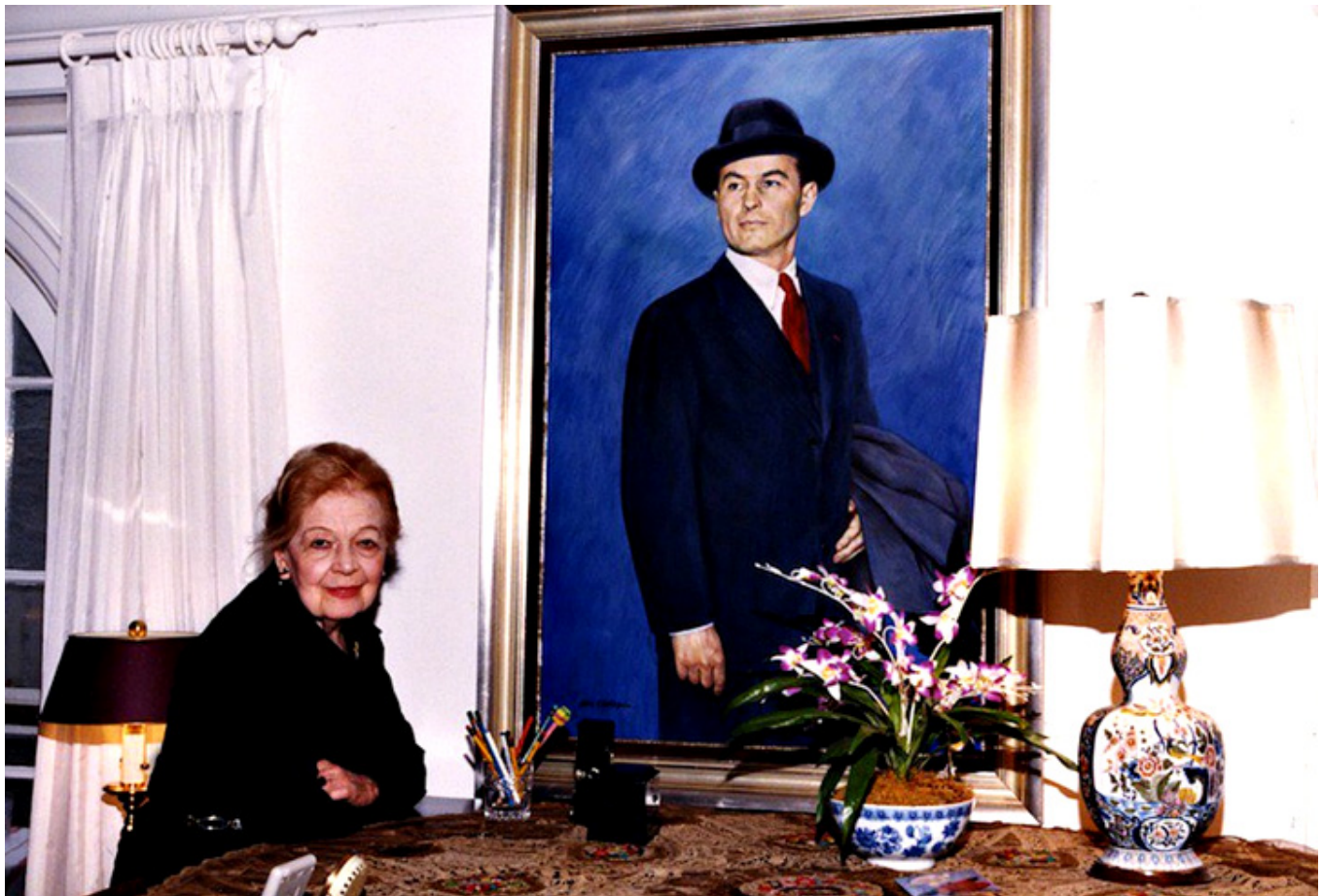
Marta Eggerth przy portrecie Jana Kiepury.