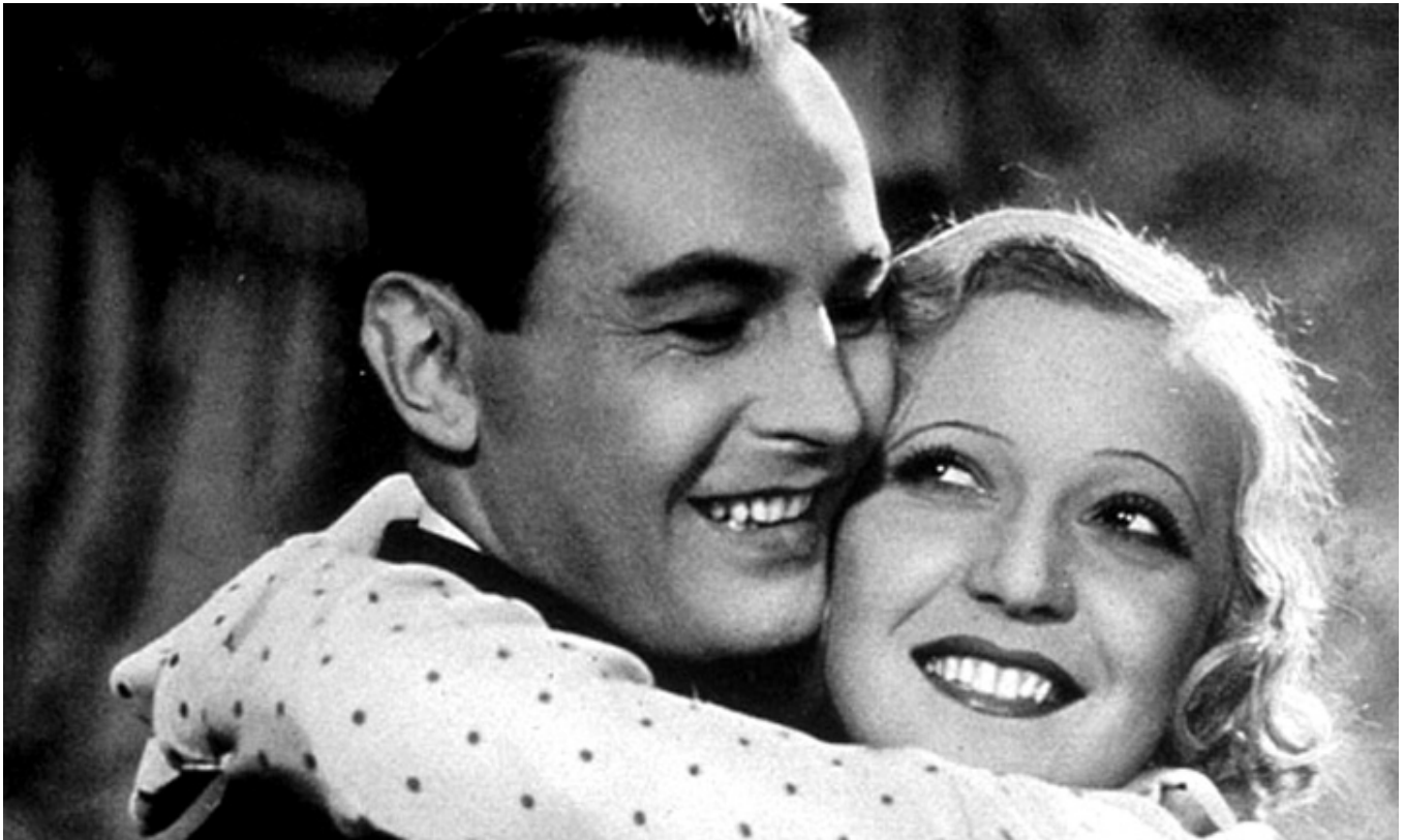
Marta Eggerth i Jan Kiepura