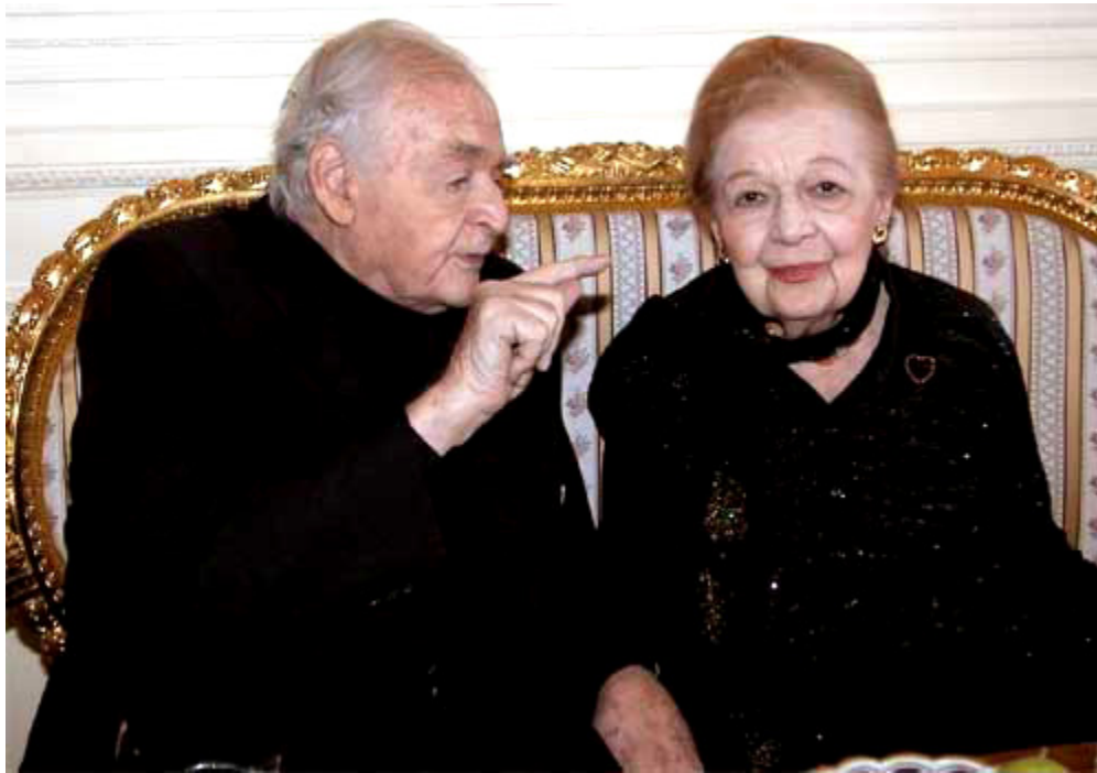
Marta Eggerth i Marcel Pravy