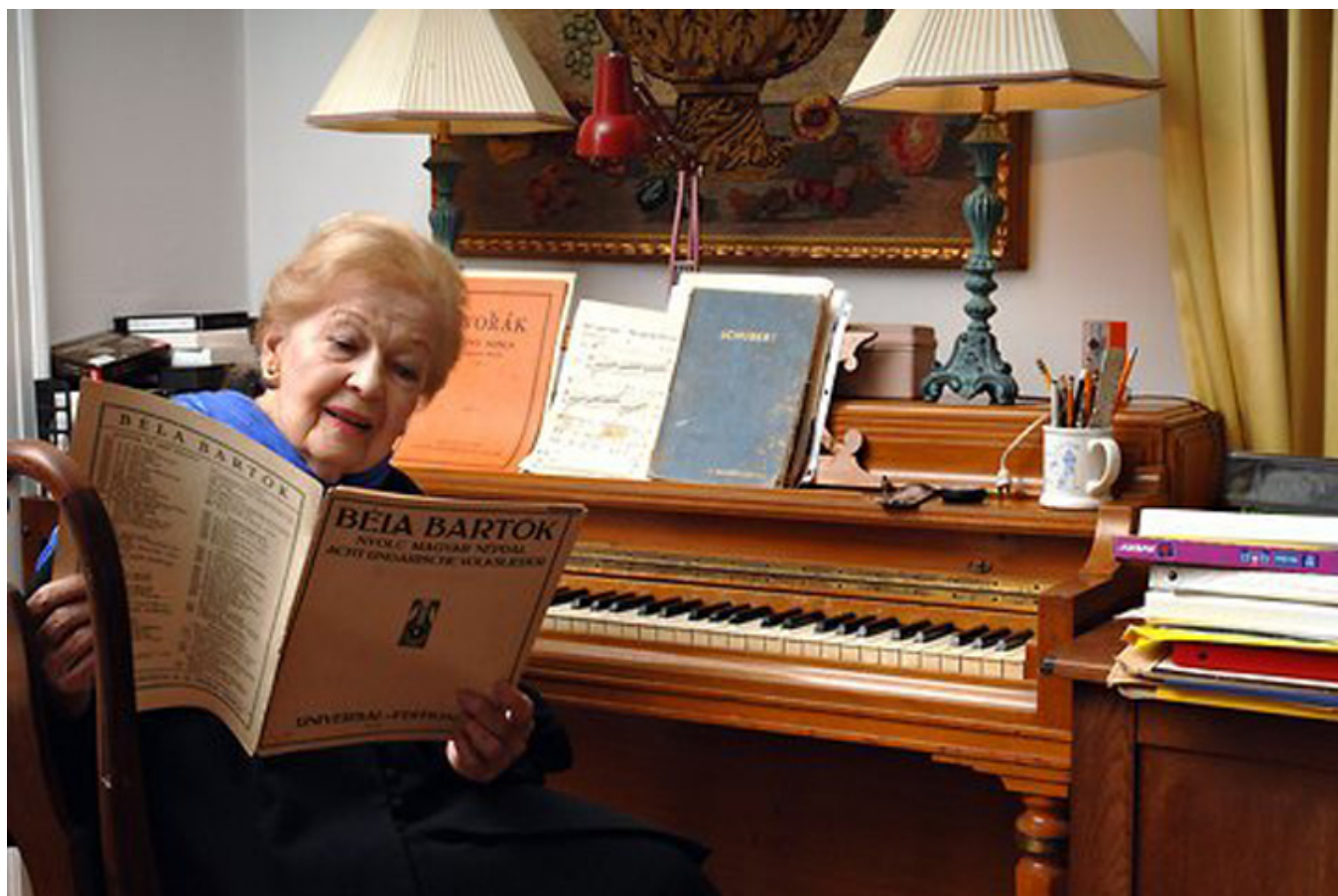
Marta Eggerth w swoim domu w Nowym Jorku, 2005 r.