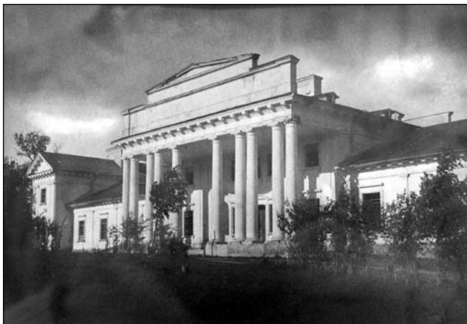
Pałac Tyszkiewiczów w Łohojsku