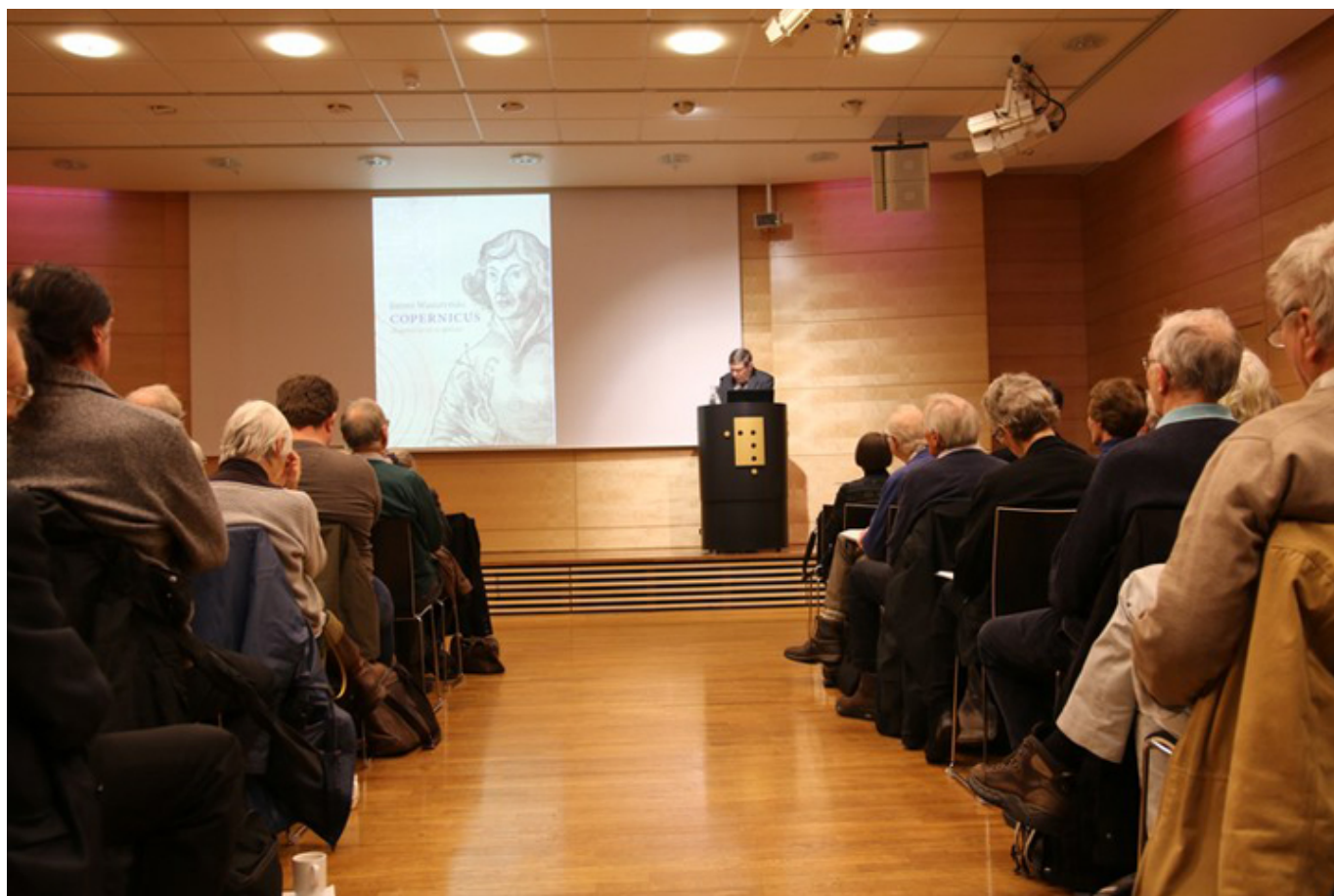
Biblioteka Narodowa w Oslo 25 stycznia 2018 r.

25 stycznia 2018 r. w Bibliotece Narodowej w Oslo odbyła się promocja książki Jeremiego Wasiutyńskiego „Copernicus - skaperen av en ny himmel” (Kopernik - twórca nowego nieba). Duża sala wykładowa była szczelnie wypełniona polską i norweską publicznością. Nieczęsto zdarza się, aby tego rodzaju impreza spotkała się z tak żywym zainteresowaniem. Jednak co najmniej trzy powody przyciągnęły słuchaczy. Powód pierwszy: osoba autora. Powód drugi: sama książka. Powód trzeci: jej tłumaczenie na język norweski.