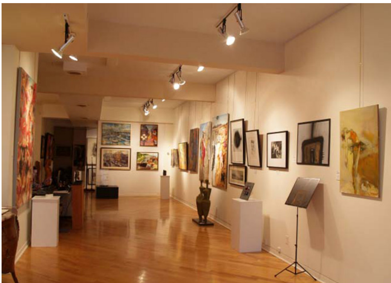
Wystawa prac polskich artystów w Montrealu, Galerie D'Arts Contemporains, 1-30 XII 2016

Nareszcie Polacy byli widoczni w sztuce kanadyjskiej - POLISH ARTISTS in CANADA, Montreal, Galerie D'Arts Contemporains, 1-30 XII 2016 r.