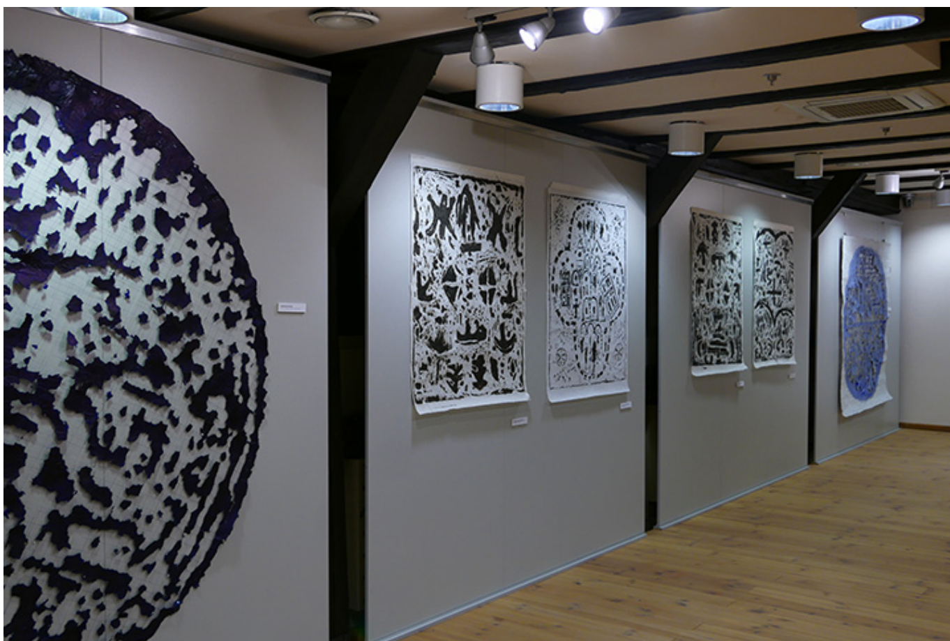
Wystawa prac Edwarda Barana w Muzeum Papiernictwa w Dusznikach Zdroju

Tytułowe W przestrzeni papieru jest komunikatem i zarazem, już na wstępie, daje nam wyobrażenie o prezentowanych na wystawie dziełach. 30 prac z lat 1970 - 2019 zawisło w muzealnej przestrzeni, w tym najwięcej tzw. „papierów wolnych”, wydzieranych, swobodnie zwisających, najbardziej charakterystycznych spośród wszystkich dzieł. Oprócz obrazów, pokazano prace graficzne - estampaże (gipsoryty), wykonane na papierze ryżowym.