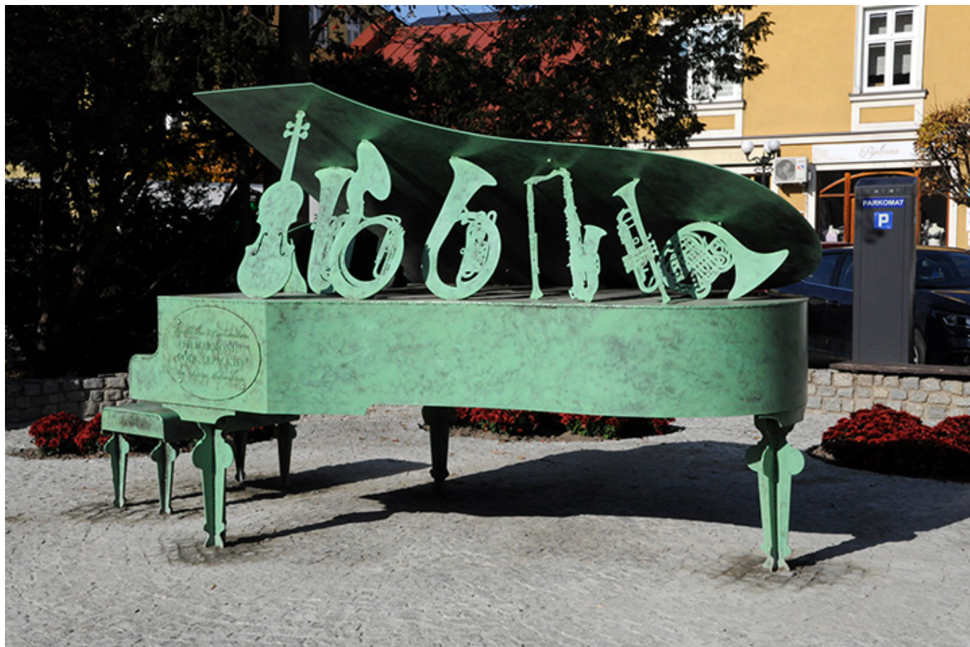
Pomnik poświęcony 60-tej rocznicy Dni Muzyki Kameralnej w Łańcucie, fot. Wrzesław Żurawski