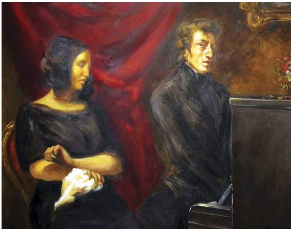
Eugeniusz Delacroix, Fryderyk Chopin i George Sand