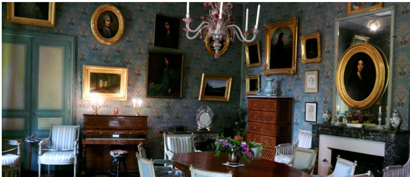
Pałac George Sand w Nohant