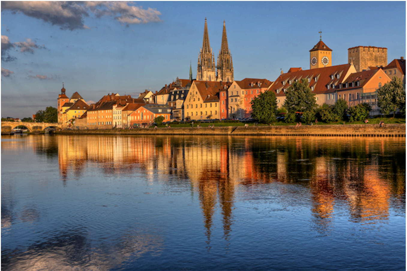
Katedra i Wieża Zegarowa Starego Ratusza w Ratyzbonie