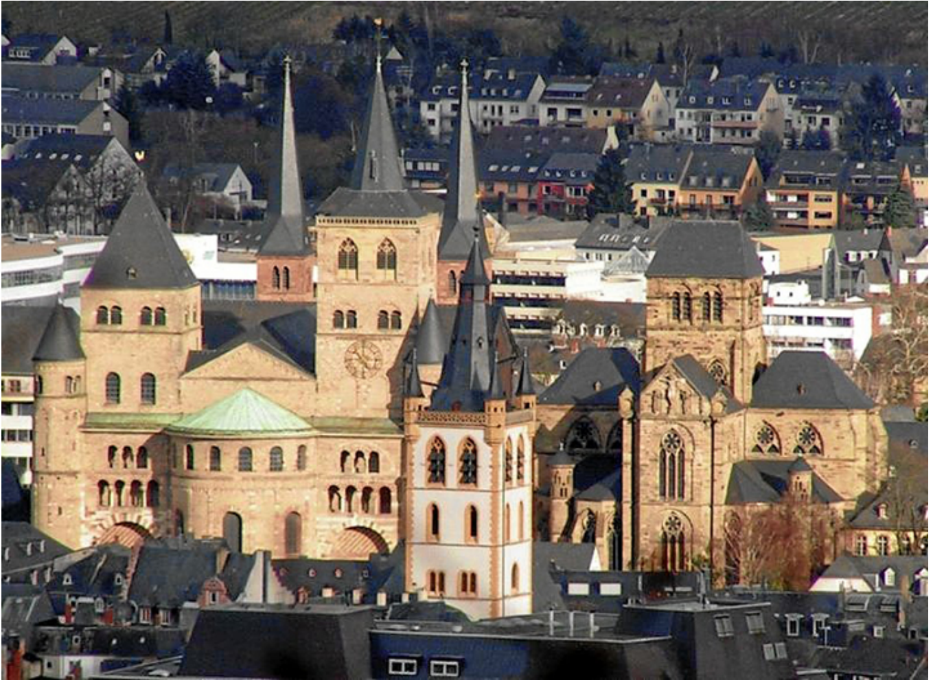
Trewir. Katedra Św. Gandolfa i Kościół Mariacki.

Zdecydowanie najpiękniejszym miastem niemieckim wydał mi się Trewir , po niemiecku Trier . Po prostu чудо! Leży nad Mozela, osłonięte wzgórzami, gdzie winnice. Przepiękny Rynek Główny z kościołem Świętego Gandolfa XIV/XV w., z krzyżem i fontanną pośrodku. Ogromna romańska katedra Świętego Piotra z X w., tuż obok gotycki kościół Najświętszej Marii Panny ( Liebfrauenkirche ) z XIII w., z pięknym portalem zachodnim.