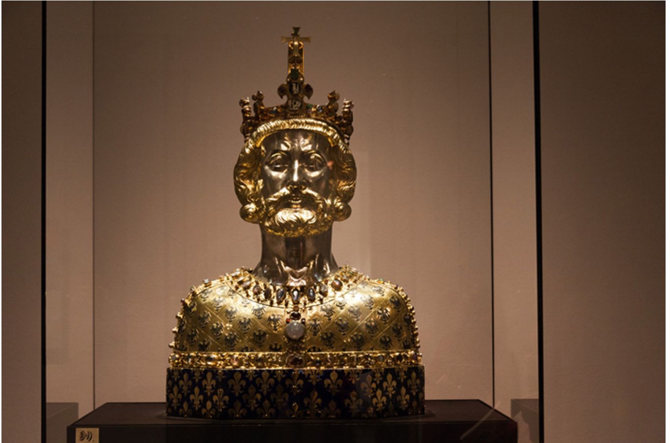
Akwizgran. Karol Wielki.