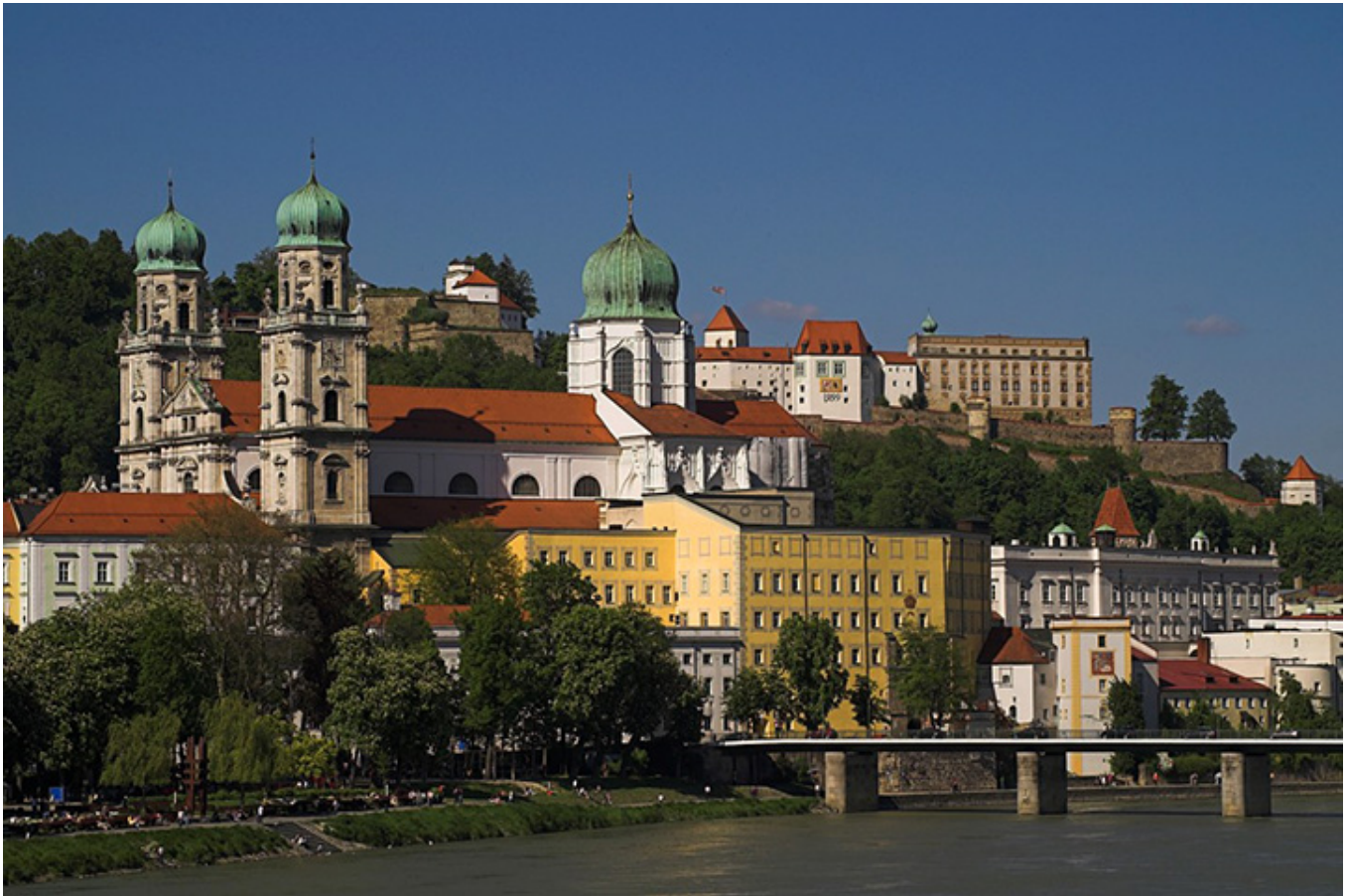
Pasawa. Katedra i Górny Zamek.

Wspinam się potem na wzgórze z kościołem Matki Boskiej Pomocnej. Wewnątrz Matka Boska z Dzieciątkiem, kopia oryginału z Innsbrucku , a oryginał jest pędzla Łukasza Cranacha Starszego i pochodzi z 1537 roku. Widok z góry nadzwyczajnej piękności. Schodzę inną trasą i wśród powodzi zieleni scenka teatralna dla dzieci: dorośli przedstawiają jakąś fascynującą baśń, a dzieci święcie wierzą w to, co się dzieje i na dodatek, śmiertelnie przejęte, same biorą żywy udział w przedstawieniu. W mieście zostały mi jeszcze dwa kościoły: św. Michała i św. Krzyża ( Heiligkreutzkirche ). W tym ostatnim, gotycki nagrobek węgierskiej błogosławionej Gizeli, przykryty wieńcami w węgierskich barwach narodowych. Przed wejściem