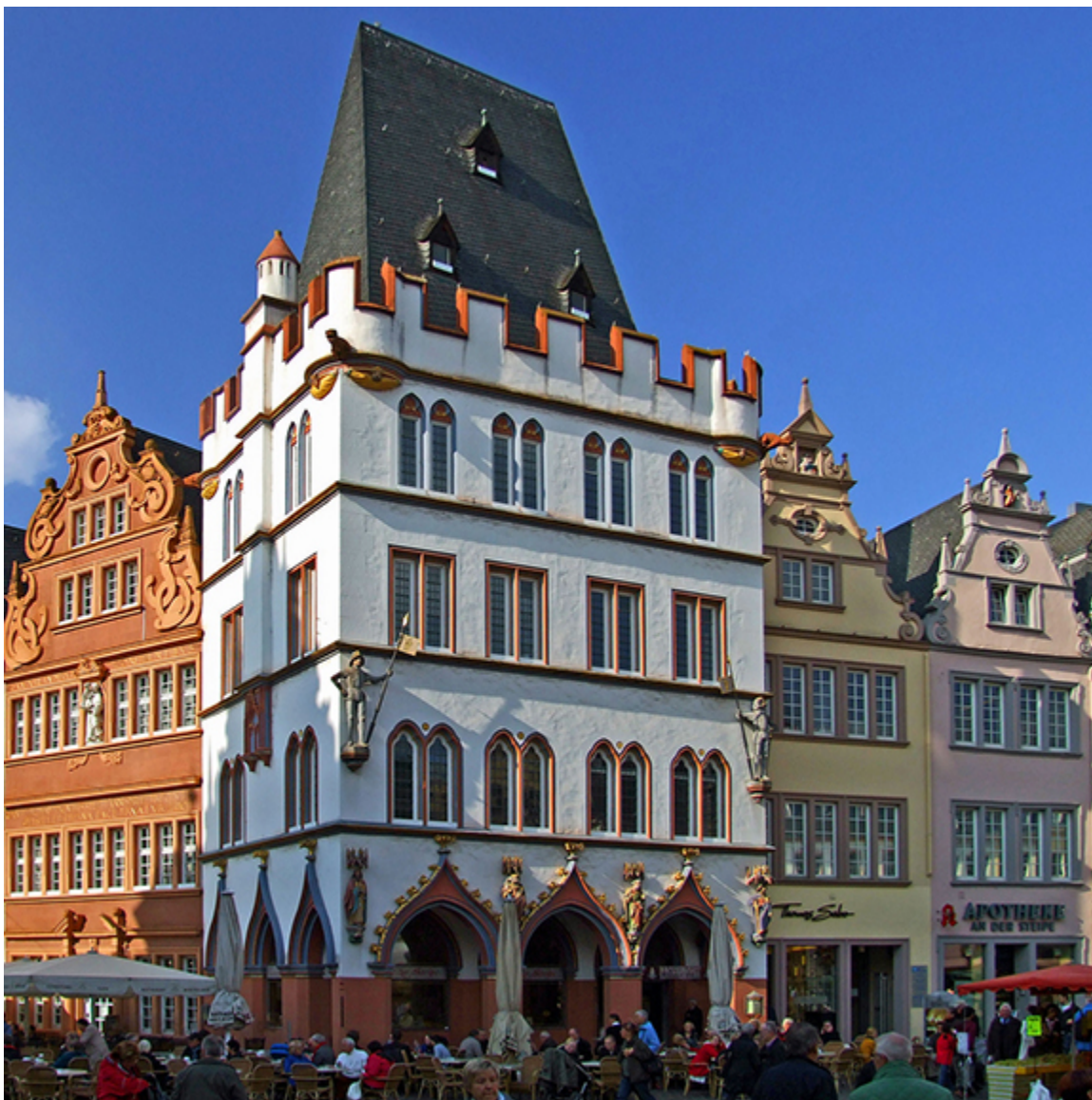
Trewir. Rynek Główny. Kamienica pod Arkadami i Czerwona Kamienica.

Podczas drugiego wyjazdu na wykład do Gießen , czy też wracając stamtąd, już nie pamiętam, a było to w dniach 10-12 lipca 1994 r., zatrzymałem się we Frankfurcie nad Menem . Upał był wówczas nieznośny. Obejrzałem zabytkowy ratusz z XV w. i szachulcowe kamieniczki na rynku, gotycki kościół Świętego Mikołaja z końca XIII w., gotycką Farę Świętego Bartłomieja z XIV w. i Dom Goethego, ale tylko z zewnątrz.