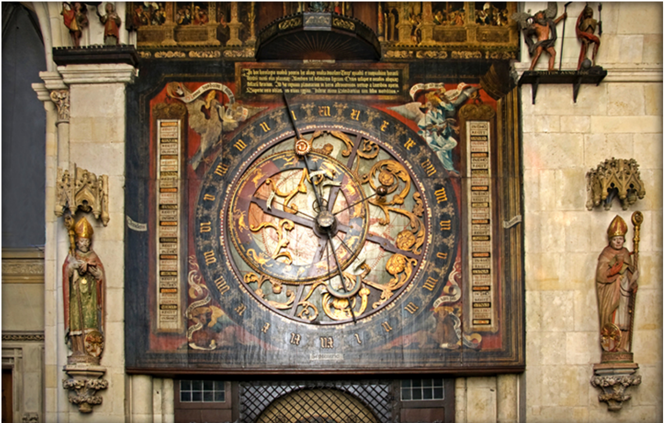
Münster. Zegar na Katedrze św. Pawła.

Z Bochum pojechałem najpierw sam do Münster , miasta mocno zniszczonego w czasie wojny. Teraz całe Stare Miasto odbudowane po zniszczeniach i pełne życia. Najbardziej oryginalnie wygląda przysadzista romańsko-gotycka katedra Świętego Pawła o dwóch potężnych wieżach przy wejściu głównym, XII w. Wewnątrz zegar astronomiczny z XVI w, a od strony dziedzińca bogato zdobiony rzeźbami portal o nazwie Raj, z Chrystusem na Sądzie Ostatecznym. Plac przy katedrze zwie się Rynkiem Głównym ( Prinzipalmarkt ) i otaczają go odbudowane renesansowe kamieniczki z arkadami. Jedną z nich jest gotycki Ratusz, gdzie podpisano Pokój Westfalski po Wojnie Trzydziestoletniej. Niedaleko gotycki kościół Najświętszej Marii