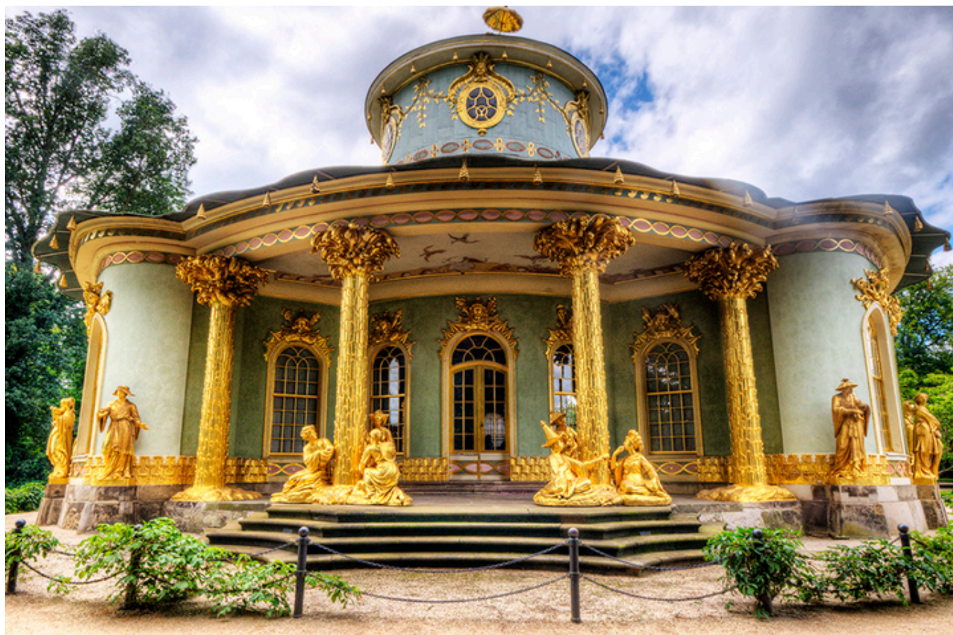
Poczdam. Chiński Dom.

pojechałem sam. Cała atmosfera tej krainy urzekła mnie. Płynąłem łodzią po kanale, zwiedziłem muzeum i rozmawiałem z mieszkańcami, którzy języka łużyckiego już nie znają, niestety. Ale otoczenie piękne: mocno zalesiony teren i te wąskie kanały.