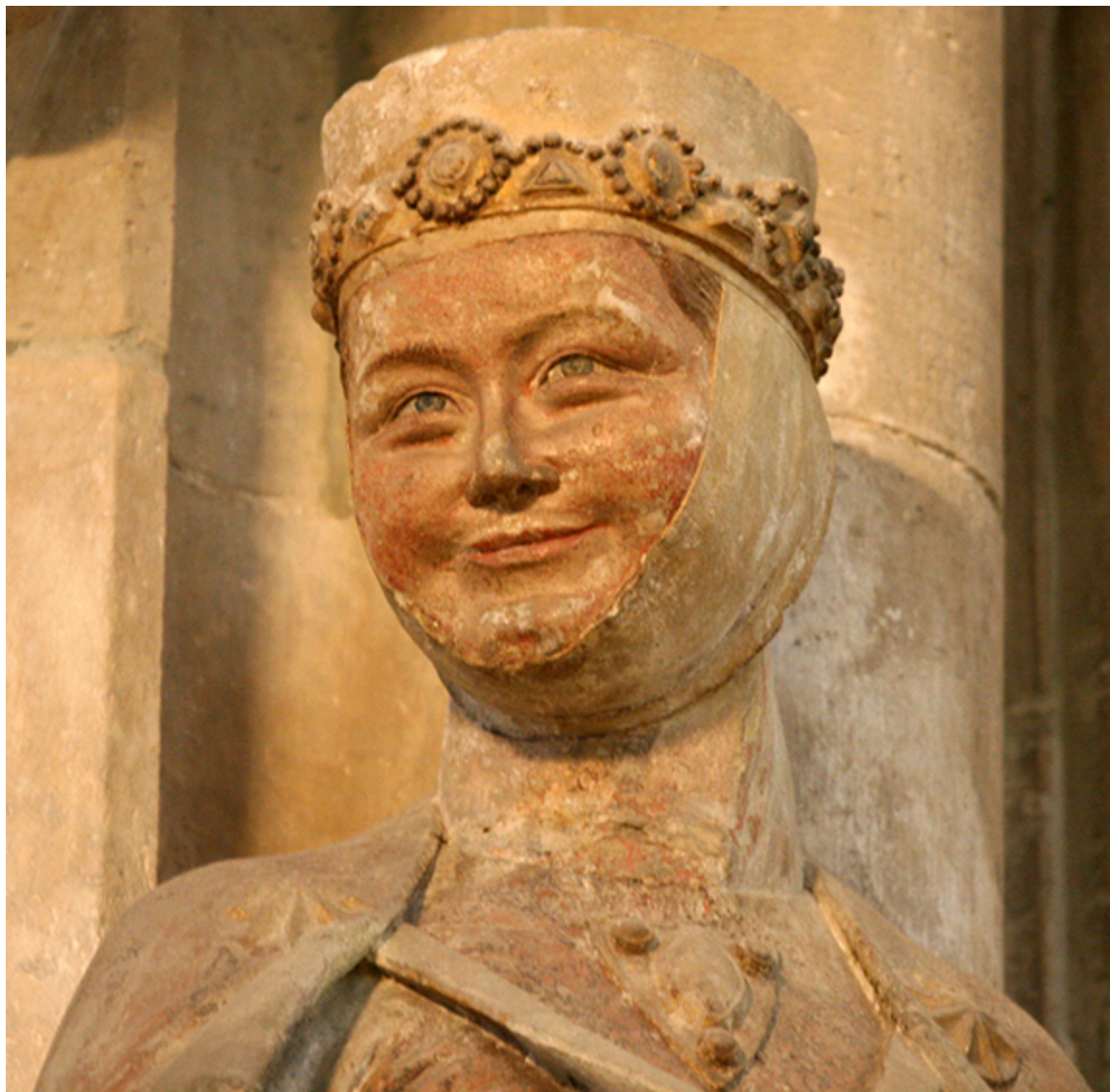
Naumburg. Regelinda, córka Chrobrego.