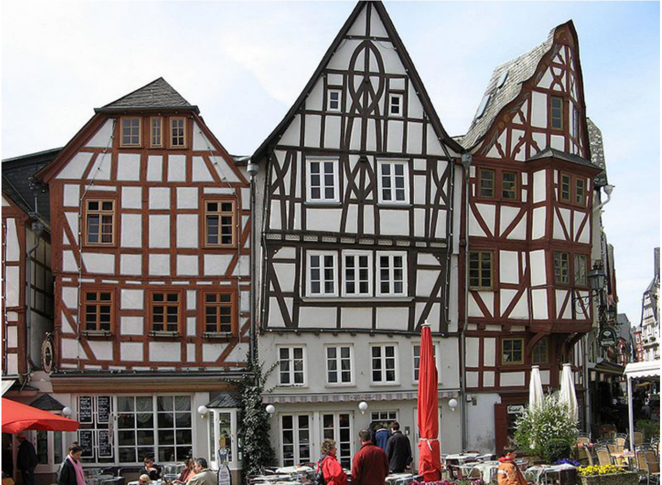
Limburg. Stare Miasto.

Tego samego dnia Limburg nad Lahnem, miasto o wspaniałej czerwono-białej romańsko-gotyckiej katedrze, z jedną wysoką wieżą pośrodku i czterema niższymi po bokach, XIII w. Portale skromne, za to nad głównym wielka rozeta, a wewnątrz malowidła ścienne (Święty Krzysztof, Dawid), witraże w oknach i romańska chrzcielnica. Tuż obok katedry, zamek z szarego kamienia z XIII w. Szachulcowe kamieniczki na Starym Mieście