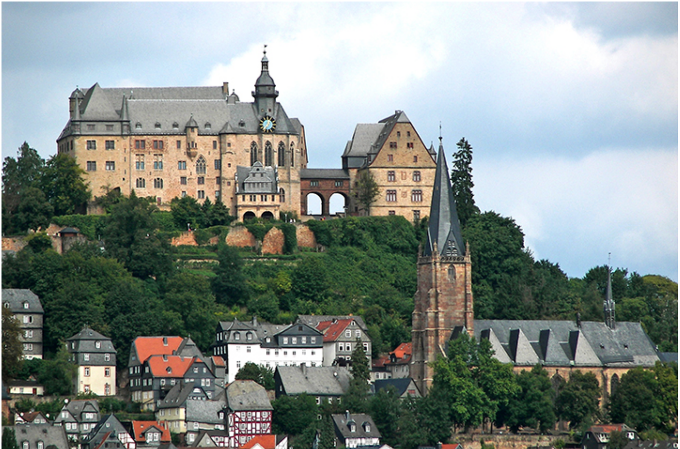
Marburg. Zamek i kościół św. Marcina.

Trzy lata później, w 1989 r., zostałem zaproszony na wykłady do Gießen i Bochum , skąd robiłem wycieczki do ciekawych miejscowości. Z Gießen pojechałem najpierw do Marburga , znanego uniwersyteckiego miasta, położonego malowniczo na wzgórzu nad rzeką Lahn. Górujący nad miastem zamek pochodzi z IX wieku, a pierwszy w Niemczech protestancki uniwersytet założony został właśnie tutaj w okresie Reformacji przez Księcia Filipa Wielkodusznego w XVI w. Gotycki kościół Św. Elżbiety jest z XII w., a najstarsza zachowana w mieście kamieniczka z początku XIV w. Stare kamieniczki charakteryzują się budową szachulcową z wykuszami w górnej części.