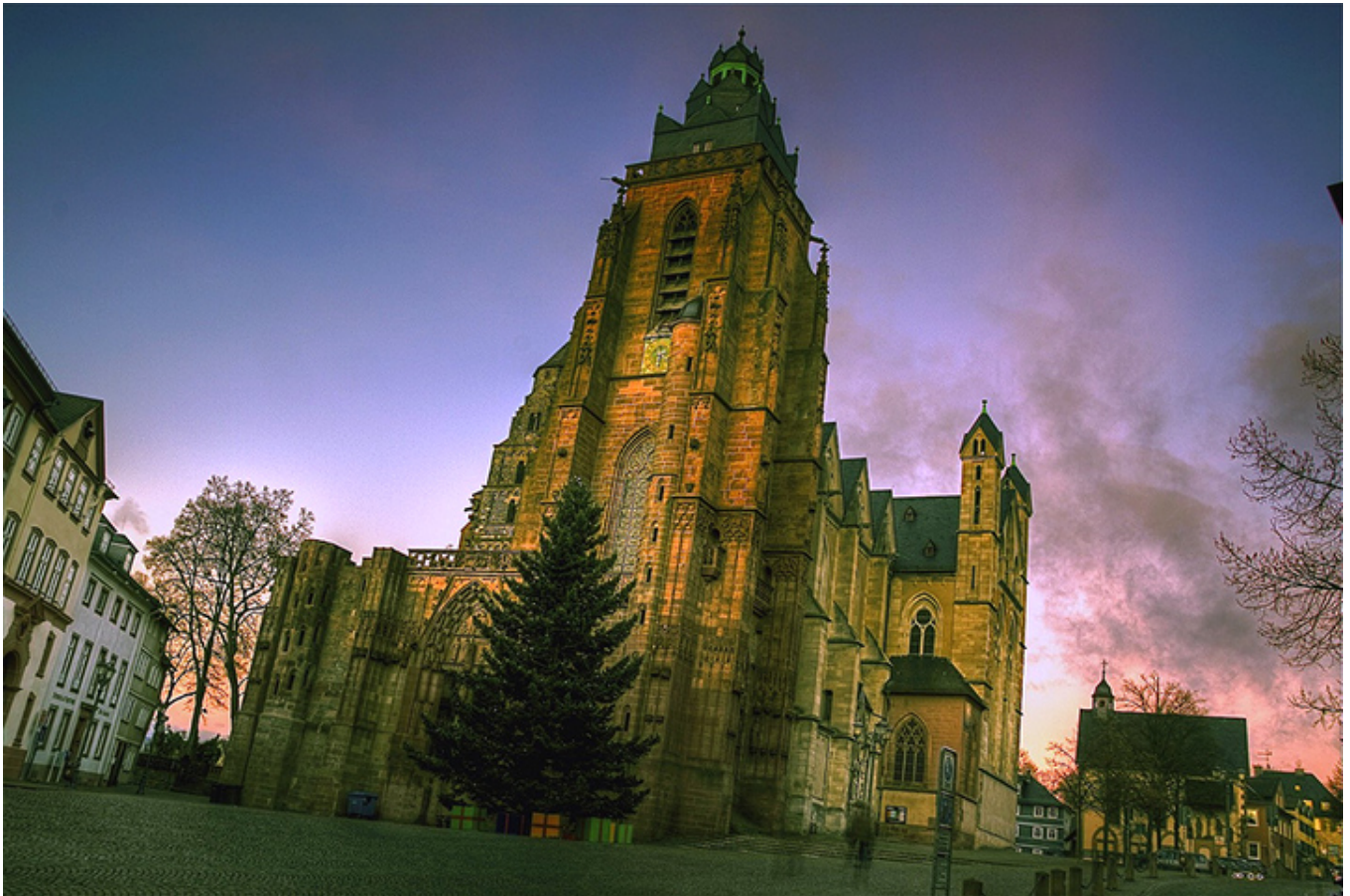
Wetzlar. Plac Katedralny.