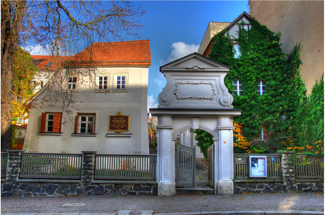
Lipsk-Gohlis. Dom Schillera.

Pamiętam, że przepisałem tam strofy „Ody do Radości” w oryginale i z entuzjazmem śpiewałem potem tę pieśń po niemiecku: