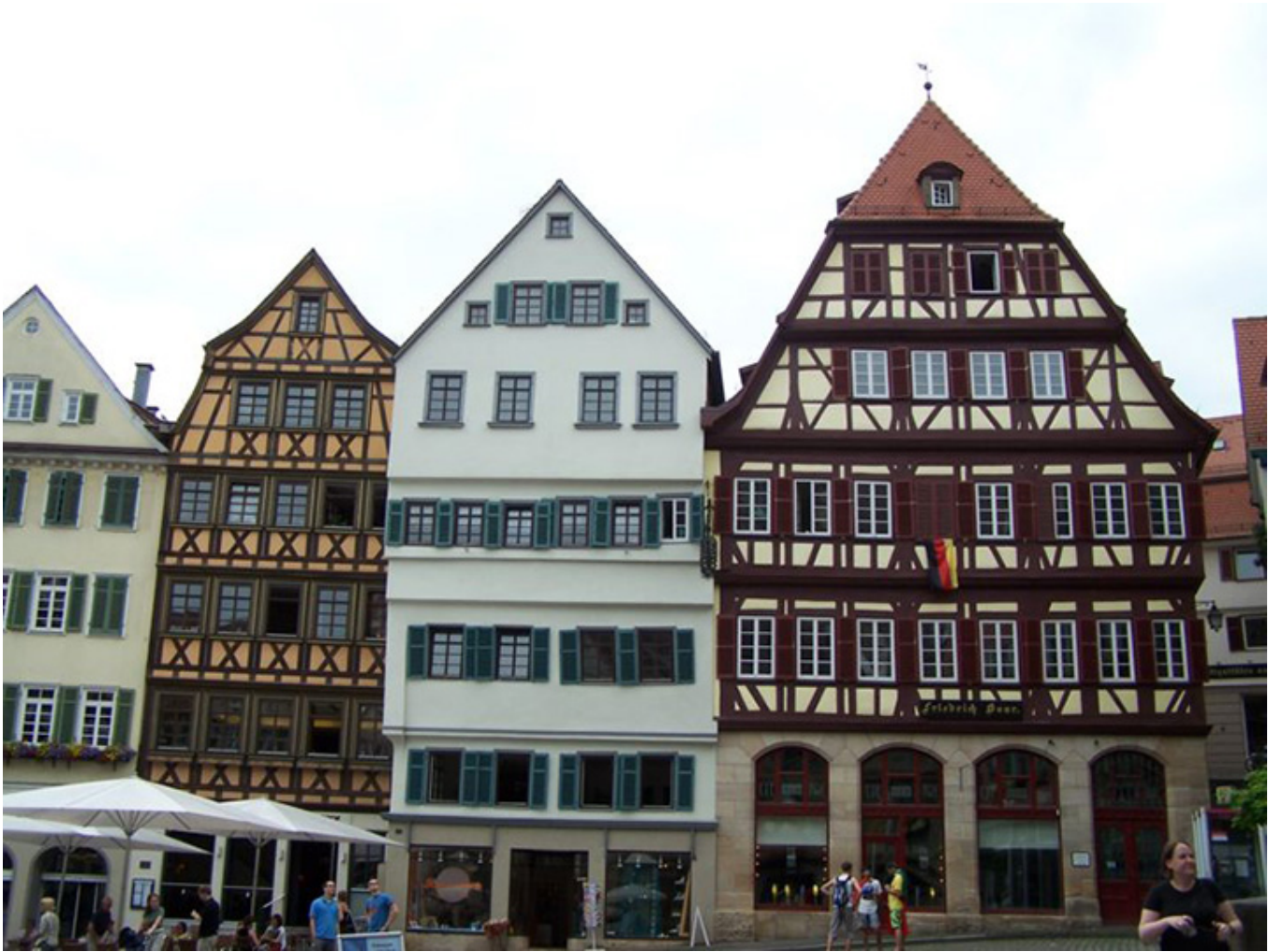
Stare kamieniczki w Tybindze.