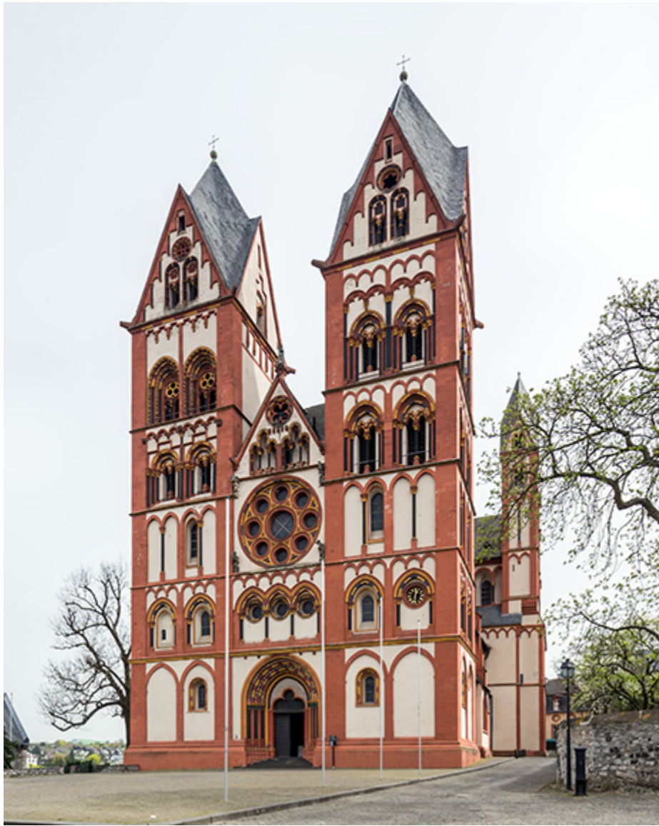
Katedra w Limburgu nad Lahnem.