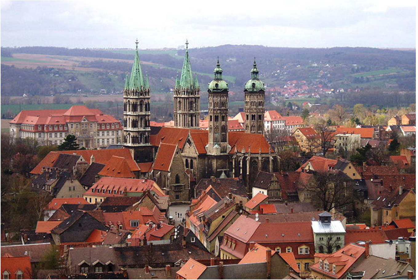
Katedra w Naumburgu.