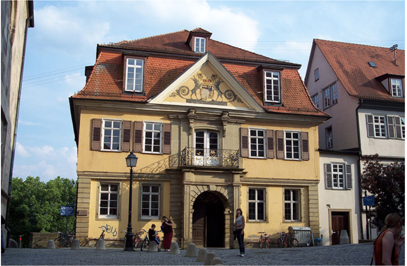
Tybinga. Najstarszy budynek Uniwersytetu – Stara Aula.