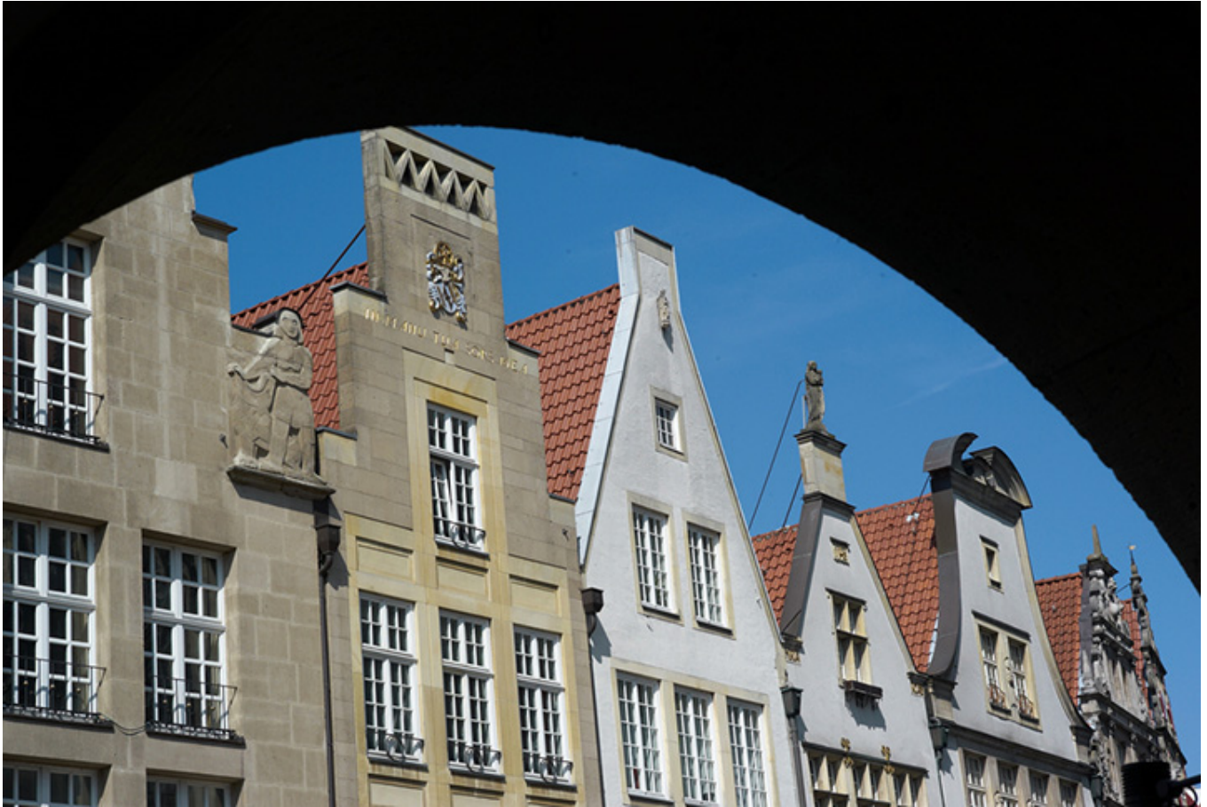
Münster. Szczyty domów.