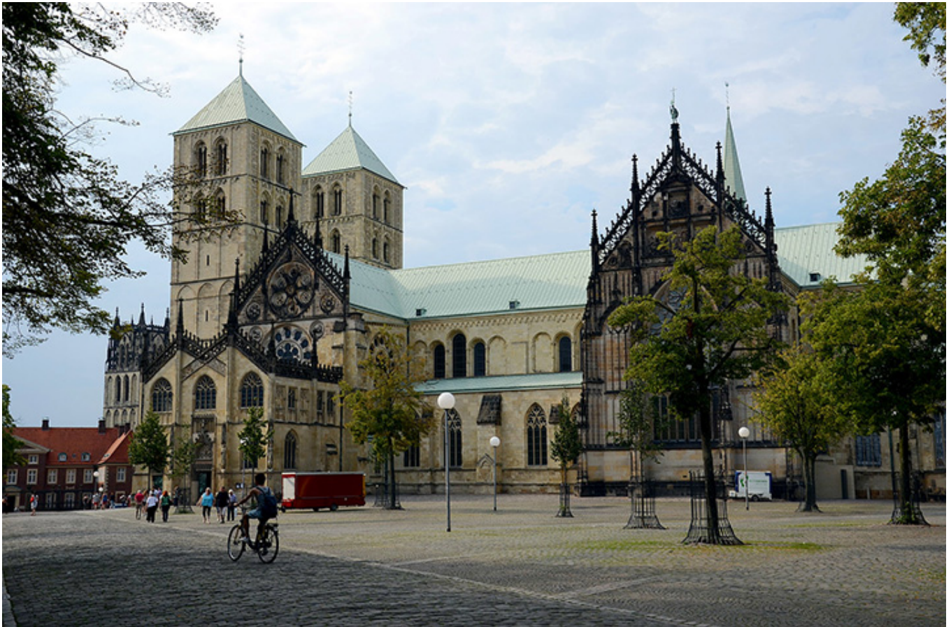
Katedra św. Pawła w Münster.