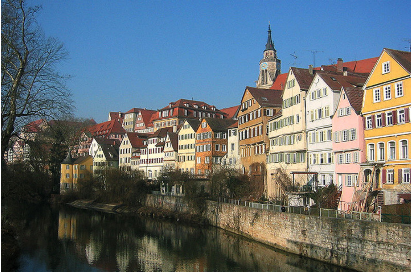
Tybinga nad brzegiem Neckaru.