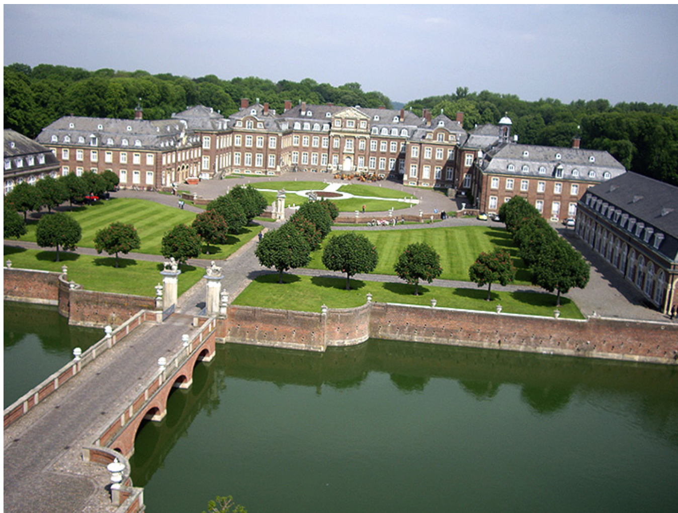
Pałac w Nordkirchen.

Panny nad Wodą, XIV w. Poza miastem barokowy pałac biskupi, XVIII w., obecnie hotel.