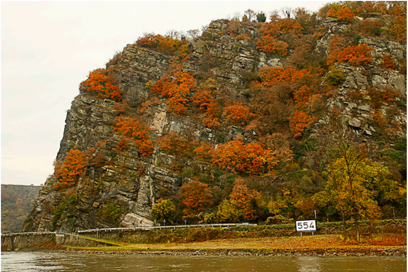
Skala Lorelei nad Renem.