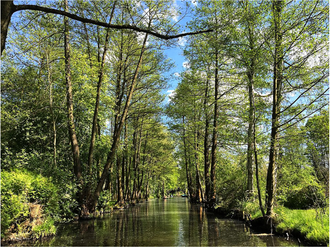
Las nad Szprewą koło Lübbenau.