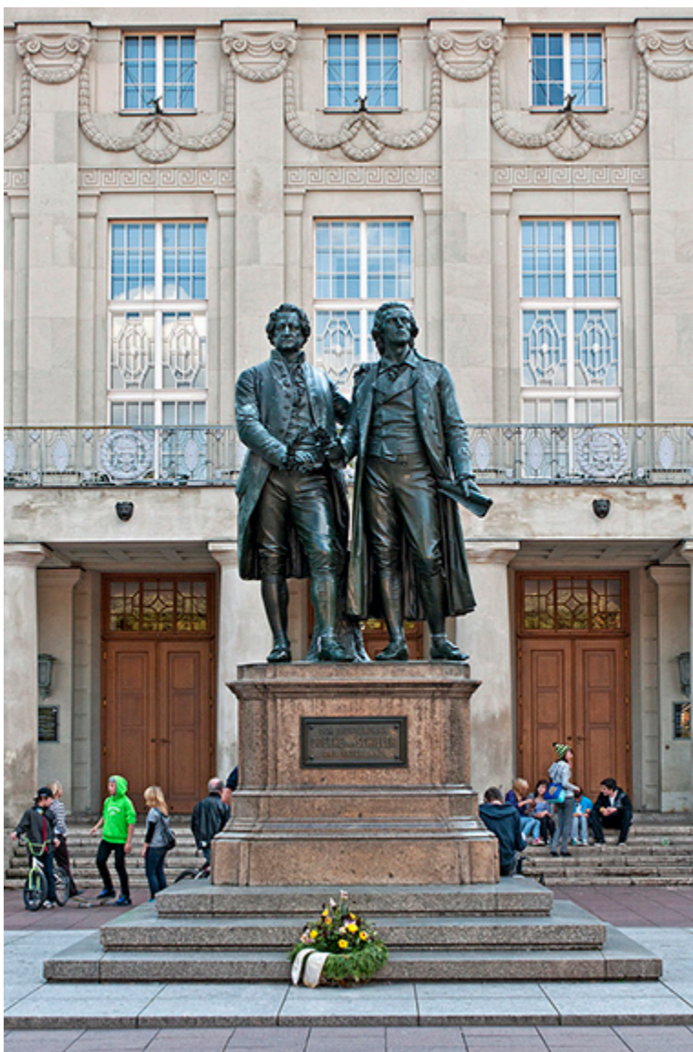
Weimar. Goethe i Schiller.