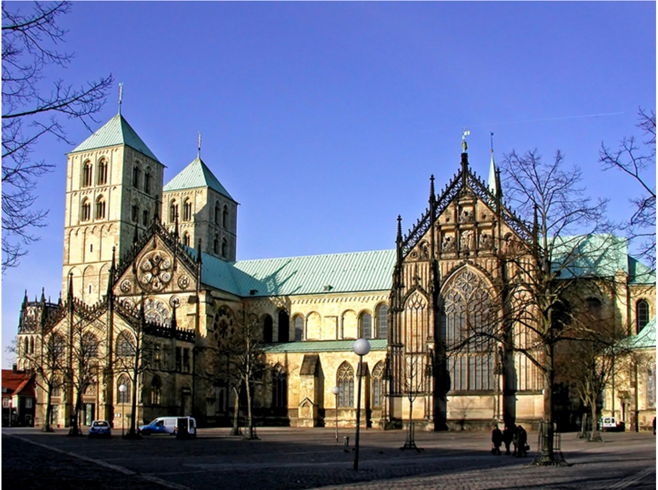
Münster. Katedra św. Pawła.

wyjątkowo urodziwe (Stary Wikariat, Pod Złotym Jeleniem), niektóre ozdobione maskami wyobrażającymi gniew, skąpstwo, nieumiarkowanie, sprośność... Nad Lahnem stary kamienny most z XII w.