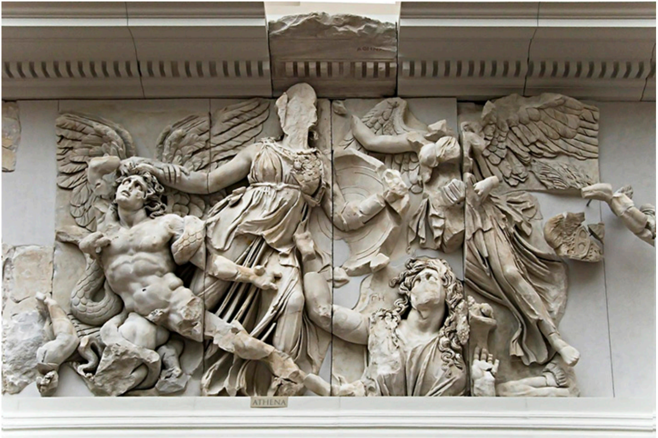
Berlin. Muzeum Pergamońskie.