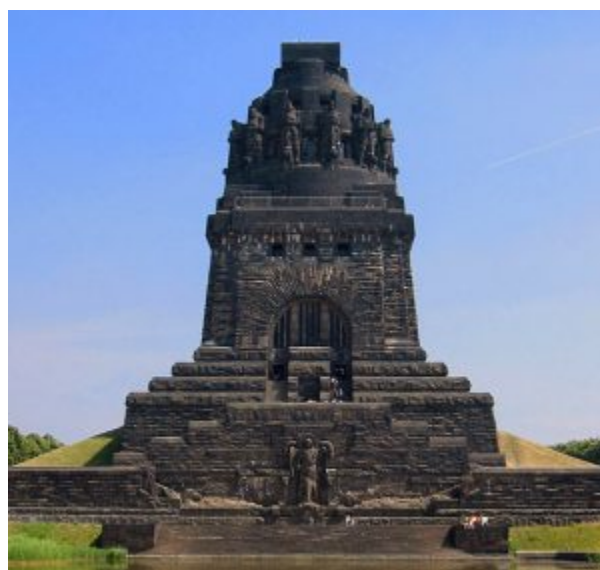
Lipsk. Pomnik Bitwy Narodów.

Trzeci raz byłem w NRD na kongresie lingwistycznym w Lipsku , chyba w 1986 r. Referaty wygłaszane przez Niemców z NRD i przedstawicieli innych krajów satelickich (z wyjątkiem mnie) były przepełnione demagogią nie mającą nic wspólnego z jakąkolwiek naukowością, były nie do strawienia. Czułem się osamotniony w moich protestach, niestety. Przy tej okazji odwiedziłem w mieście inne zabytki, których jeszcze nie znałem, gotycki trójnawowy kościół Św. Mikołaja z XII w. oraz pomnik poległych na polu Bitwy Narodów w 1813 r., gdzie Napoleon poniósł sromotną klęskę. Pojechałem też na przedmieście Gohlis , gdzie w małym uroczym jednopiętrowym domku zwiedziłem muzeum Schillera.