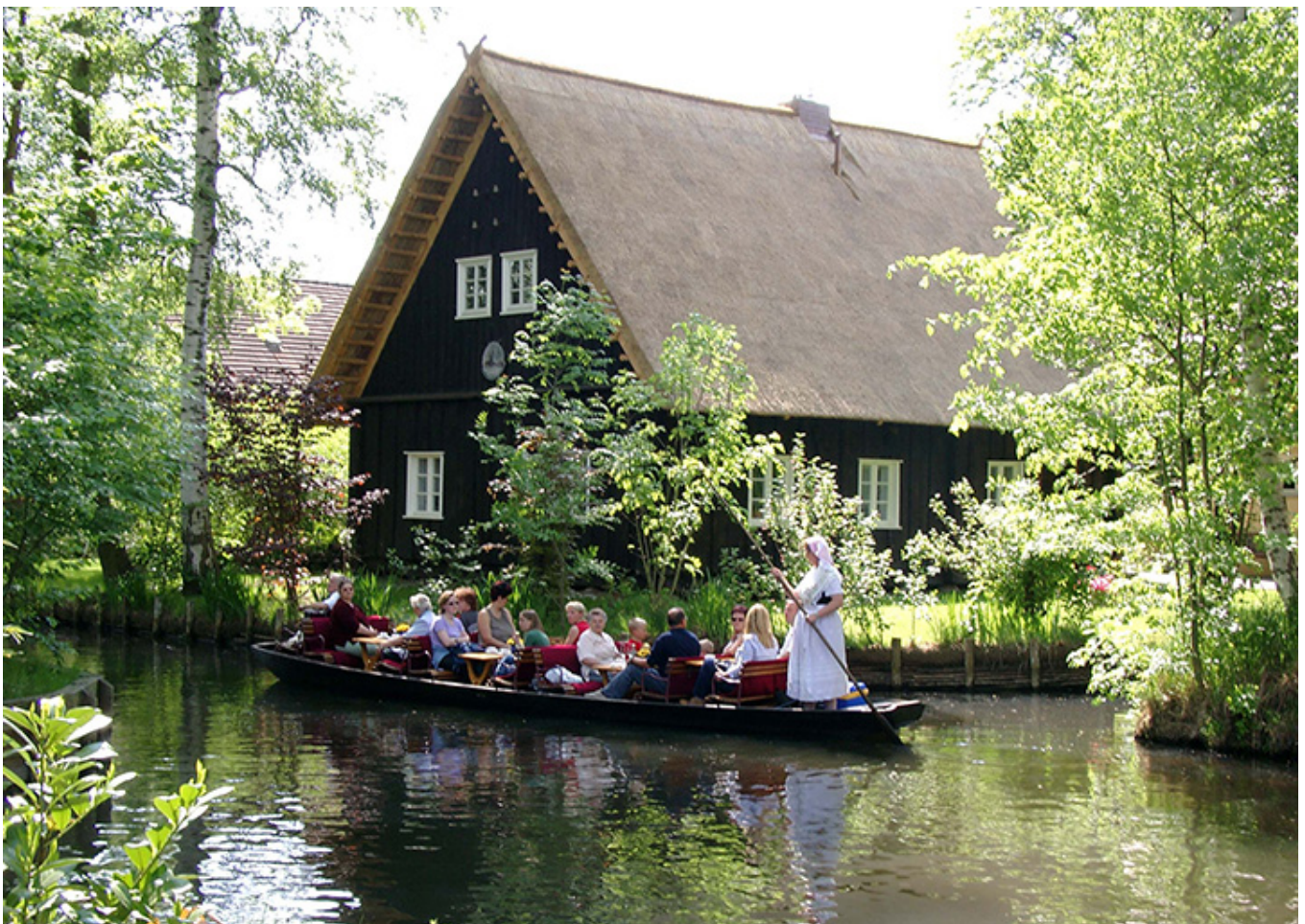
Spreewald, czyli Las nad Szprewą.