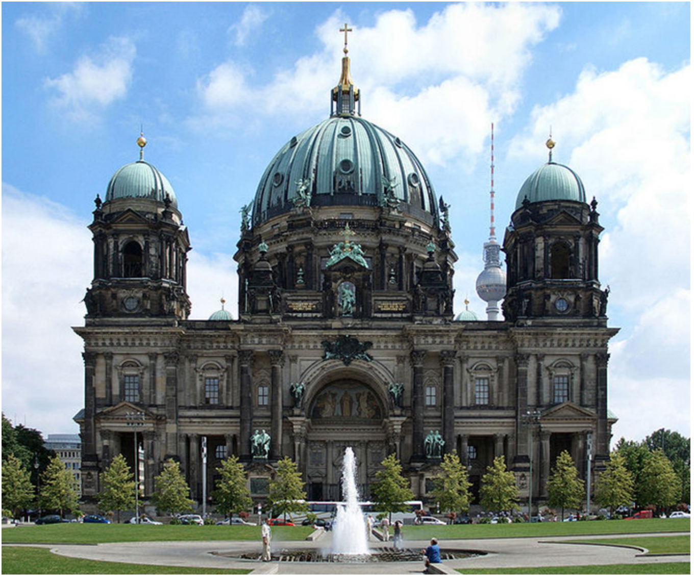
Katedra ewangelicka w Berlinie.