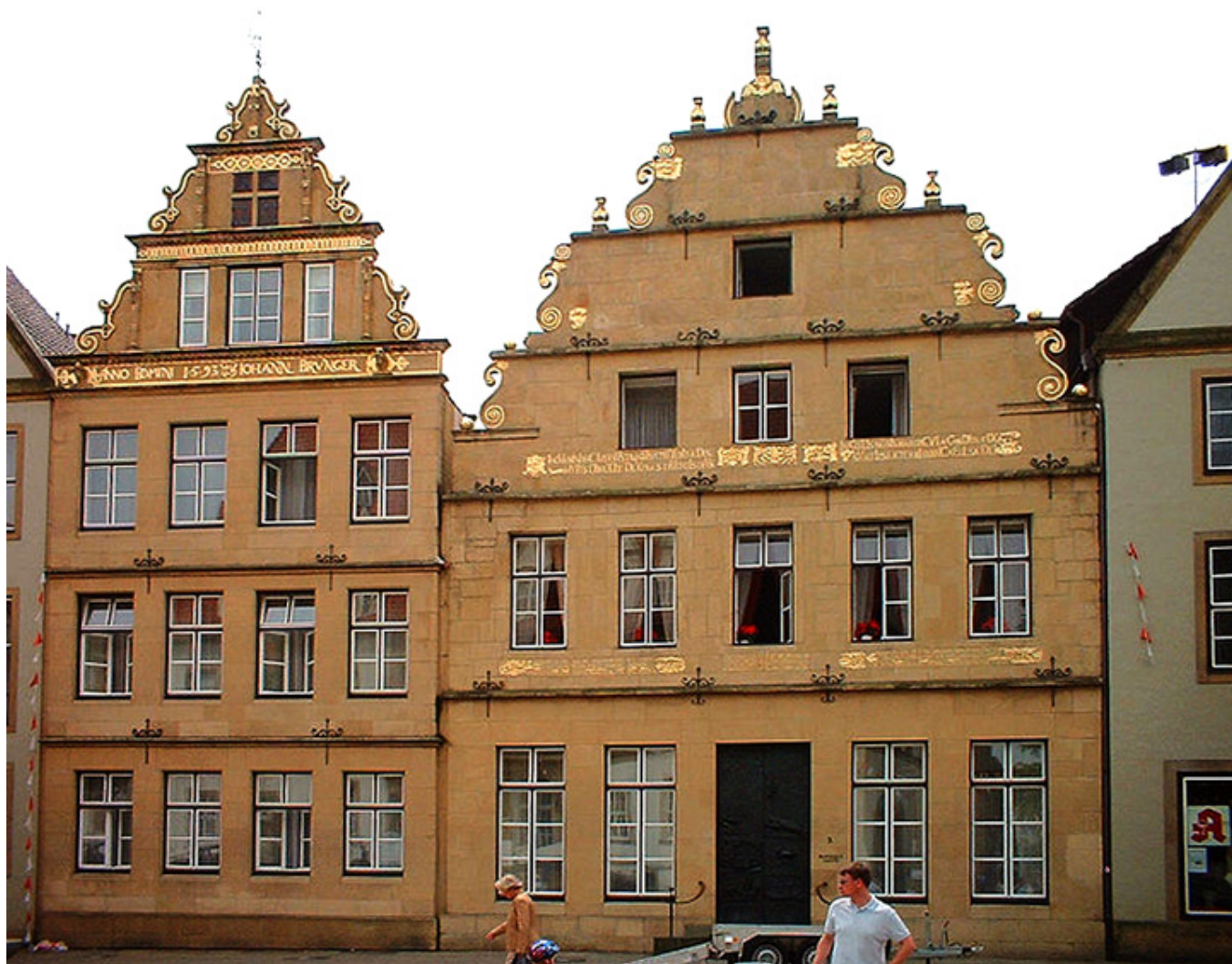
Bielefeld. Stary Rynek.

całym regionie Westfalii . Szczerze mówiąc, poza ogromem pałacu i parku pamiętam z tej wyprawy tylko tyle, że w pałacowej kawiarni jadłem najlepszy tort czereśniowy w moim życiu! To była absolutna delicja!!!