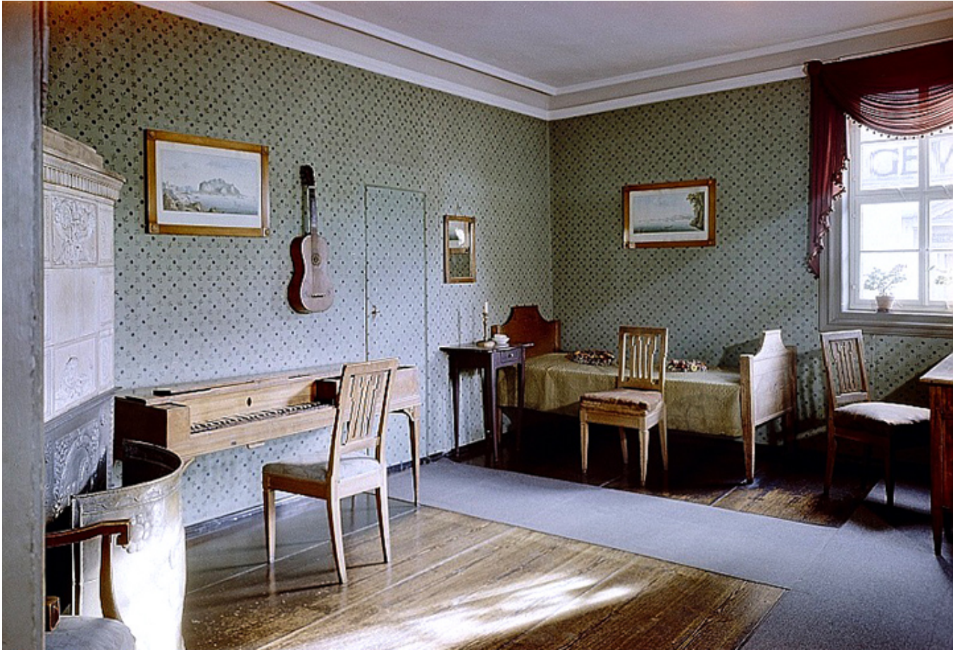
Weimar. Pokój Schillera.