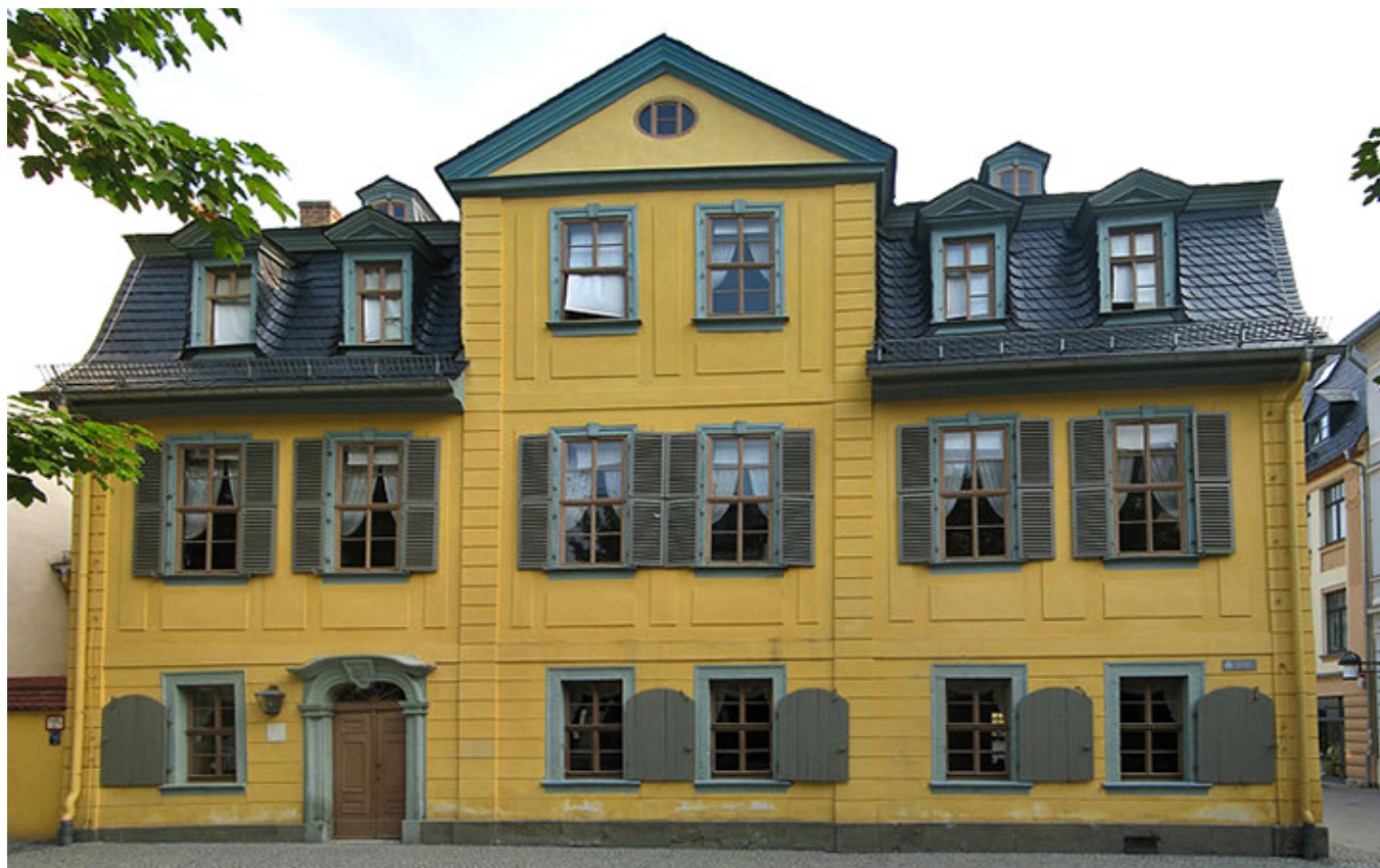
Weimar. Dom Schillera.