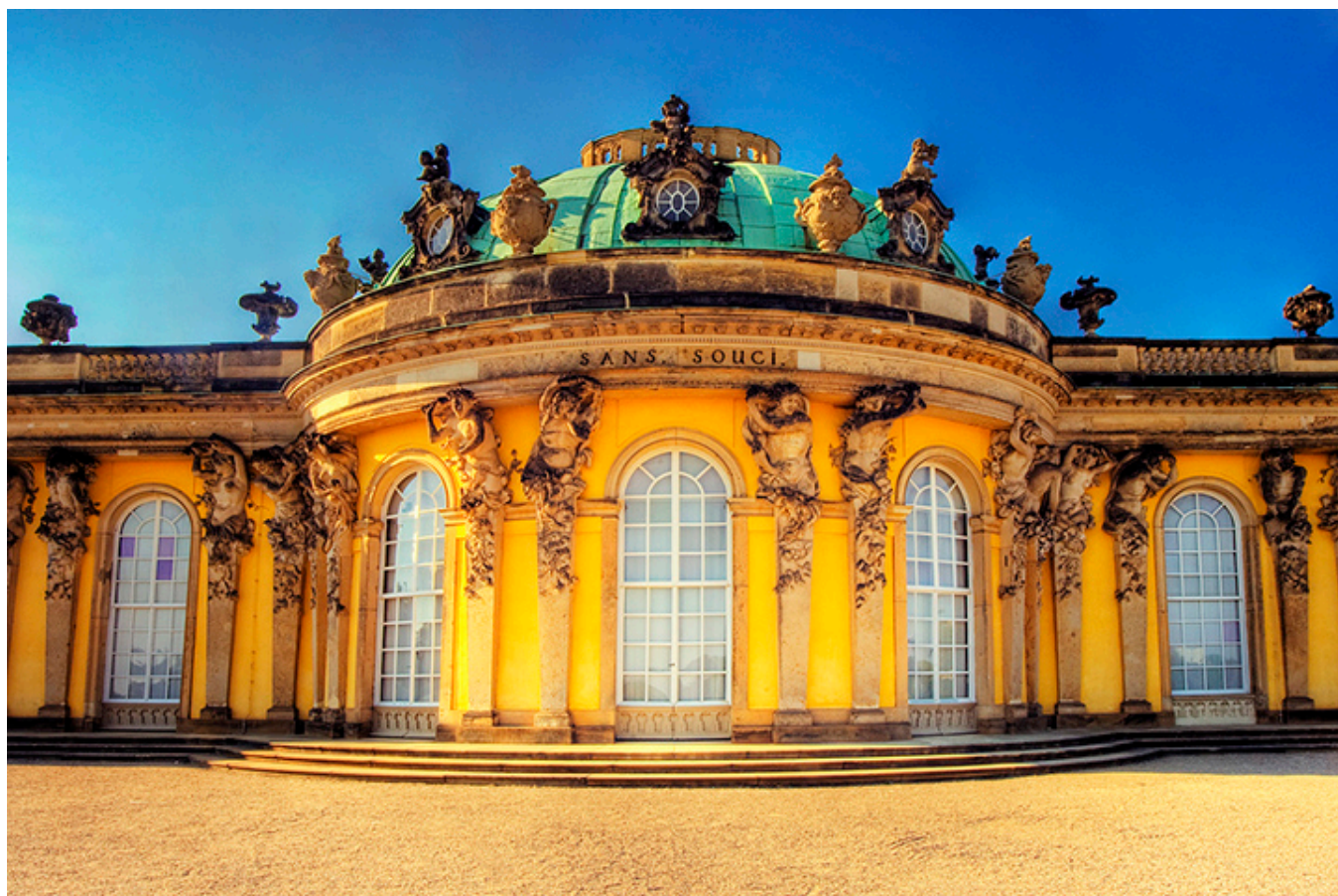
Poczdám. Pałac Sans Souci.