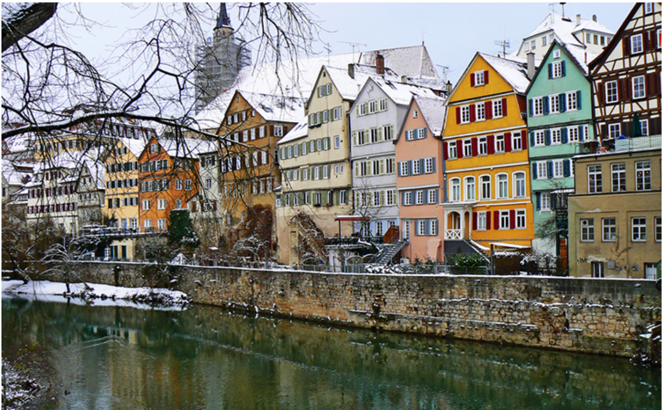
Tybinga nad Neckarem.