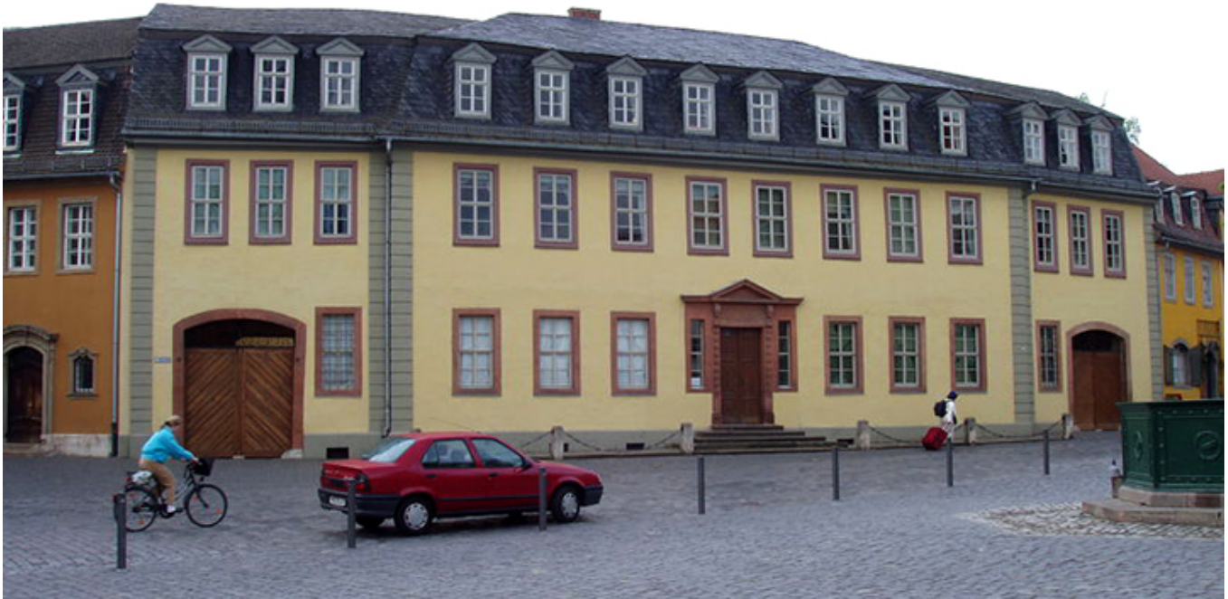
Weimar. Dom Goethego.

Dom Schillera jest znacznie mniejszy, ale równie ciekawy, co dom Goethego, więc i tam zabawiłem dość długo. Obaj poeci właśnie w Weimarze dokonali swego żywota, Schiller w 1805 r., a Goethe w 1832 r.