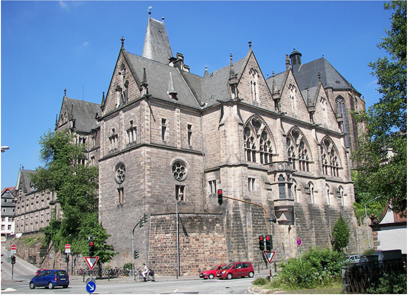
Marburg. Stary Uniwersytet.