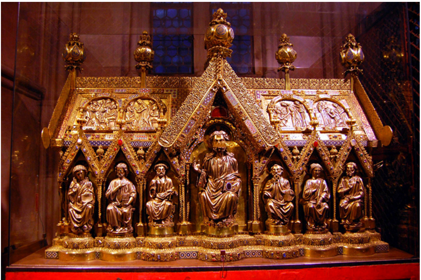
Marburg. Kościół św. Elżbiety. Gotycki relikwiarz.

Następnego dnia Wetzlar , nad tą samą, ale szerszą tutaj rzeką Lahn. Domy kryte dachami z czarnych łupków bitumicznych. Potężna jednowieżowa gotycka katedra z XIII-XV w., ozdobiona portalami głównym i wieżowym, gotyckim tympanonem, a wewnątrz freskami i piękną czternastowieczną Pietą. Stare szachulcowe domy o szerokich fasadach, niektóre z XIV w., wspaniałe! Wśród nich skromny domek Goethego. To tu poeta pisał Cierpienia młodego Wertera ( Die Leiden des junges Werthers ), a natchnieniem do tej powieści był jego związek z mieszkającą w tym mieście Charlottą Buff. Ciekawostką jest fakt, że to ja byłem tam przewodnikiem turystów niemieckich, którym