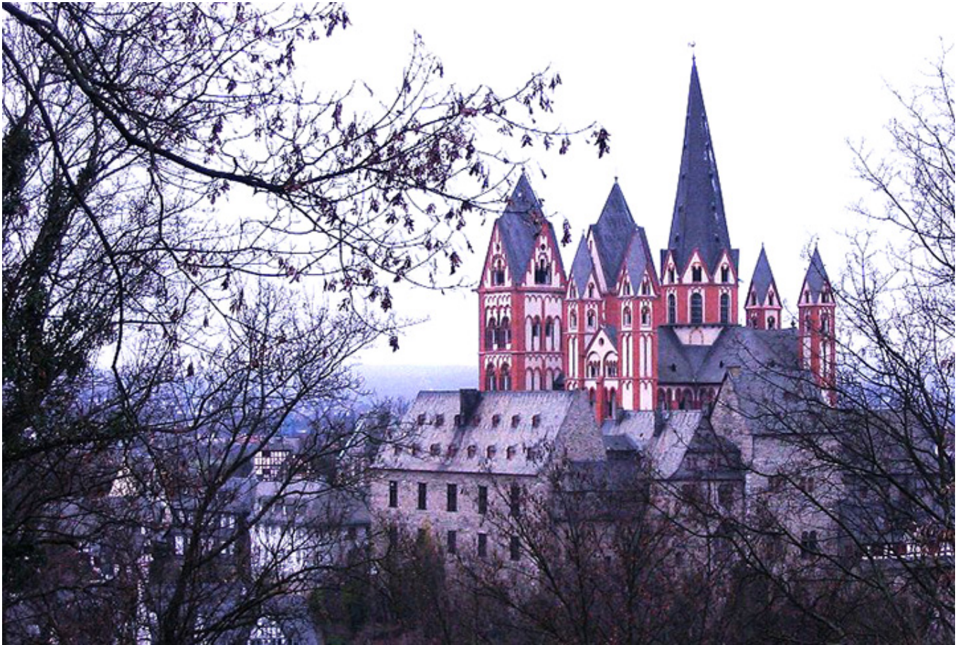
Katedra i zamek w Limburgu.