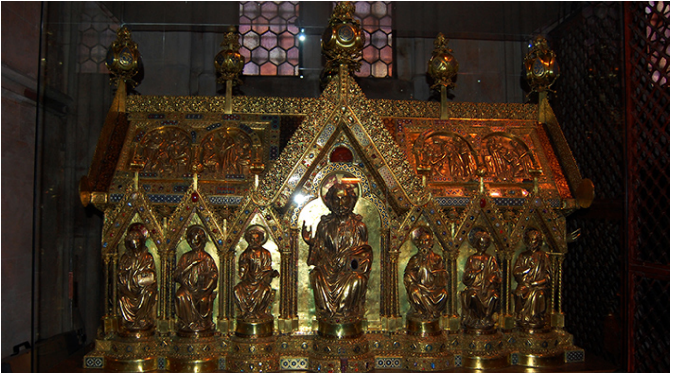
Relikwiarz św. Elżbiety w Marburgu.