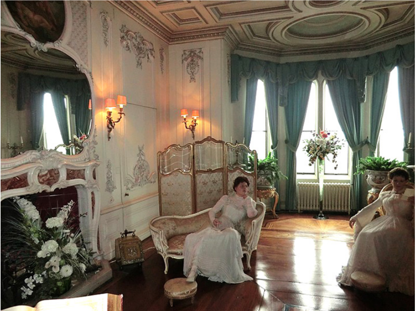
Salon w zamku Warwick, Wielka Brytania, XIX w., ilustracja książkowa