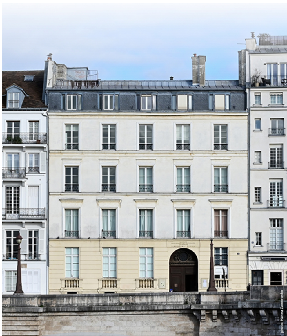
Fasada Biblioteki Polskiej w Paryżu

stałej, obok aktu ufundowania Biblioteki znajduje się akt detronizacji cara, który uważamy za duchowy, symboliczny kamień węgielny. Nie udało się wywalczyć wolności w powstaniu, ale emigranci przywieźli ze sobą idee niepodległościowe i przechowali je tutaj jako depozyt na przyszłość. Misją Biblioteki Polskiej było od początku gromadzenie, utrzymanie i poszerzanie zbiorów oraz przybliżanie kultury polskiej Francuzom i szerzej: całej Europie.