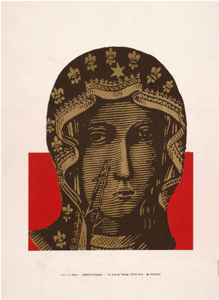
Anonim, 1981 r.