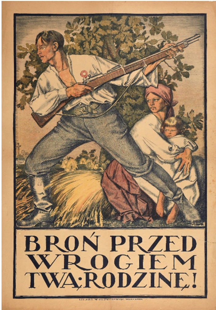
Anonim, 1920 r.