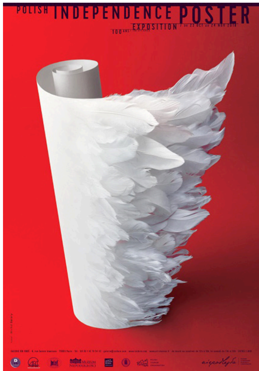
Projekt plakatu: Michał Batory.

Wystawa prezentuje wybór polskich plakatów niepodległościowych z różnych epok, związanych z szeroko pojętą walką o wolność i niepodległość. Znajdują się wśród nich m.in. plakaty nawołujące do walki zbrojnej (z okresu I i II wojny światowej czy wojny polsko-bolszewickiej) lub poparcia czynu zbrojnego czy wsparcia humanitarnego ofiar konfliktów, ale także dzieła propagandowe, wspierające i