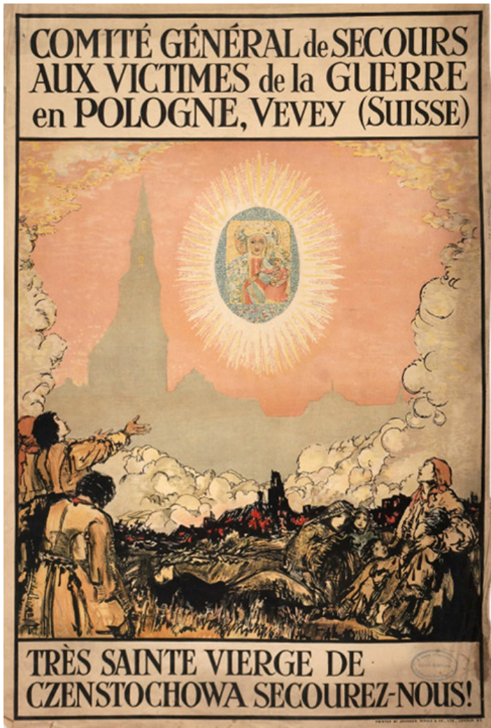
Anonim, 1914-1915 r.