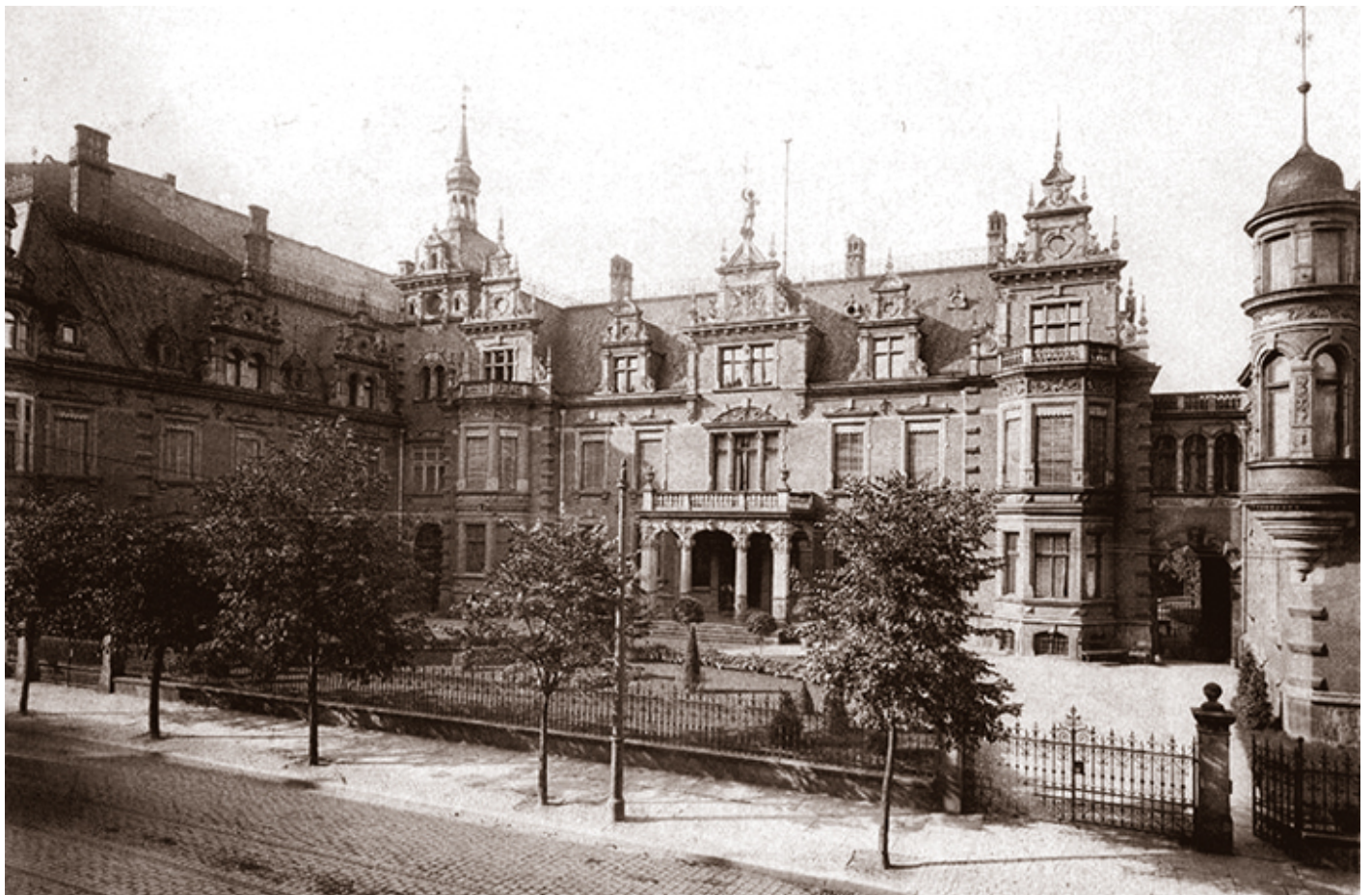
Pałac Schaffgotschów we Wrocławiu, lata 1900-1910, po II wojnie światowej legendarny klub studencki „Pałacyk”