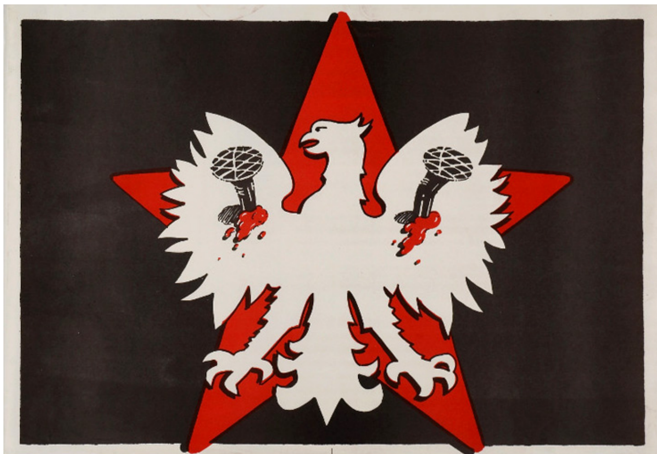
Anonim, 1981-82 r.

Polski. Wystawa jest częścią projektu „W służbie sztuce i ojczyźnie”, organizowanego przez Galerię Roi Doré oraz platformę Art-maniac, którego celem jest promocja wiedzy o historii Polski - od wydarzeń związanych z odzyskaniem przez Polskę niepodległości poprzez jej losy od tego przełomowego momentu aż do dnia dzisiejszego - a także o związkach między sztuką i historią. Projekt „W służbie sztuce i ojczyźnie” szczególną uwagę poświęca roli artystów w walce o wolną i niepodległą Polskę.