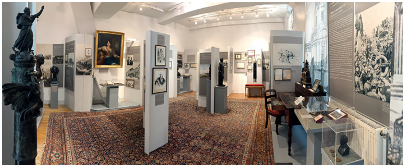
Muzeum Adama Mickiewicza

dziedzictwu niemieckiemu. Resztę planowano skonfiskować i ewentualnie zniszczyć. Po wkroczeniu do Paryża hitlerowcy od razu zajęli budynek Biblioteki, ale jej pracownicy zdążyli ukryć i przechować większość zbiorów, a po wojnie odzyskali sporą część zagrabionych.