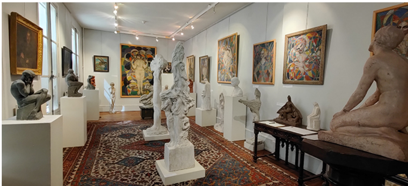
Muzeum Bolesława Biegasa

Obok Mickiewicza i Chopina ma u Państwa osobną salę