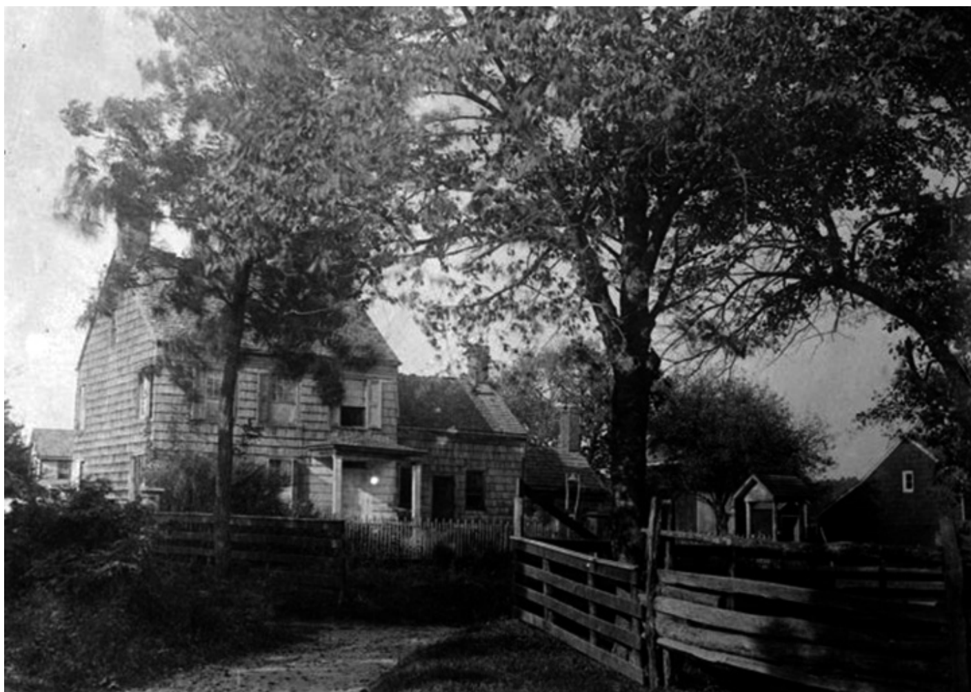
Miejsce urodzenia Walta Whitmana, Amityville Road (State

Łączy się cieleśnie z ziemią, zanurza się w jej ogromnych kosmicznych przestrzeniach, zaludnia je i na końcu wydaje swój plon, potomstwo, czyli wiersze, i idąc dalej tym tropem czytelników, czyniąc z siebie i Ameryki jakąś wyjątkowość, której wcześniej żaden kraj nie miał. On osobiście odnosi sukces i Ameryka odnosi sukces. Odnalazł swój głos, nowy głos poezji amerykańskiej i Ameryka odnalazła swoje miejsce w świecie.