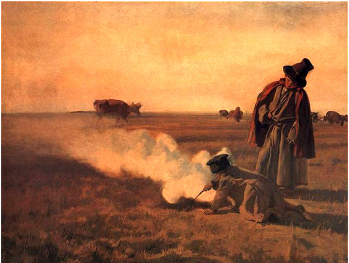
Józef Chełmoński, Jesień, rok 1897, olej/plótno; 95 cm x 124 cm, Muzeum Narodowe w Poznaniu.