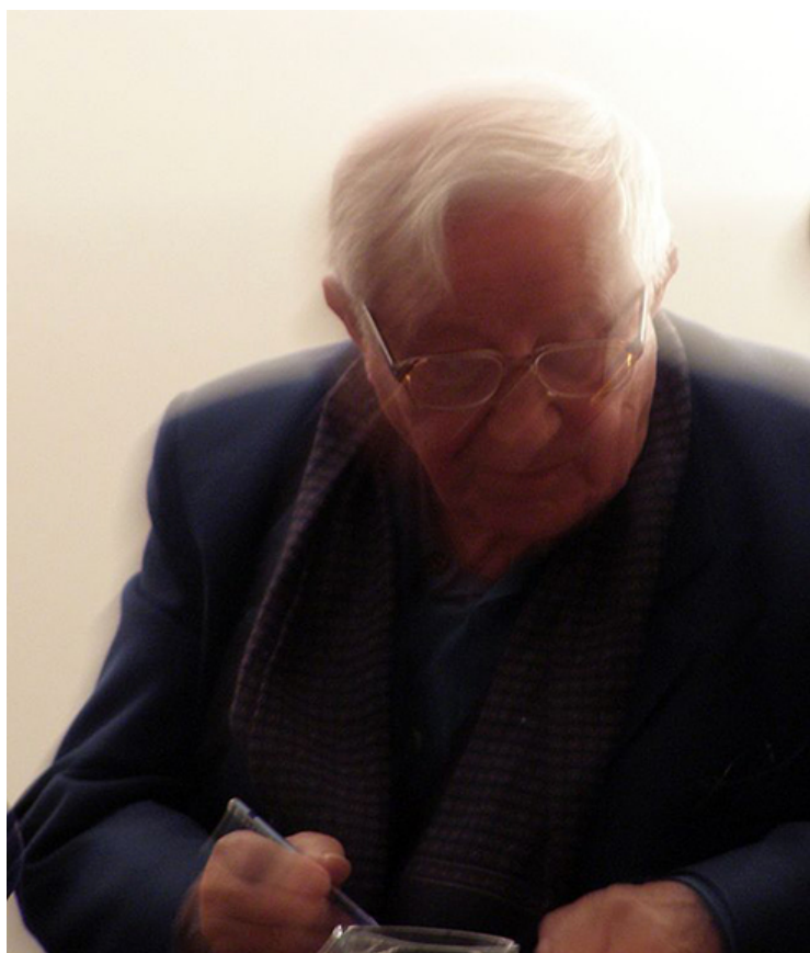
Tadeusz Różewicz, Praga 2007 r.