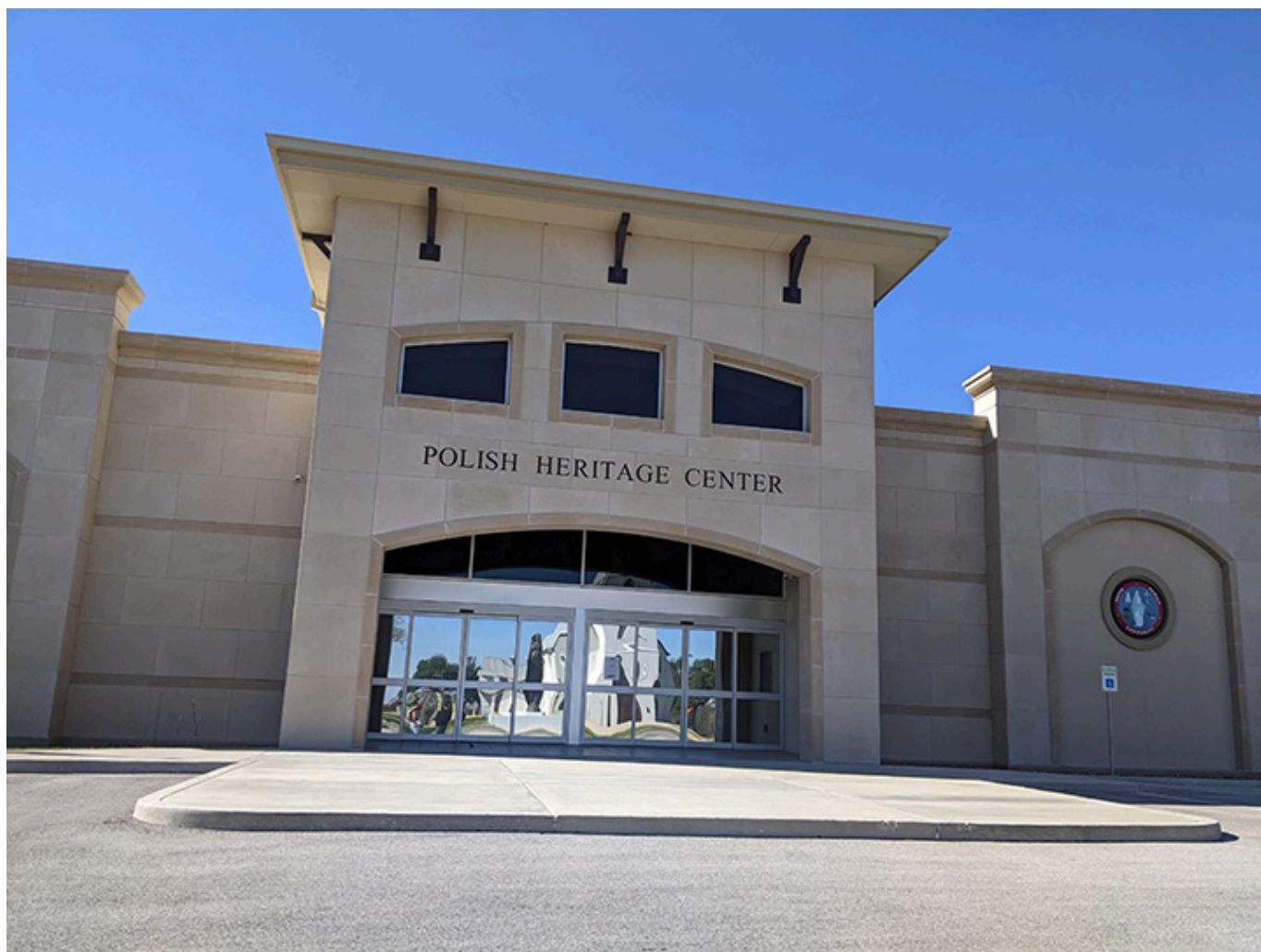
Polish Heritage Center w Pannie Marii w Teksasie, na przeciwko kościoła