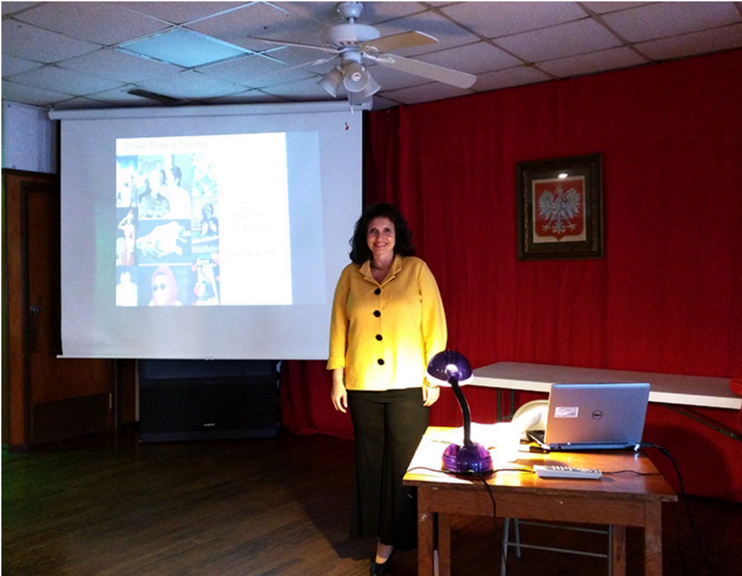
Prelekcja na temat polskiego teatru w Toronto, 6 marca 2016 r. w Polish-American Center w San Antonio, fot. Jacek Gwizdka