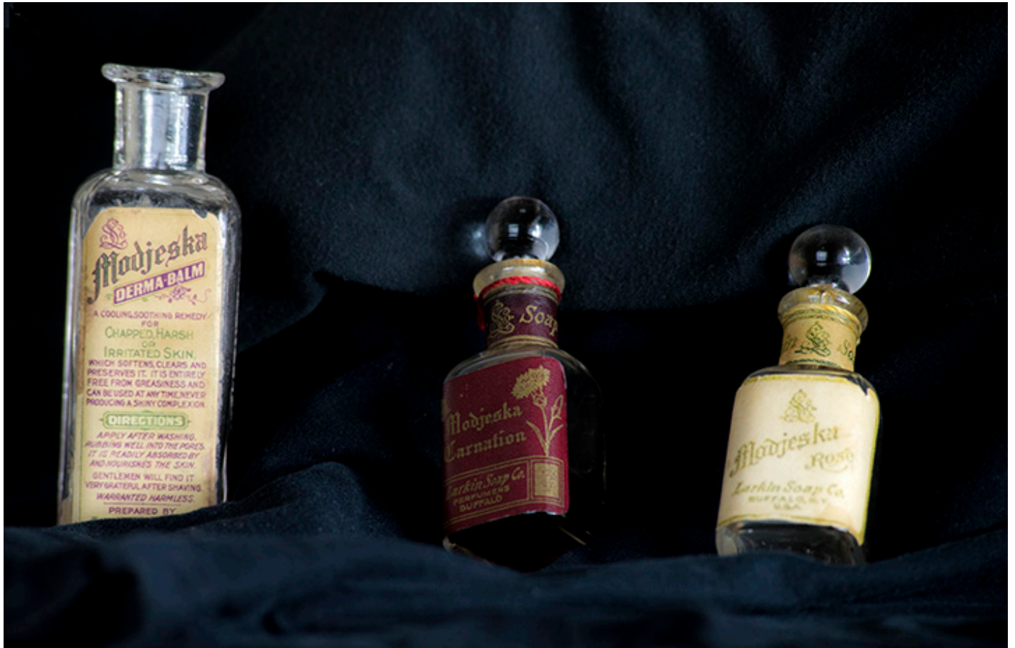
Opakowania po kosmetykach Modjeska, kolekcja własna, fot. Jacek Gwizdka