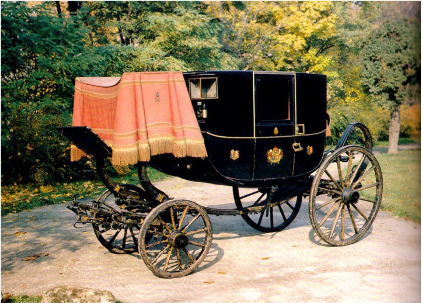
Kareta galowa berlina, Marker i Karasch, Wiedeń, I poł. XIX w. Na stopniach przy koźle data „1830” i monogram „H.W.”