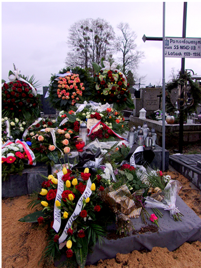
Pożegnanie prof. Zbigniewa Judyckiego na cmentarzu w Opatowie