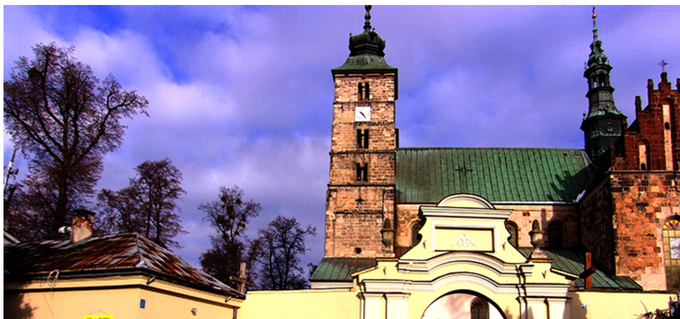
Kolegiata pod wezwaniem świętego Marcina w Opatowie, fot. Rozalia Nowak