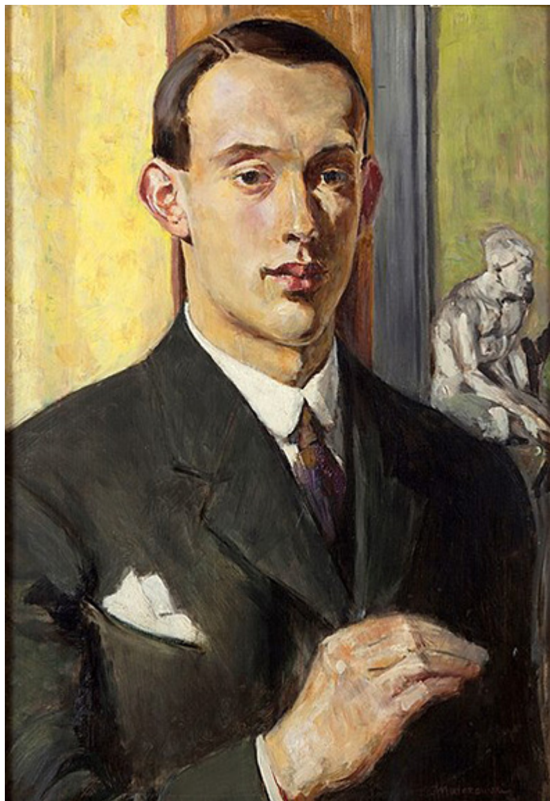
Jacek Malczewski, Portret syna Rafała, ok. 1912 r., Muzeum im. Jacka Malczewskiego w Radomiu

Malarstwo Rafała Malczewskiego określano najpierw jako nadrealistyczne, prymitywizujące, potem, wraz z ewolucją stylu w stronę niemieckiego ekspresjonizmu, pisano o swoistym realizmie magicznym. Z jednej strony artysta był mistrzem pejzażu górskiego, z drugiej, jeżdżąc na Śląsk odkrył pejzaż industrialny, który w jego wydaniu przepojony był melancholią. Zarówno śnieżnobiałe pejzaże Tatr, jak czarny Śląsk, przedstawiane przez Malczewskiego w stylizacji dziwnej pustki i nostalgii, należały do malarstwa metafizycznego. Malarz nie rezygnował z realistycznej metody obrazowania, z drugiej, dokonywany przez niego zabieg uproszczenia formalnego powodował, że przedstawiony pejzaż bądź wnętrze, stawały się prawie abstrakcyjną wizją sprawiającą wrażenie bycia realnymi i nierealnymi